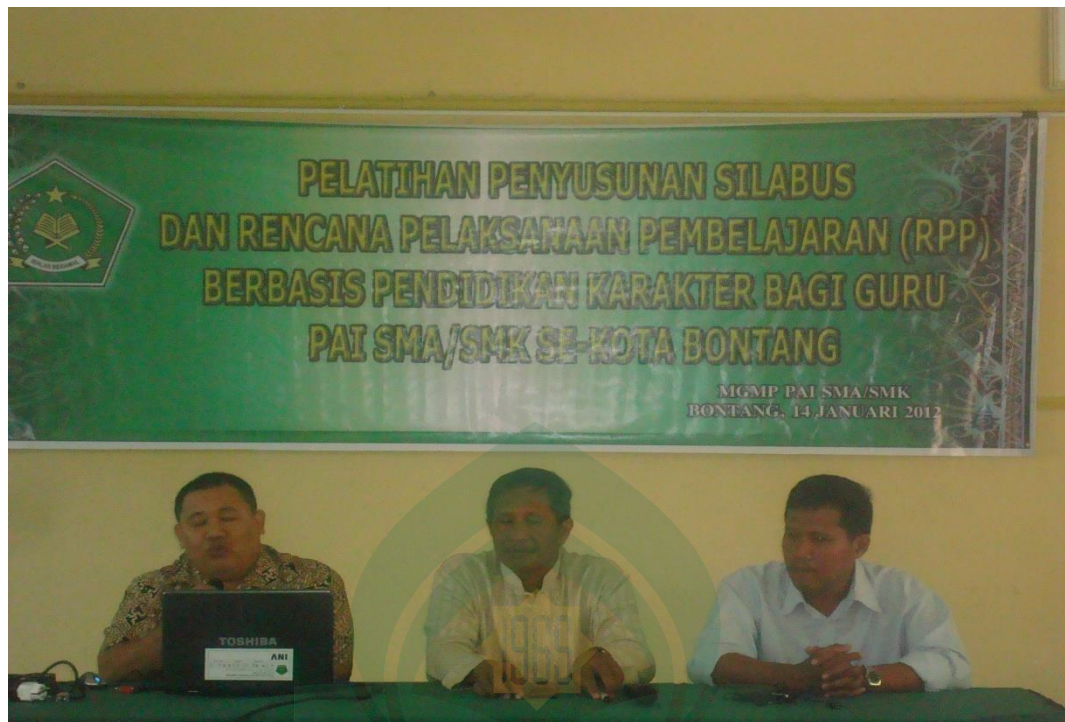
Foto Kegiatan Pelatihan Penyusunan Perangkat Pembelajaran Oleh Pengawas PAI Kota Bontang, Tanggal 14 Januari 2012