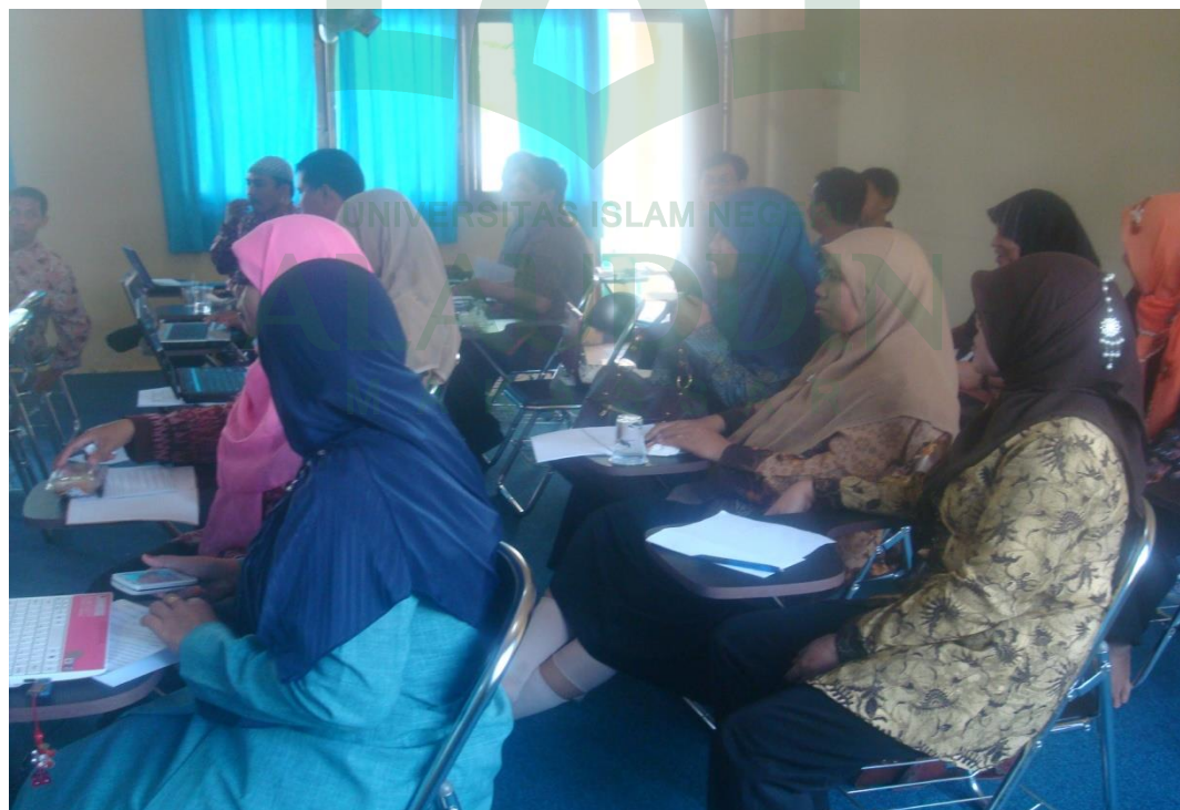
Foto Kegiatan Pelatihan Penyusunan Perangkat Pembelajaran Guru PAI SMA/SMK Kota Bontang, Tanggal 14 Januari 2012