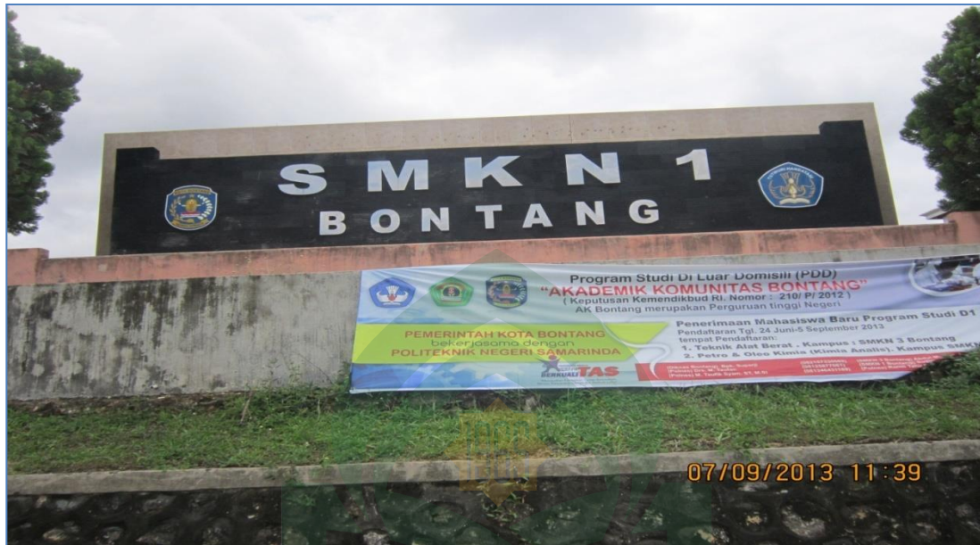
Papan Nama SMK Negeri 1 Bontang, 7 September 2013