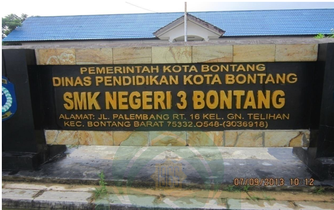
Papan Nama SMK Negeri 3 Bontang 7 September 2013