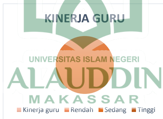
Gambar 2.3 Diagram Kategorisasi Kinerja Guru

Data pada tabel 2.6 menunjukkan bahwa hasil penelitian diperoleh 22 responden yang menilai sedang dengan persentase 86.4%. Berdasarkan nilai rata-rata (lihat tabel 2.5) diperoleh bahwa kinerja guru di Madrasah Aliyah GUPPI Samata sebesar 9,250 berada pada kategori sedang. Selanjutnya, jumlah persentase pada tiap-tiap interval kinerja guru dapat digambarkan pada diagram lingkaran berikut: