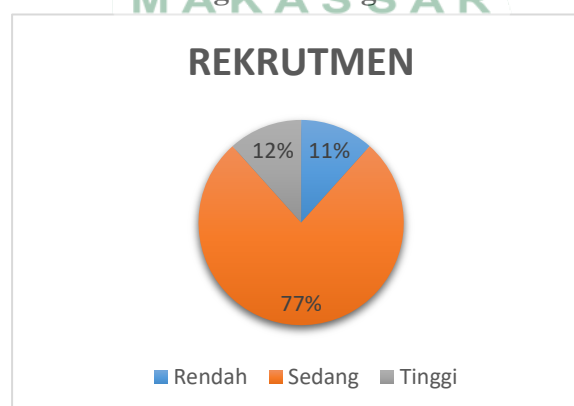
Gambar 1.2 Diagram Kategorisasi Rekrutmen

Data pada tabel 2. 2 menunjukkan, 22 responden yang nilai sedang dengan presentase 86,4%. Berdasarkan nilai rata-rata (lihat tabel 2.2) diperoleh bahwa rekrutmen di Madrasah Aliyah GUPPI Samata sebesar 9.162 berada pada kategori sedang. Selanjutnya, jumlah presentase pada tiap-tiap interval rekrutmen dapat digambarkan pada diagram lingkaran berikut: