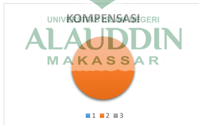
Gambar 2.2 Diagram Kategorisasi Kompensasi

Data pada tabel 2.4 menunjukkan bahwa hasil penelitian diperoleh 22 responden yang menilai sedang dengan presentase 9.01% Berdasarkan nilai rata-rata (lihat tabel 2.3) diperoleh bahwa kompensasi di Madrasah Aliyah GUPPI Samata sebesar 81,10 berada pada kategori sedang. Selanjutnya, jumlah presentase pada tiap-tiap interval kompensasi dapat digambarkan pada diagram lingkaran berikut: