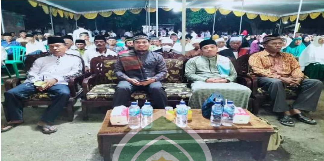
Acara Hafiah tilawah pada acara pernikahan masyarakat Kecamatan Bolo Kabupaten Bima