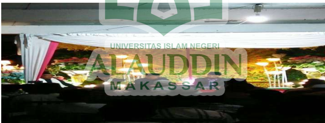
Kegiatan haflah diacara pernikahan masyarakat Kecamatan Bolo.