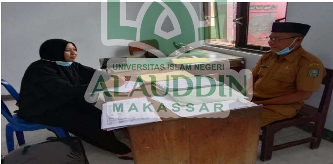
Wawancara dengan Jamaludin H. A. Thalib selaku tokoh pencinta Qur'an pada tanggal 07 September 2021