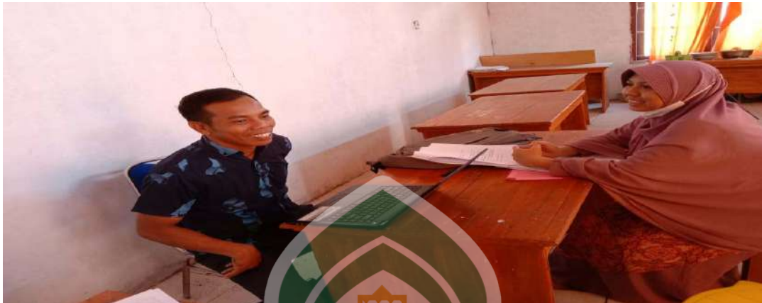
Wawancara dengan Tokoh masyarakat Rada Kecamatan Bolo Kabupaten Bima pada tanggal 01 September 2021