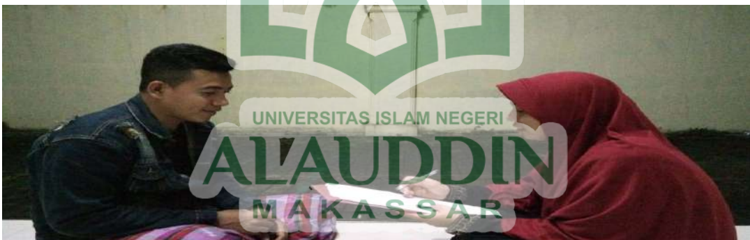
Wawancara dengan Muhtar SP sebagai Qori pada tanggal 10 Oktober 2021.