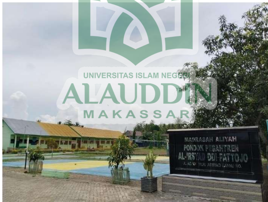
Lokasi Penelitian MA DDI Pattojo Kab. Soppeng