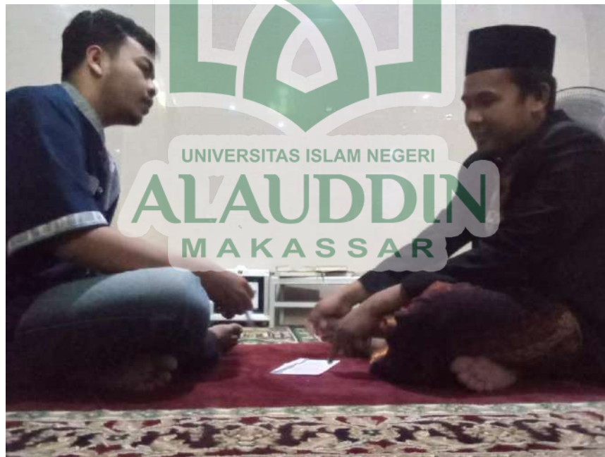
Wawancara dengan Wakil Kepala Madrasah MA DDI Pattojo