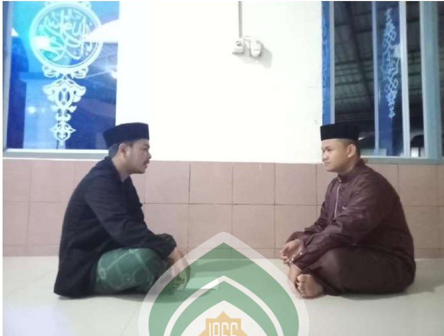
Wawancara dengan Peserta Didik MA DDI Pattojo