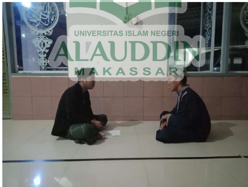
Wawancara dengan Peserta Didik MA DDI Pattojo