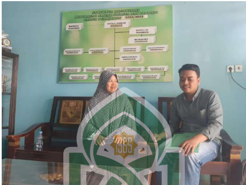
Wawancara dengan Guru Mata Pelajaran Akidah Akhlak MA DDI Pattojo