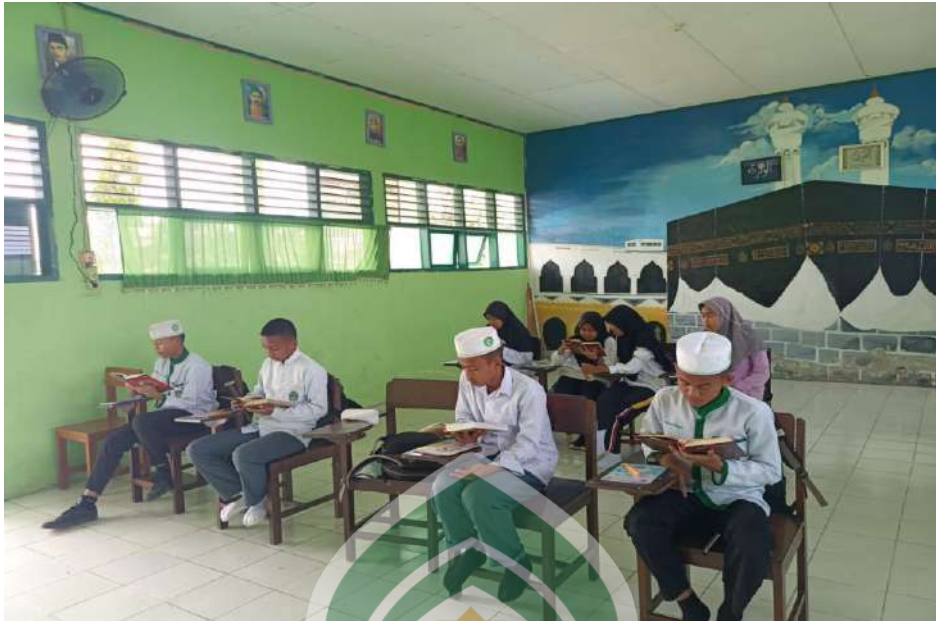
Peserta Didik Membaca Al-Qur'An sebelum Memulai Pembelajaran