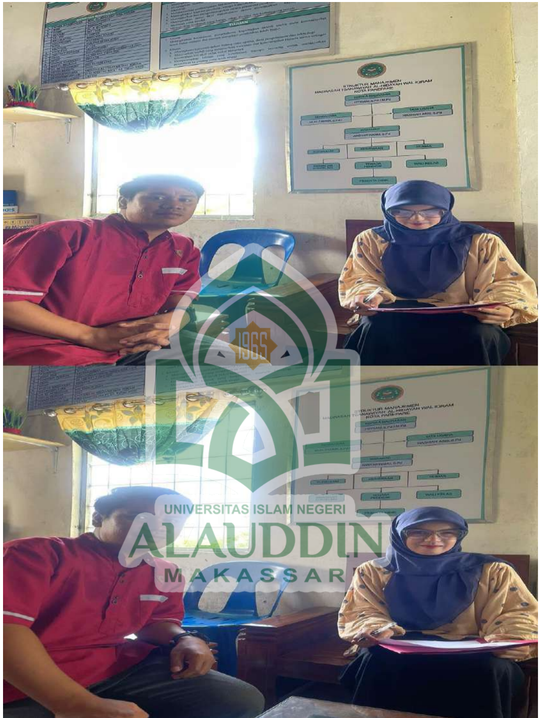
(Wawancara Dengan Wakil Pimpinan Pondok Pesantren)