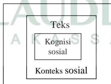
Gambar 2.4: Model analisis kognisi sosial van Dijk

Analisis van Dijk menghubungkan analisis tekstual ke arah analisis yang komprehensif; bagaimana teks diproduksi, baik dalam hubungannya dengan individu, wartawan dan masyarakat. Model analisis van Dijk digambarkan sebagai berikut.