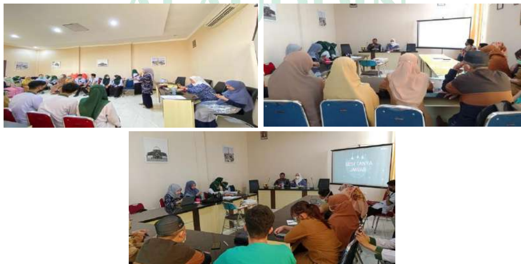
Gambar 2. Proses Workshop