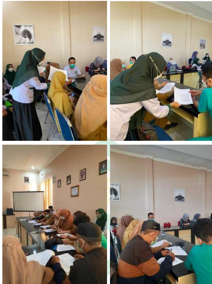
Gambar 1. Pengisian Kuesioner Pre dan Post Test