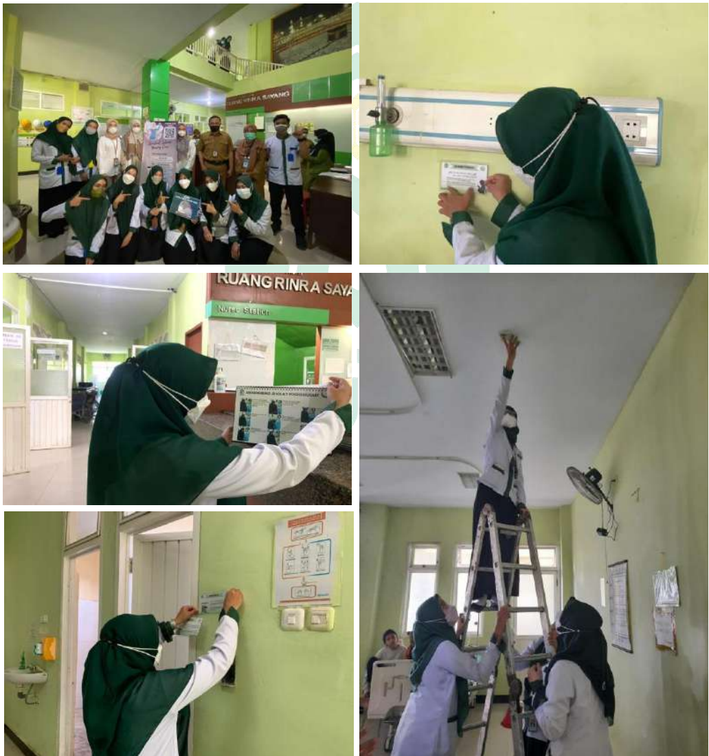
Gambar 4. Penyerahan Modul Asuhan Keperawatan Spiritual dan Pemasangan Poster Tata Cara Ibadah, Doa Masuk/Keluar WC, Doa Kesembuhan serta Pemasangan Arah Kiblat