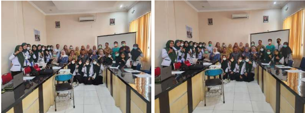
Gambar 3. Sesi Foto Bersama dalam Workshop Manajemen Keperawatan Dalam Ttatanan Pelayanan Rumah Sakit Berbasis Spiritual