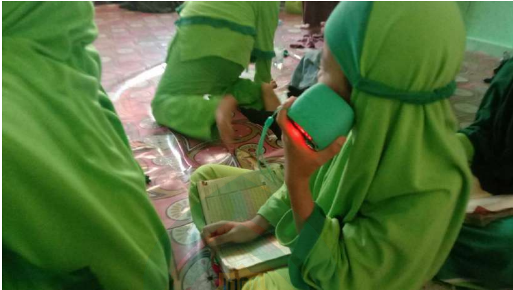
Dokumentasi : Gambaran siswa pada saat menyetor hafalan menggunakan media dalam membantu hafalannya.