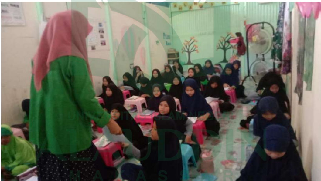
Dokumentasi : Pembagian angket kusioner untuk siswi kelas 5 SD