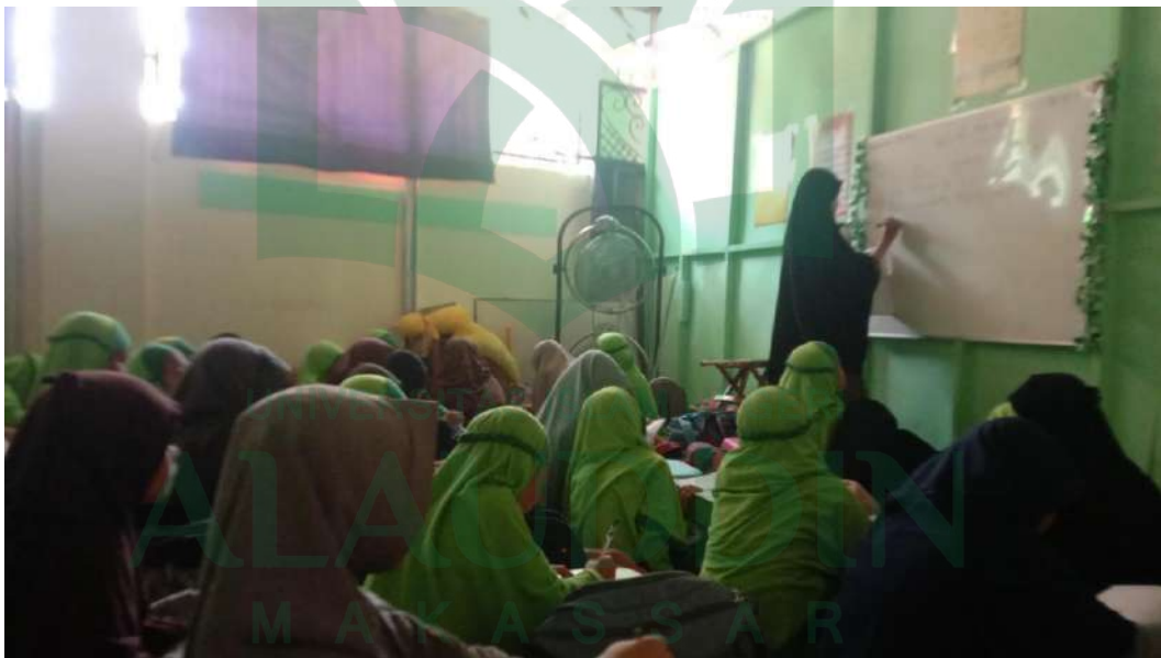
Dokumentasi : Gambaran siswa dan guru sedang melaksanakan proses belajar mengajar