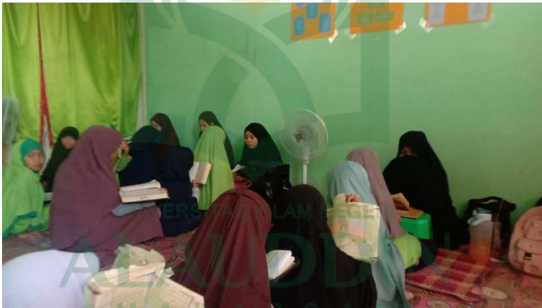
Dokumentasi : Kegiatan siswa yang sedang menyetorkan hafalannya