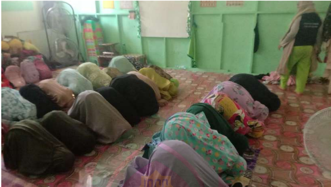
Dokumentasi : Gambaran siswa yang sedang mealakukan sholat dzhur berjamaah di dalam kelas,