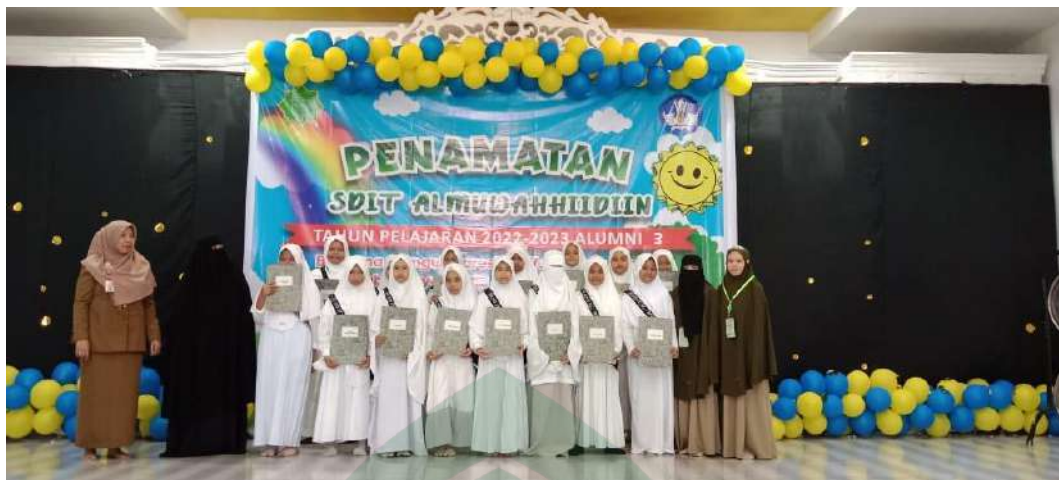
Dokumentasi : Pembagian raport siswa