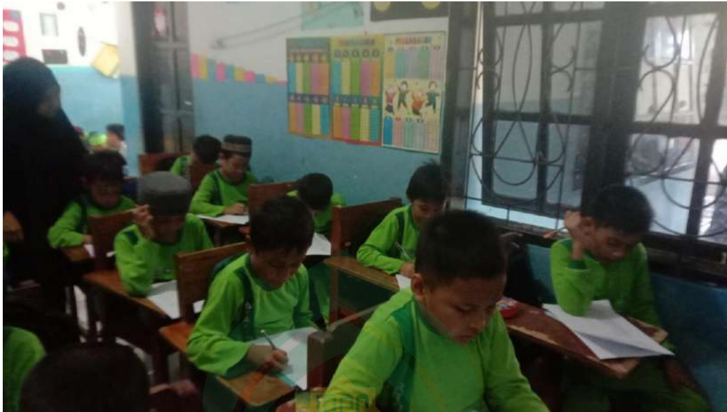
Dokumentasi : Pengisian angket kusioner yang dibagikan untuk siswa kelas 2 SD