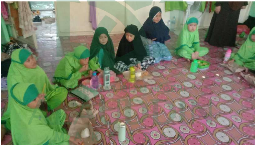
Dokumentasi : Siswa yang sedang makan pada saat jam istirahat