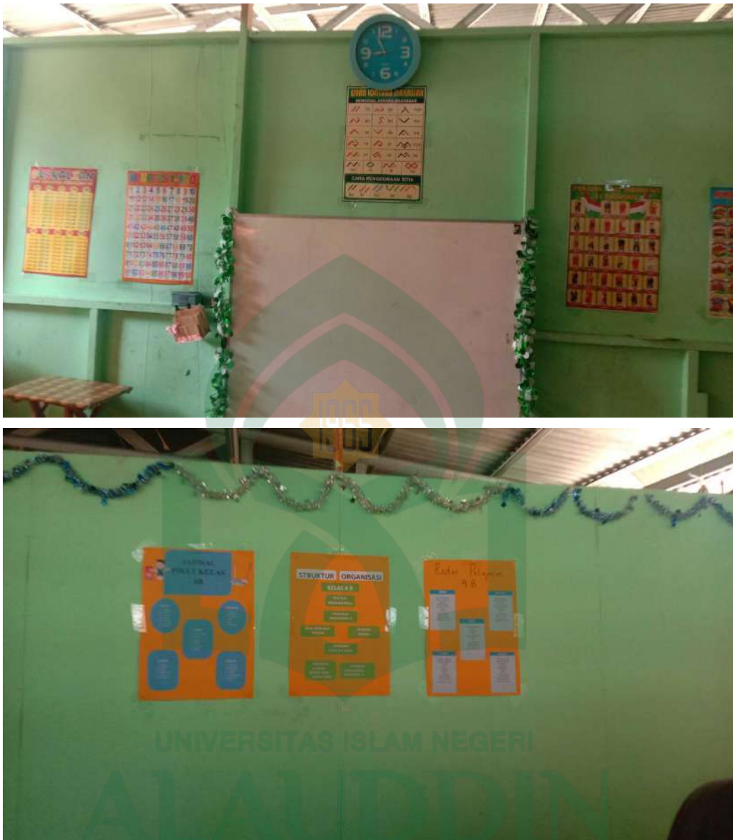
Dokumentasi : Kondisi ruang siswi kelas 3 di sekolah