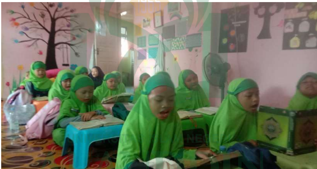
Dokumentasi : Kegiatan siswa pada saat awal pembelajaran yaitu