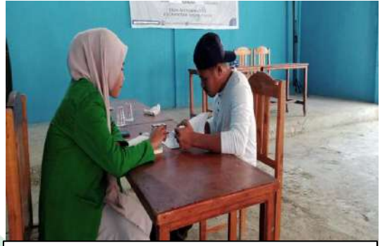
Wawancara dengan bapak seksi pembangunan desa Motonwutun periode 2021-2026