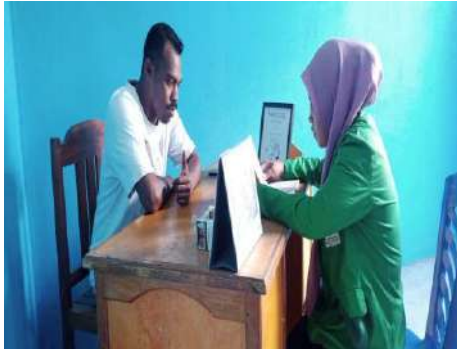
Wawancara dengan Bapak Kepala Desa Motonwutun Periode 2021-2026