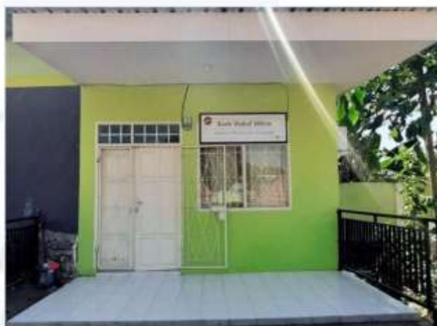
Gambar 4.1 Bank Wakaf Mikro Syariah

Bank Wakaf Mikro Syariah Ummul mu'minin Aisyiyah Makassar berlokasi di Sudiang jalan perintis kemerdekaan KM. 17 Kelurahan pai, Kecamatan Biringkanaya, Makassar Sulawesi Selatan (BWMS Ummul Mu'minin Aisyiyah, 2018).