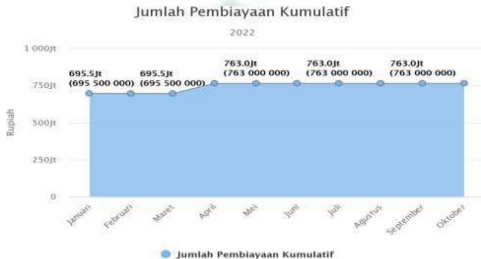
Gambar 4.6 Grafik