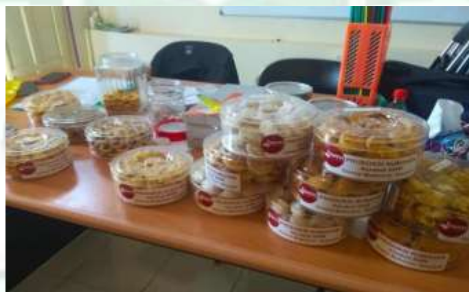
Gambar 4.4 Kue Kering