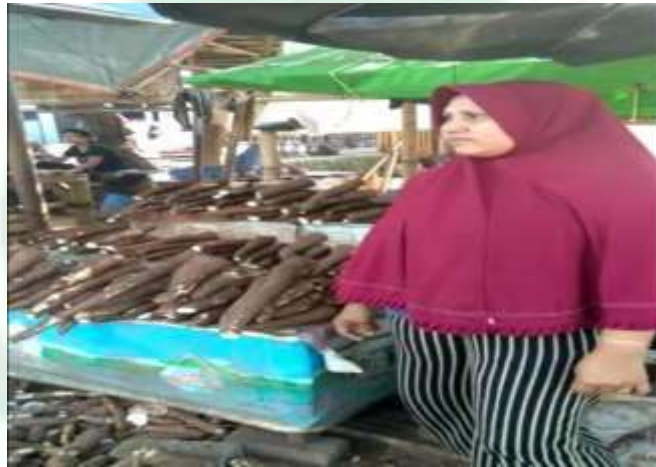
Gambar 4.5 ubi kayu