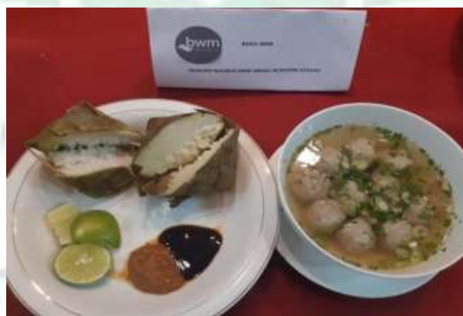
Gambar 4.2 Bakso BMW

Berikut adalah beberapa jenis usaha yang di miliki nasabah dari pembiayaan yang di berikan oleh Bank Wakaf Mikro Syariah Ummul Mu'minin Aisyiyah Makassar senis usaha sendiri merukan Usaha adalah jumlah energi yang digunakan untuk menggerakkan suatu benda. Dilansir dari OpenStax Rice University, dalam fisika usaha adalah penerapam kekuatan gaya untuk memindahkan suatu benda sejauh suatu jarak Contoh usaha adalah saat kita memindahkan benda menggunakan gaya ( Kompas.com 2021).