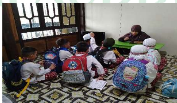
Peserta didik berdoa setelah belajar sebelum kembali ke kelas umum masing-masing