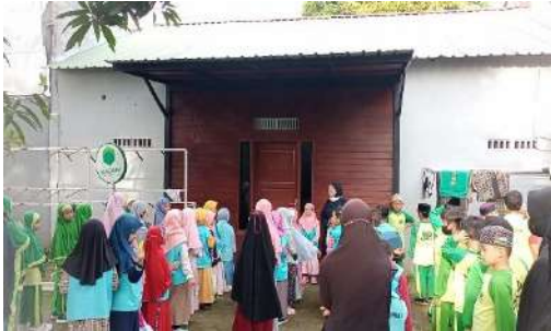
Peserta didik berbaris sebelum masuk kelas