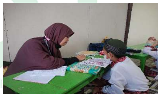
Guru sedang mentalqinkan bacaan untuk peserta didik