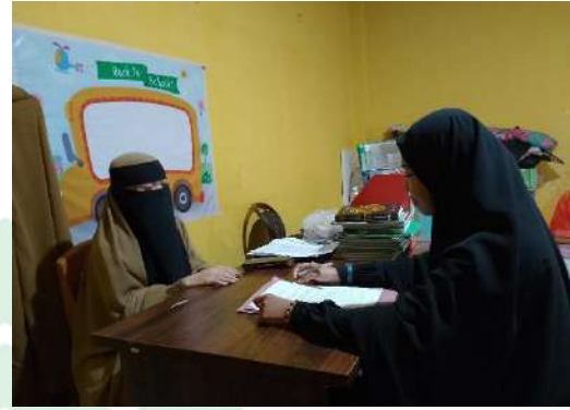
Wawancara dengan Kepala Sekolah dan Koordinator Qur'an