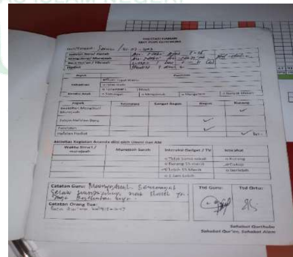
Buku kontrol peserta didik, baik dari hafalan Qur'an, bacaan Wafā dan hadisnya