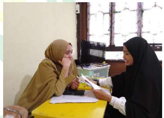
Wawancara dengan Guru Qur'an