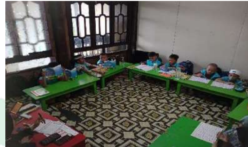
Peserta didik berdoa sebelum belajar