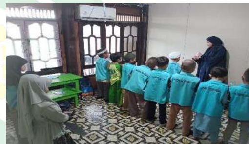
Peserta didik melaksanakan salat duha secara berjamaah