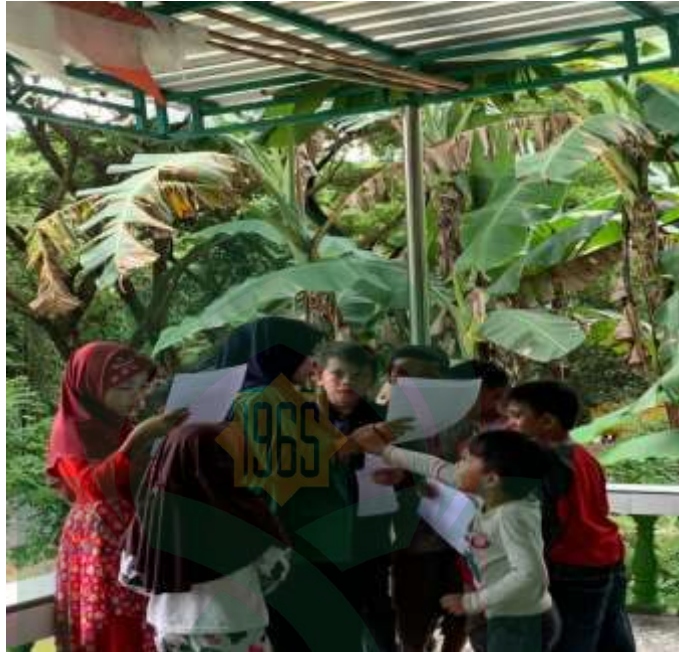
Gambar 1: Memberi penjelasan terkait isi angket