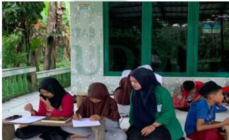
Gambar 2: Pengisian lembar angket