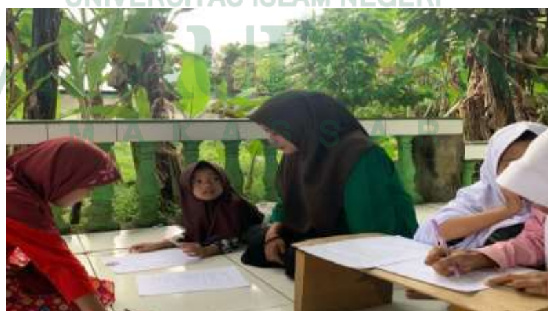
Gambar 5: Pengisian lembar angket