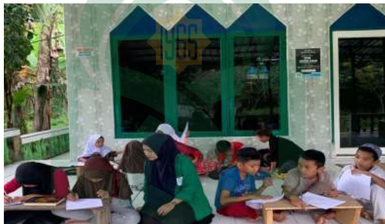
Gambar 4: Pengisian lembar angket