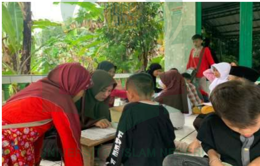
Gambar 7: Proses kegiatan membaca Al-Qur'an