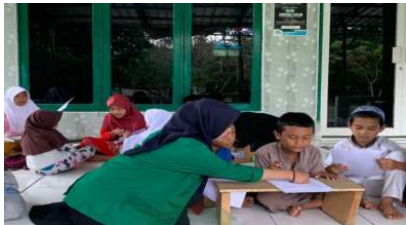
Gambar 3: Memberi penjelasan terkait isi sngket