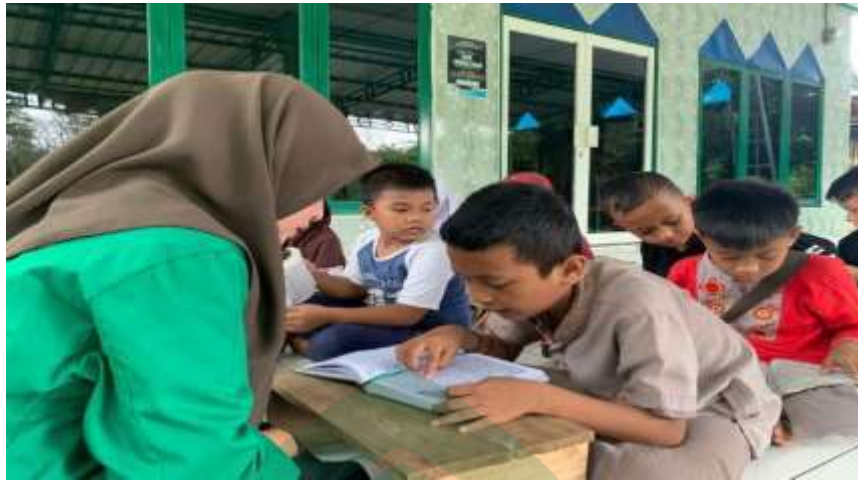
Gambar 6: Proses kegiatan membaca Al-Qur'an