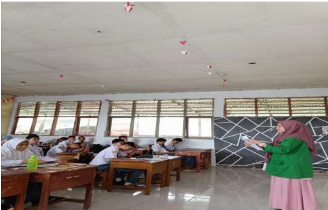
Sedang Menjelaskan Terkait Pengisian Angket