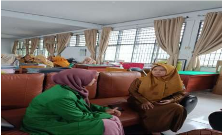
Telah Melakukan Wawancara Bersama Guru Mata Pelajaran Pendidikan Agama Islam dan Budi Pekerti di SMA Negeri 14 Gowa