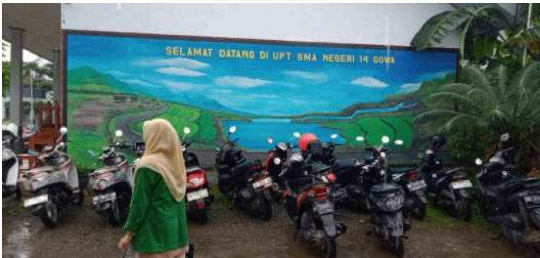
Sedang Melakukan Observasi Awal