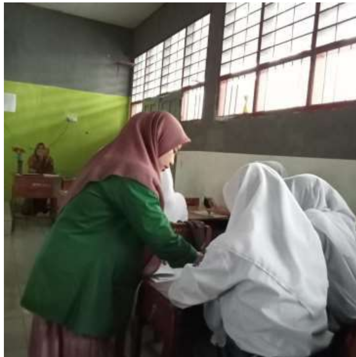
Pembagian Angket Kepada Peserta Didik