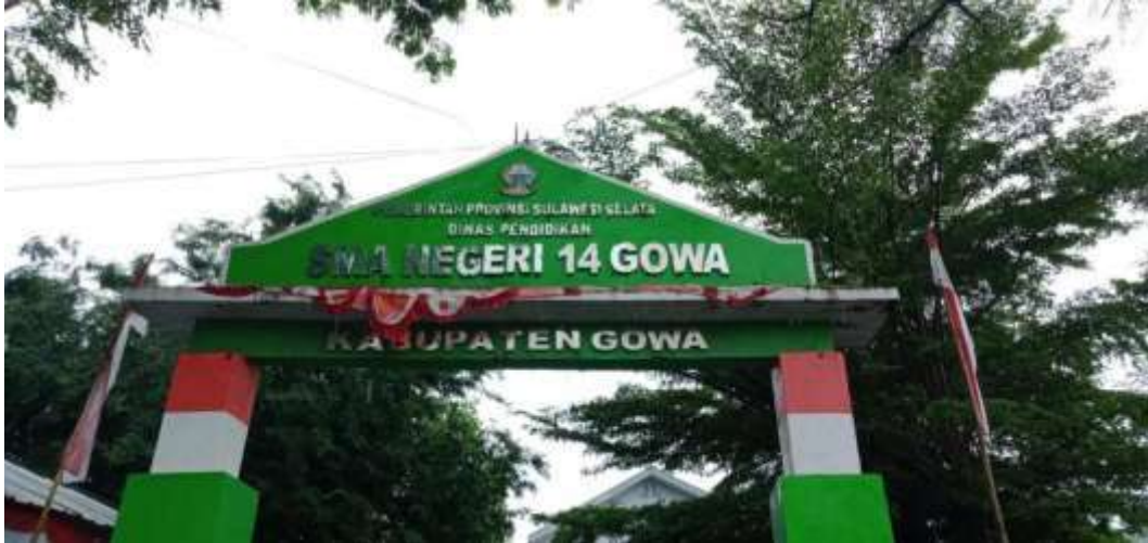
Tampak depan Lokasi Penelitian