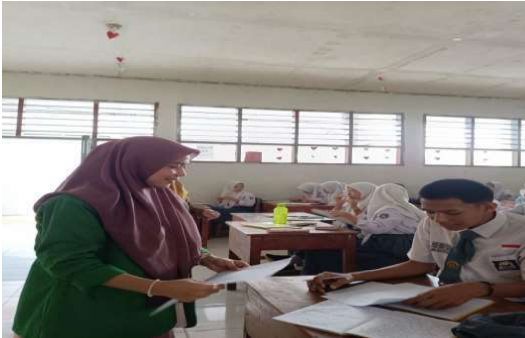
Pembagian Angket Kepada Peserta Didik