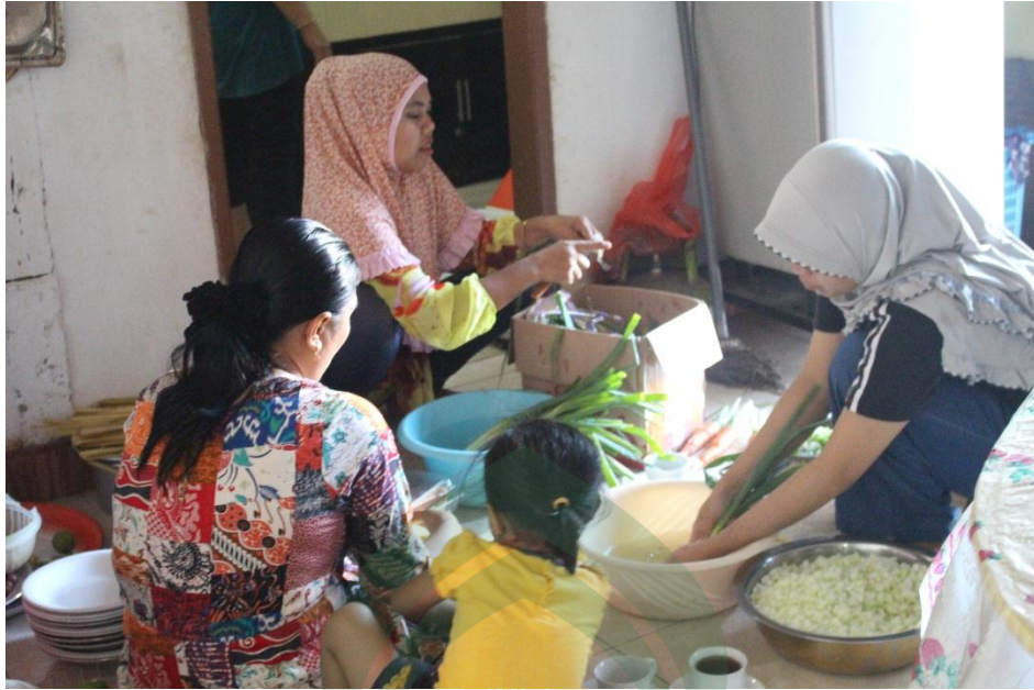
Aktifitas para ibu-ibu yang sedang menyiapkan hidangan untuk para tamu undangan yang datang ke rumah totamma '