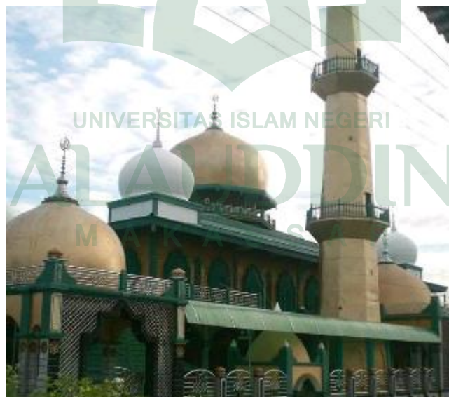
Foto mesjid Nuruttaubah Lapeo yang dibangun oleh K.H Muhammad Thahir (Imam Lapeo)