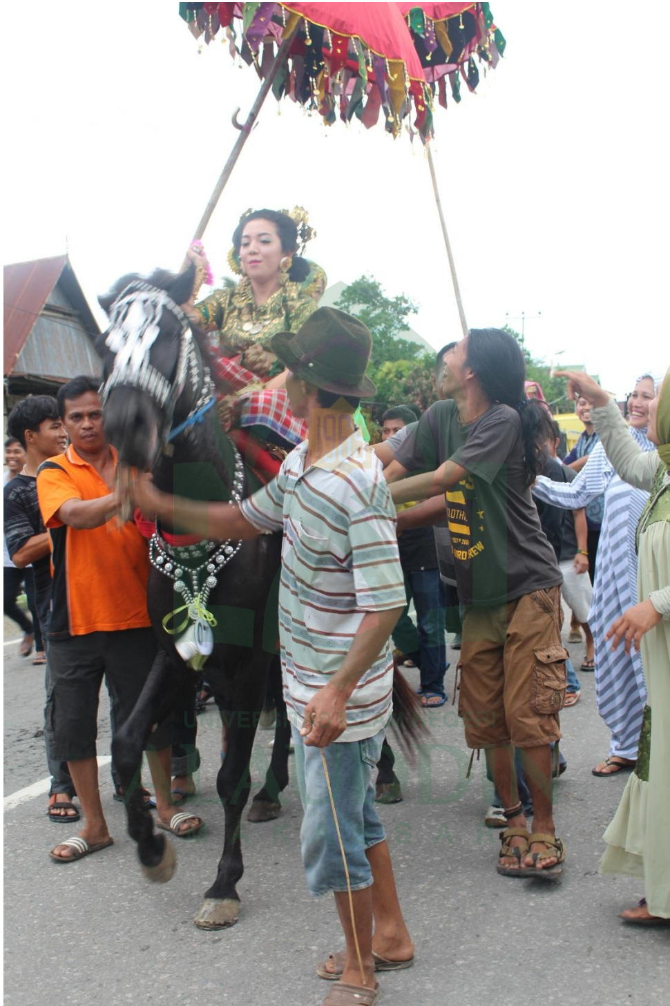
Foto para pesarung sebanyak 4 orang