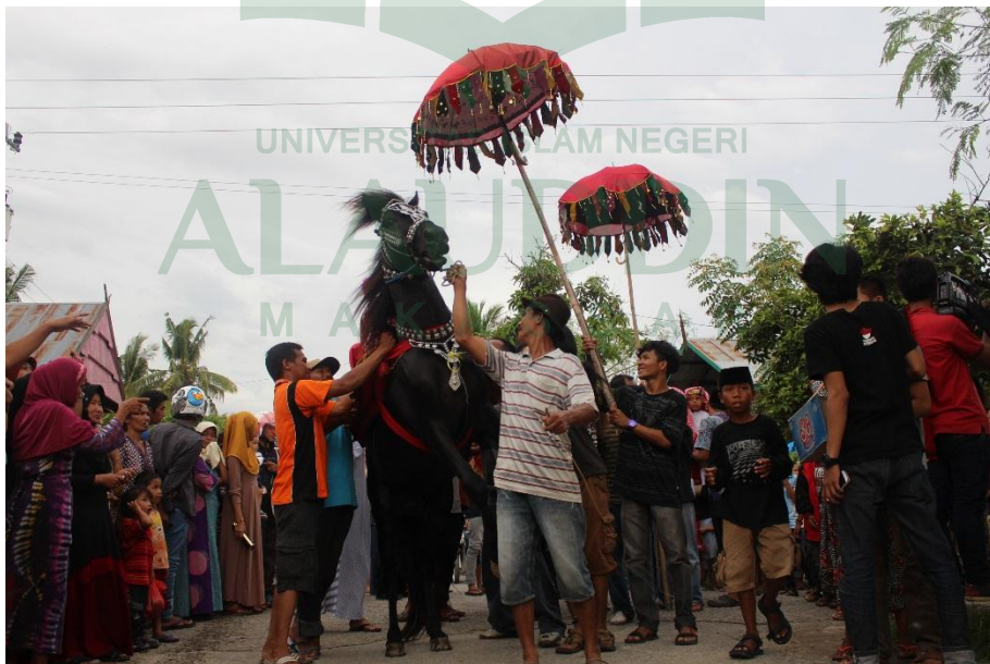
Sayyang pattu'duq yang sedang menari di dampingi oleh pawangnya