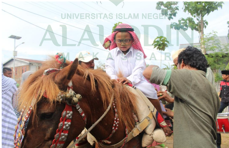
Totamma' pria bersiap-siap berangkat ke mesjid Nuruttaubah Lapeo