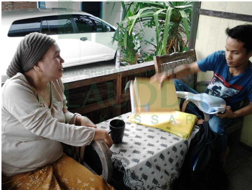
Wawancara dengan tokoh masyarakat