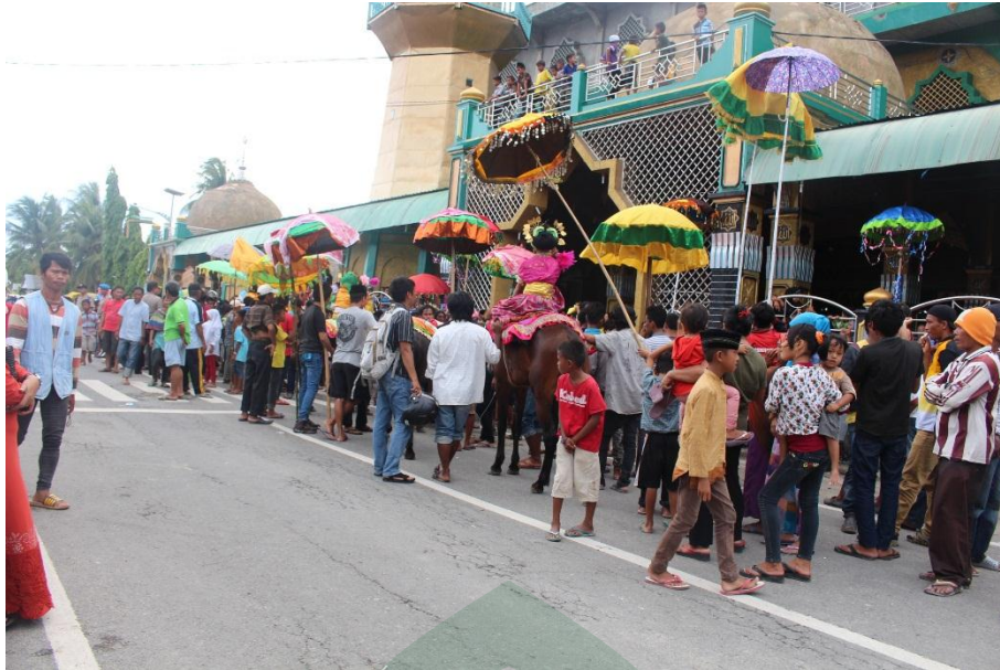
Para totamma ' bersiap-siap diarak-arakkan mengelilingi kampung