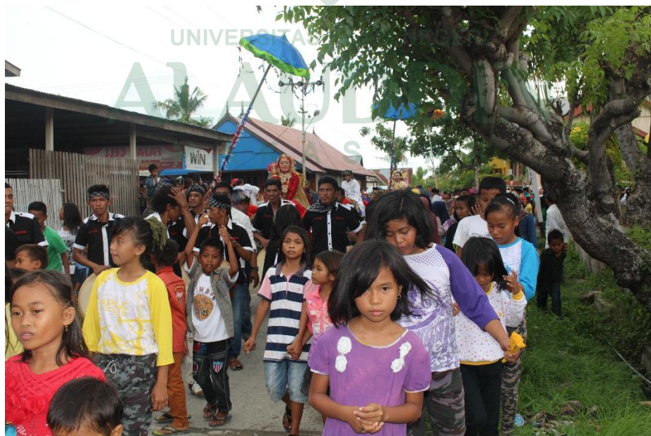
Kegembiraan anak-anak yang mengikuti totamma ' yang sedang keliling kampung