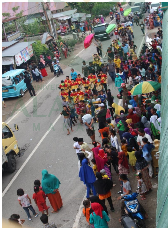
Prosesi pada saat mengelilingi kampung dan disambut gembira oleh warga desa Lapeo