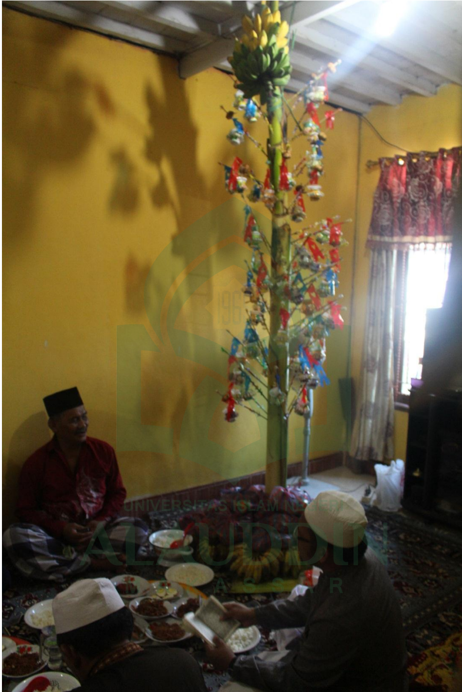
Foto batang pisang yang dihiasi dengan telur dan ketupat ( tiriq ) dan di bawahnya terdapat sejumlah barakka' yang akan di bagikan kepada tamu yang hadir setelah prosesi membaca barazanji