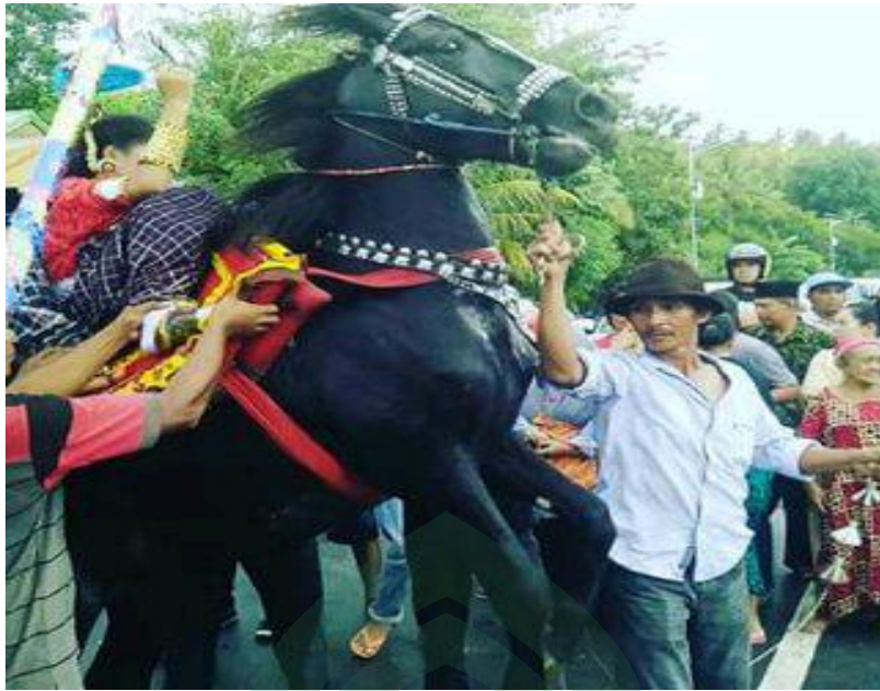
Foto pawang kuda yang sedang menjaga kudanya yang sedang menari