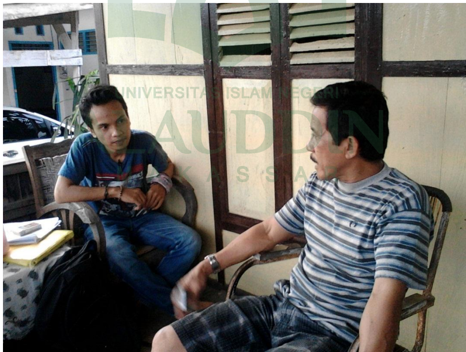
Wawancara dengan tokoh masyarakat