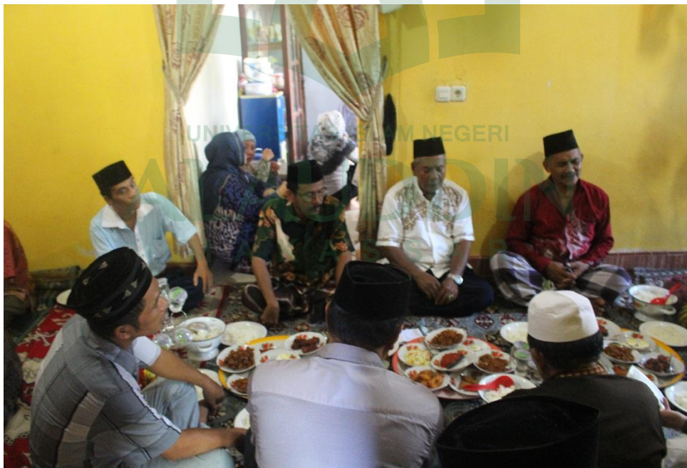
Para tamu duduk sambil menunggu Imam yang akan memimpin jalannya prosesi barasanji ( mambaca )