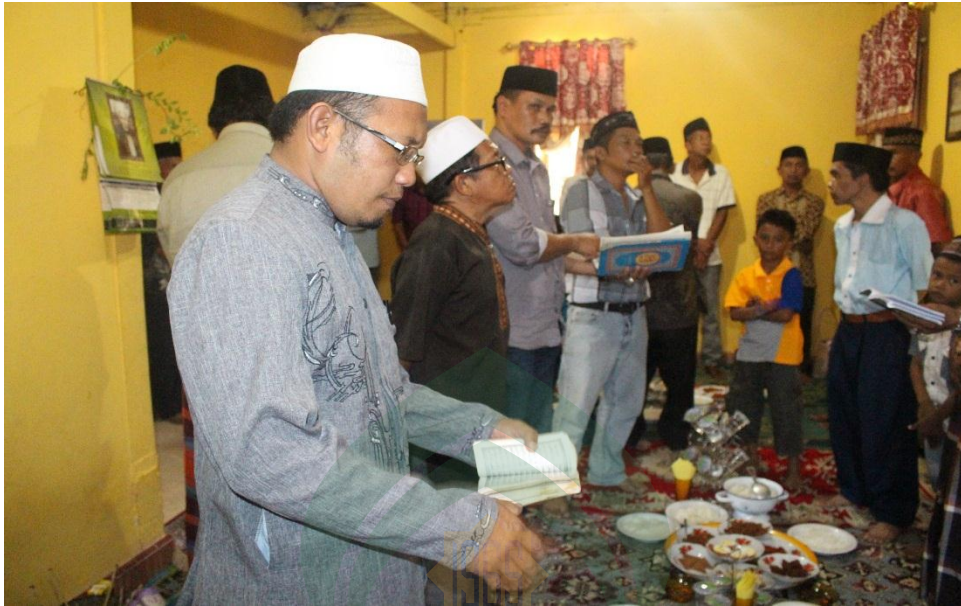
Foto prosesi ma'barazanji