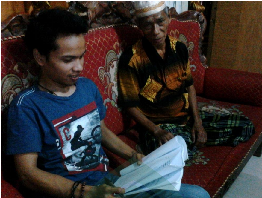
Wawancara dengan salah satu Imam di Desa Lapeo