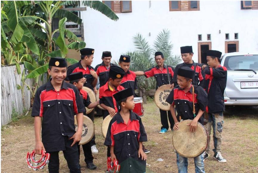
Foto salah satu grup Parrawana