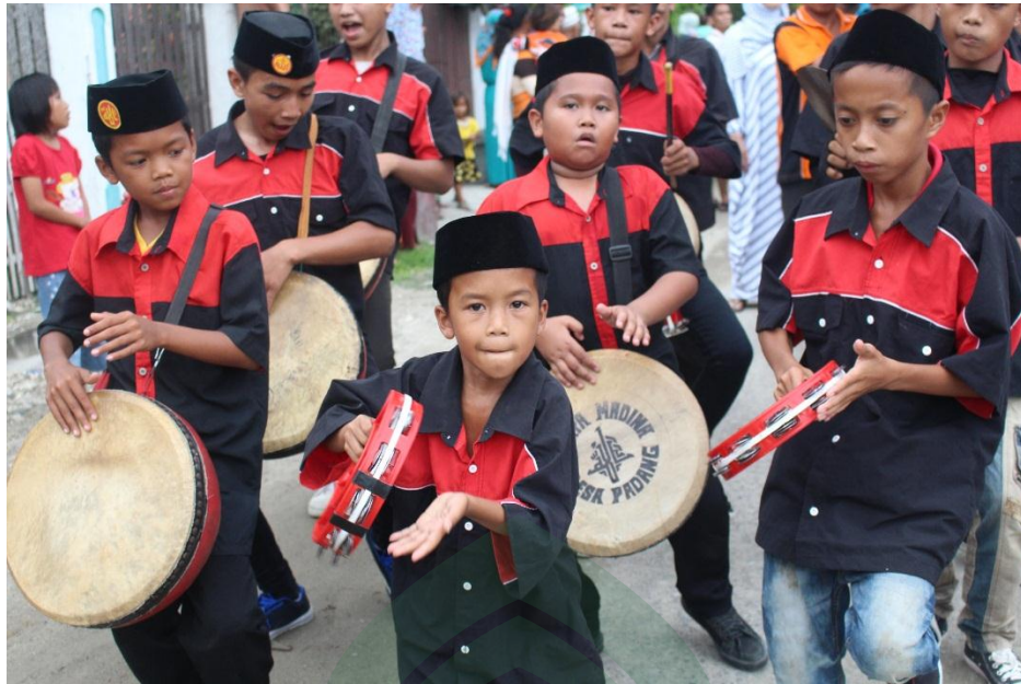
Anak-anak yang sedang memainkan rebana sambil bergoyang mengikuti irama