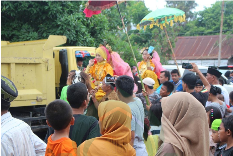
Antusias warga menyambut para Totamma '