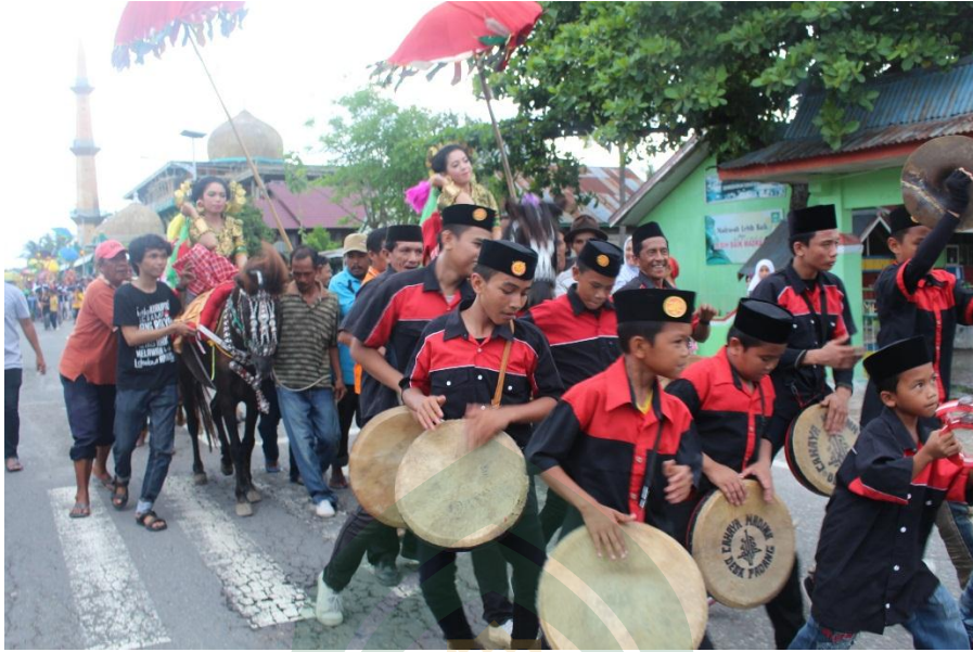
Para grup parrawana ' memainkan rebananya di depan sayyang pattu'duq