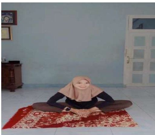
Butterfly Pose (5-10 kali napas)