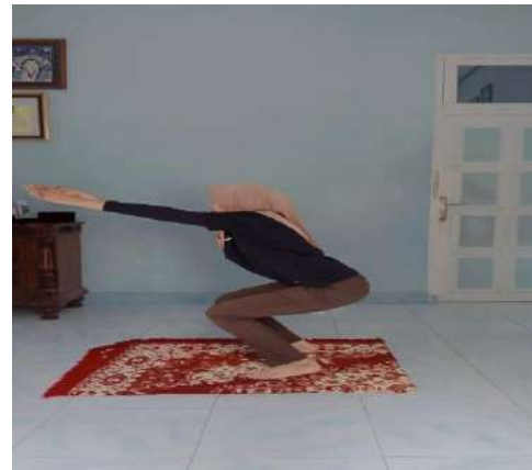
Half Squat (5-10 kali napas)