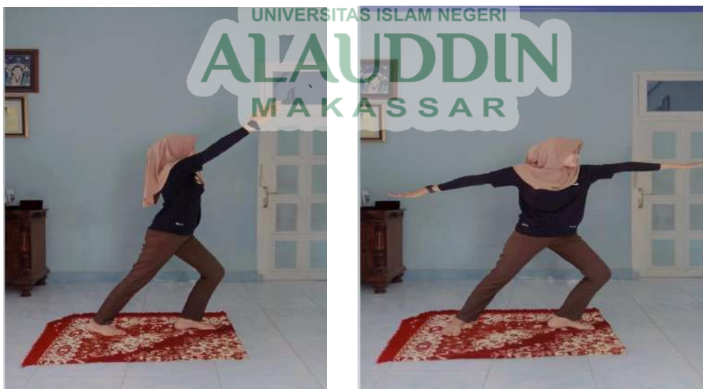
Warior 1 (5 - 10 kali napas)