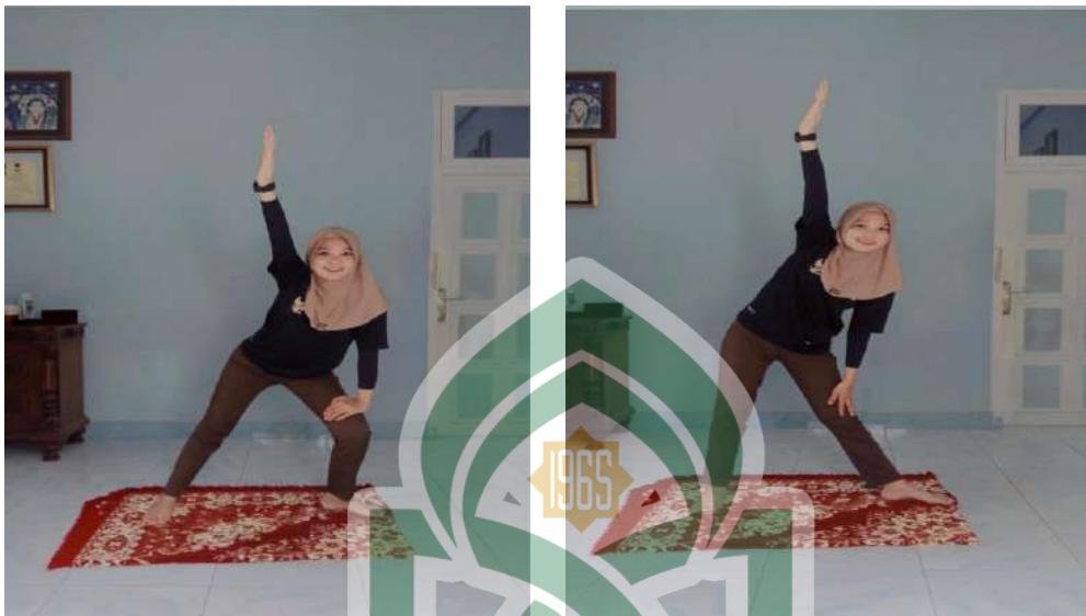
Slide Angle Pose (5-10 kali napas)