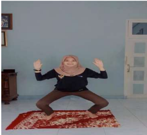
Goddess Pose (5 - 10 kali napas)