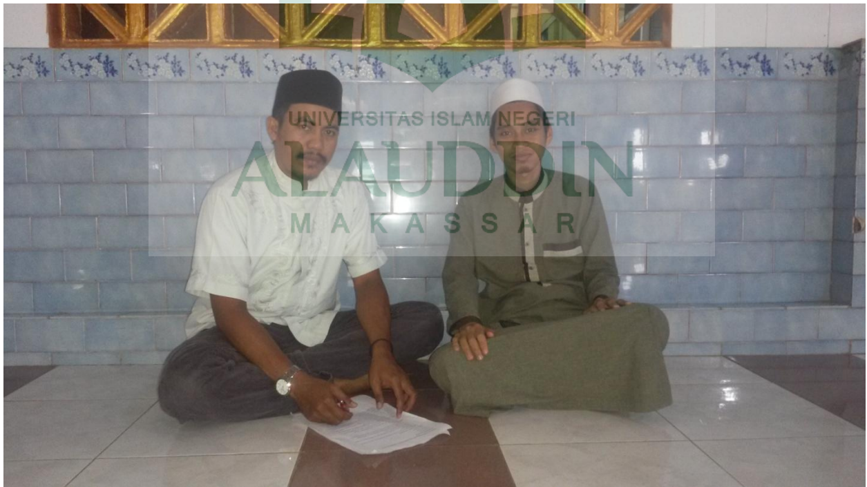
Wawancara dengan Ibnu Katsir