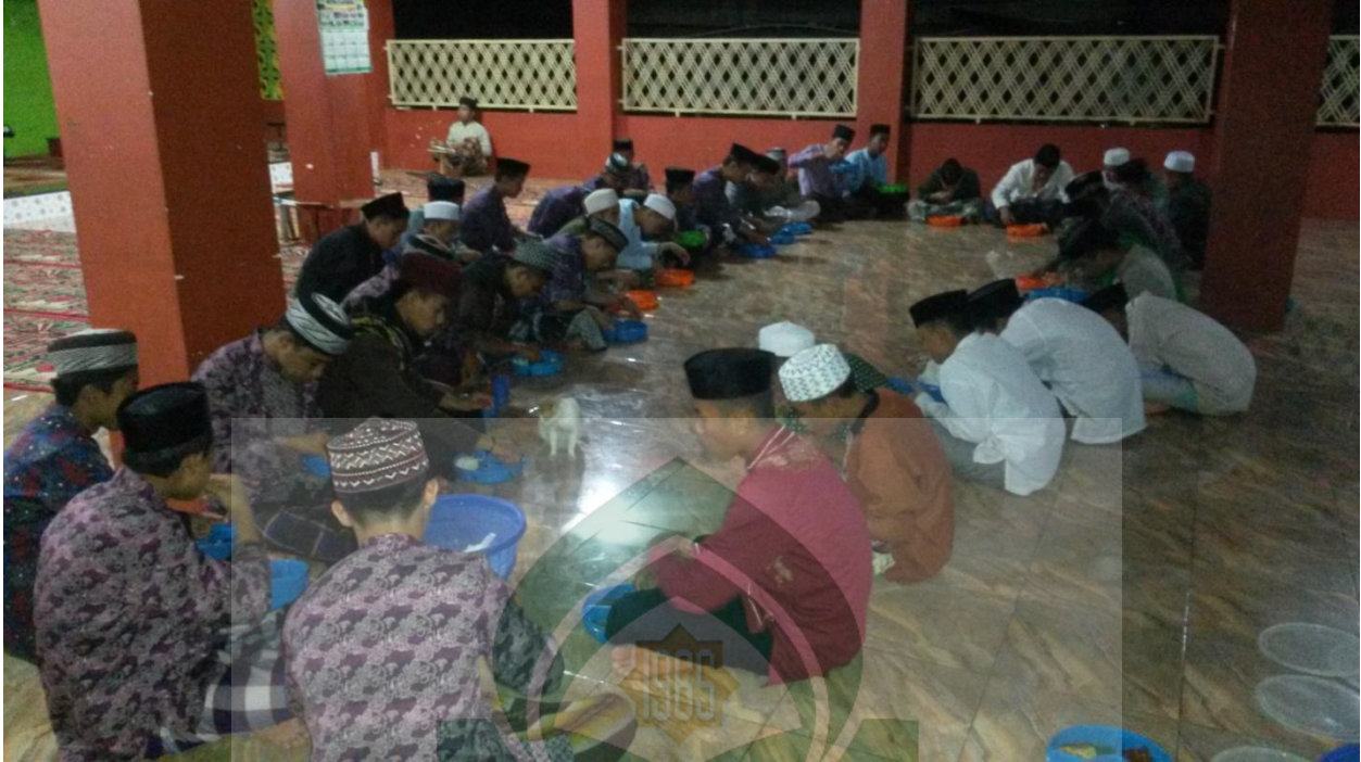
Setelah makan bersama, santri hafiz mencuci piring masing-masing