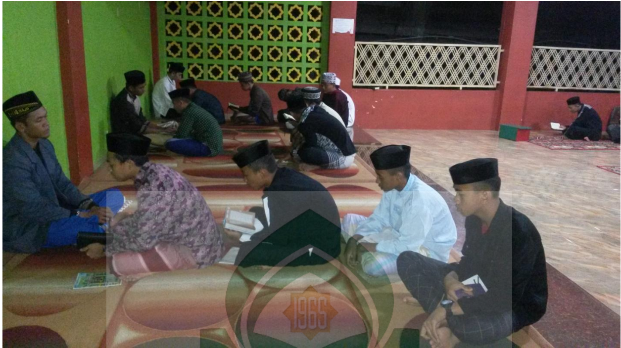
Kesungguhan santri hafiz dalam menghafal al-Qur'an