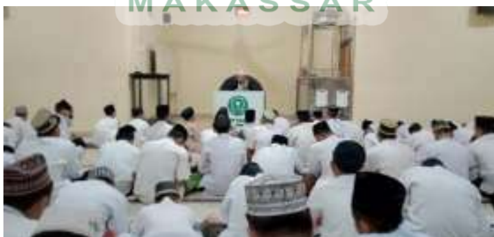
Gambar 21, 22, 23, dan 24: Suasana pengajian di Masjid Pondok Pesantren Perguruan Islam Ganra