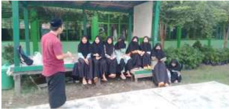
Gambar 13, 14, dan 15: Wawancara dengan santriwati Pondok Pesantren Perguruan Islam Ganra