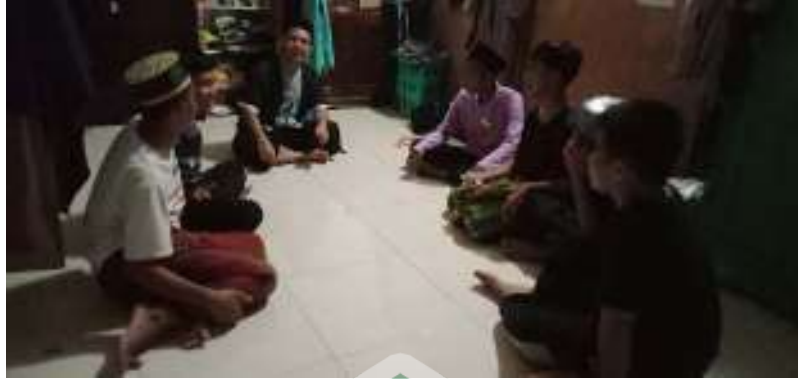
Gambar 16, 17, 18, dan 19: Wawancara santri Pondok Pesantren Perguruan Islam Ganra