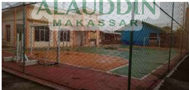
Gambar 20: Gedung Workshop Otomotif BLK dalam lapangan Futsal Pondok Pesantren Perguruan Islam Ganra