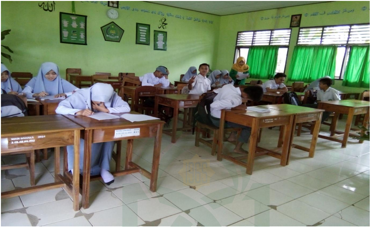
FOTO DOKUMENTASI SAAT PEMBAGIAN ANGKET PADA KELAS XI IIS DI MAN BARAKA KEC. BARAKA KAB. ENREKANG