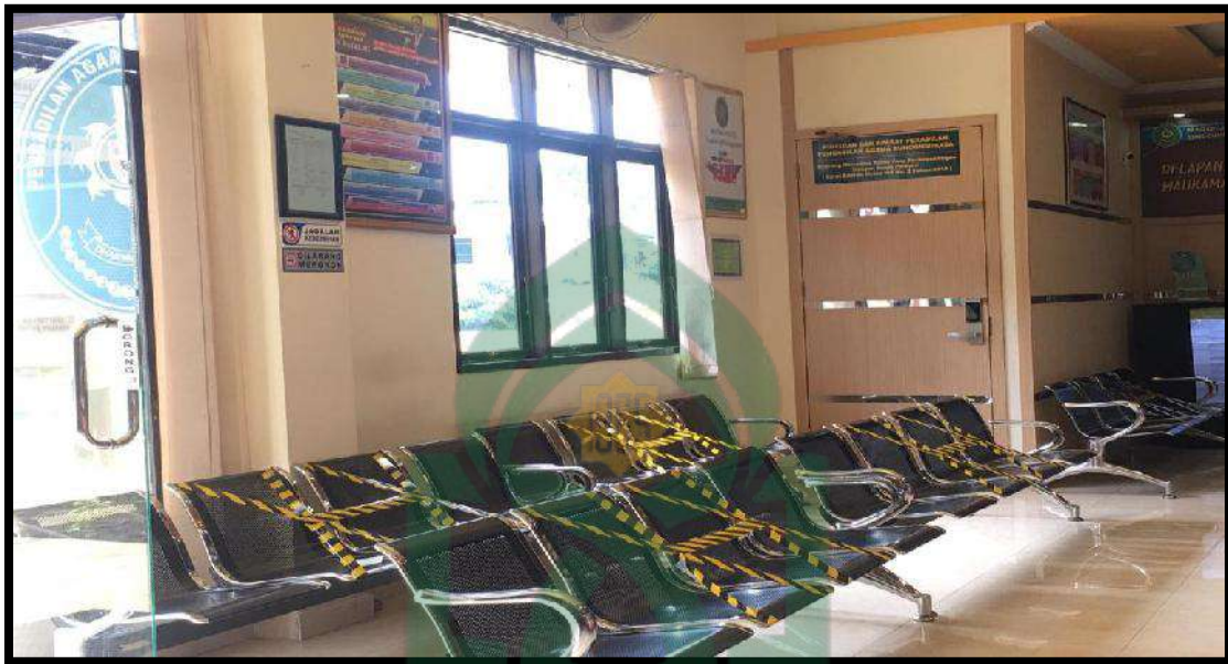
Kursi di ruang tunggu persidangan