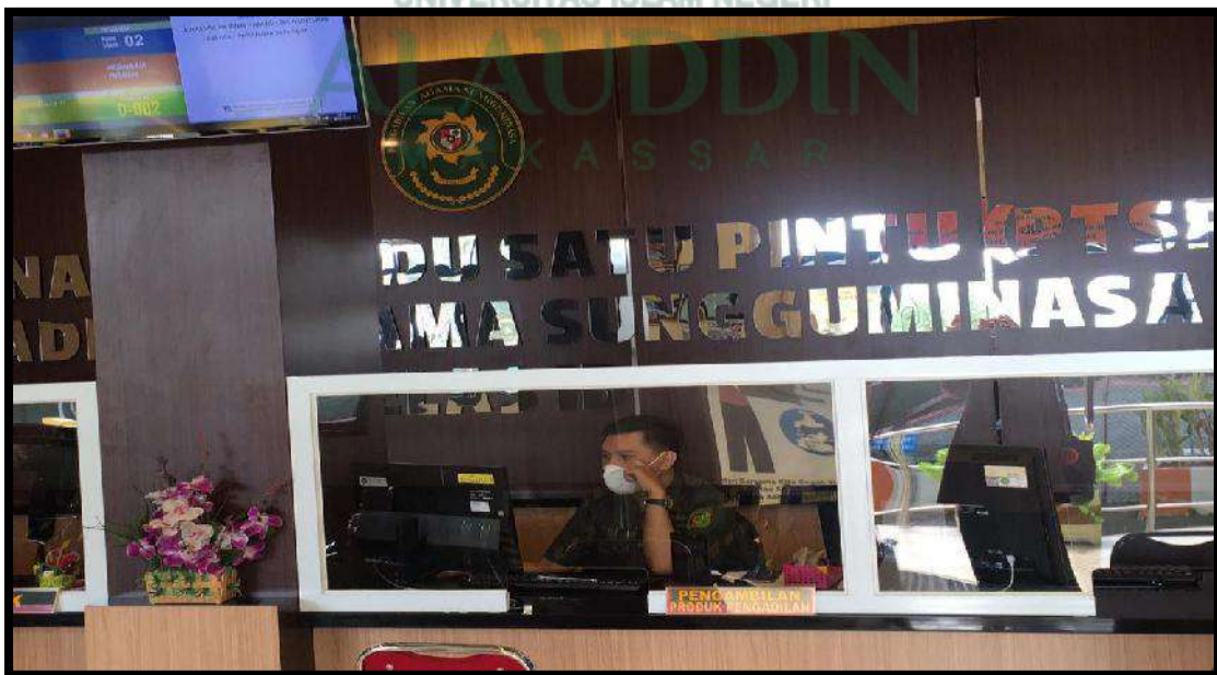
Pelayanan Terpadu Satu Pintu (PTSP) Pengadilan Agama Sungguminasa Kelas IB