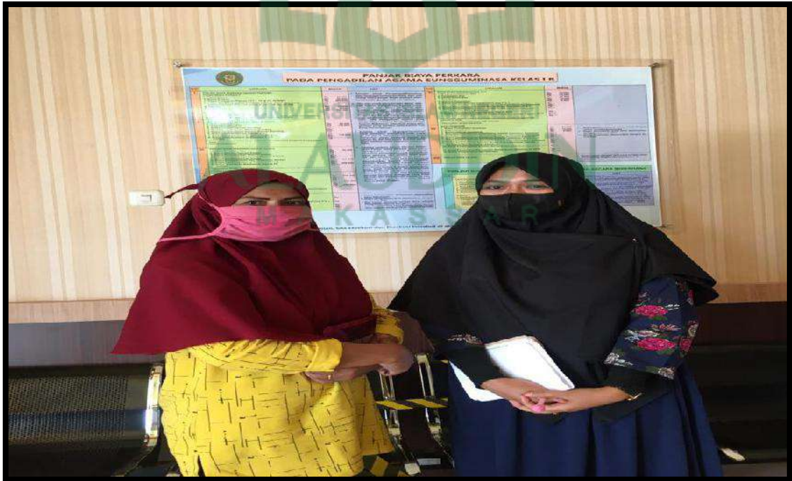
Dokumentasi Wawancara Masyarakat Pencari Keadilan di Pengadilan Agama Sungguminasa Kelas I B

SARANA DAN PRASARANA DI PENGADILAN AGAMA SUNGGUMINASA KELAS I B DI MASA PANDEMI COVID-19.