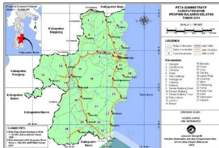
Gambar 4.1 Peta administratif Kabupaten Bone

Kabupaten Bone dapat dikelompokkan ke dalam enam kategori berdasarkan ketinggian tempatnya, dengan variasi ketinggian mulai dari 0 hingga lebih dari 1.000 MDPL. Kategori pertama, dengan ketinggian 0-25 meter, memiliki luas sekitar 81.925,2 Ha. Kategori kedua, dengan ketinggian 25-100 meter, memiliki luas sekitar 101.620 Ha. Selanjutnya, kategori ketiga, dengan ketinggian 100-250 meter, mencakup luas sekitar 202.237,2 Ha. Kategori keempat, dengan ketinggian 250-750 meter, memiliki luas sekitar 62.640,6 Ha. Kategori kelima, dengan ketinggian 750-1000 meter, mencakup luas sekitar 40.080 Ha. Terakhir, kategori keenam, dengan ketinggian 1.000 meter ke atas, memiliki luas sekitar 6.900 Ha. 2