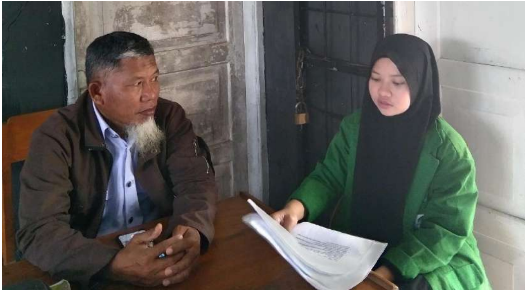
Wawancara dengan Guru Pendidikan Agama Islam dan Budi Pekerti