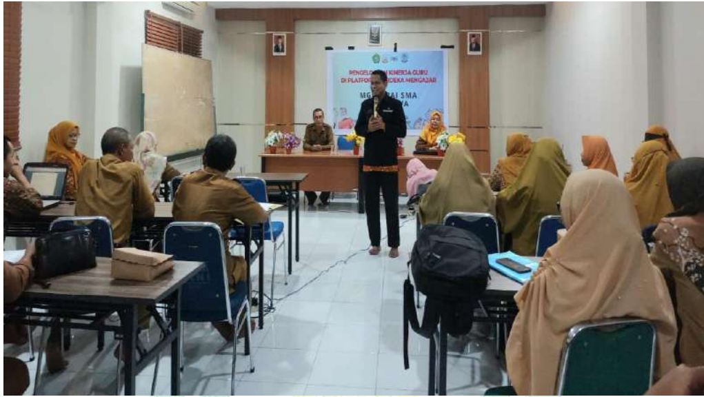
Kegiatan MGMP PAI