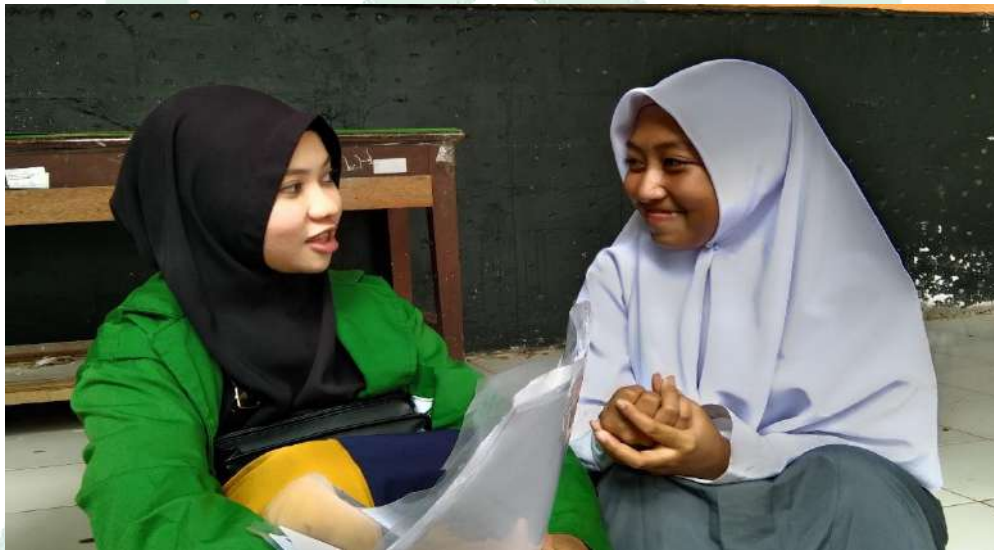
Wawancara dengan Peserta Didik Kelas X