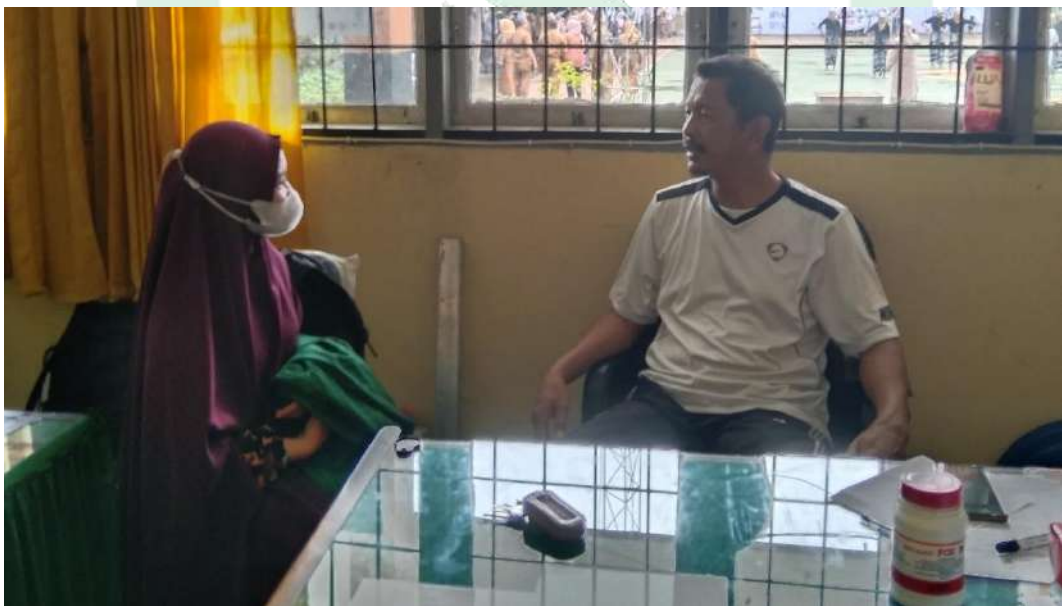
Wawancara dengan Wakil Kepala Sekolah Bidang Sarana dan Prasarana