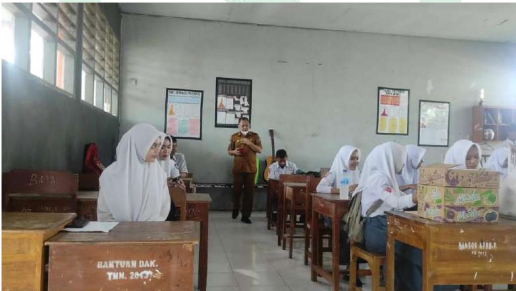
Kegiatan Supervisi Kepala Sekolah dan SIDAK