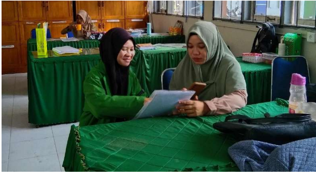
Wawancara dengan Guru Pendidikan Agama Islam dan Budi Pekerti