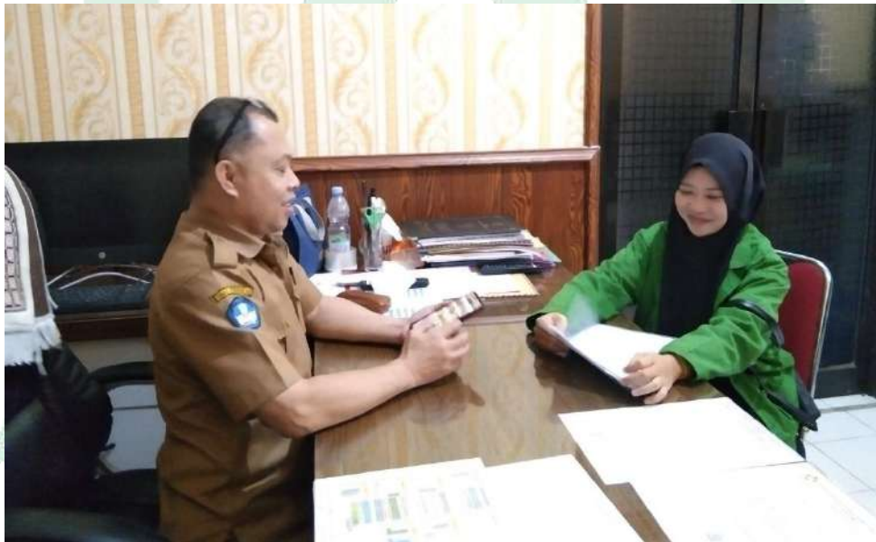
Wawancara dengan Kepala Sekolah SMAN 8 Gowa