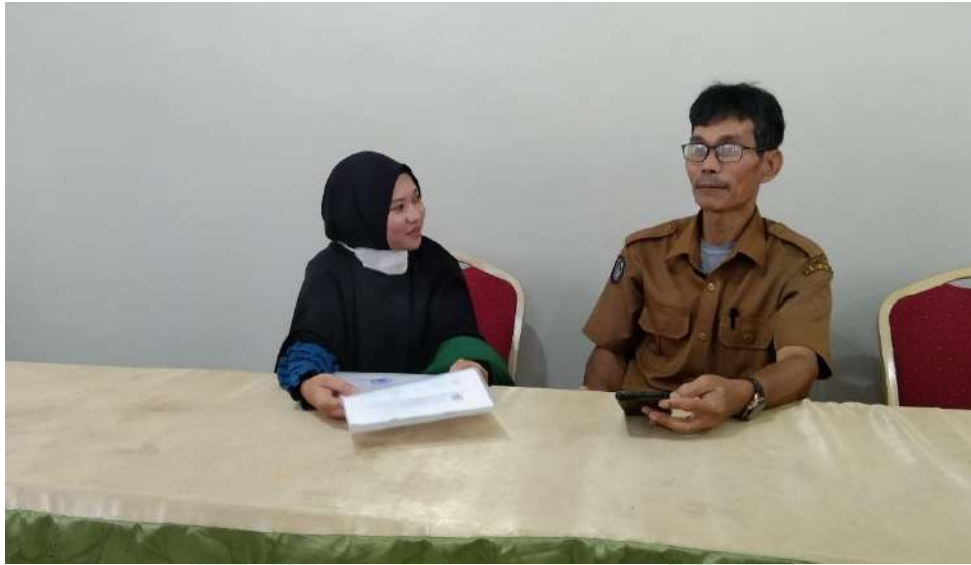
Wawancara dengan Wakil Kepala Sekolah Bidang Kesiswaan