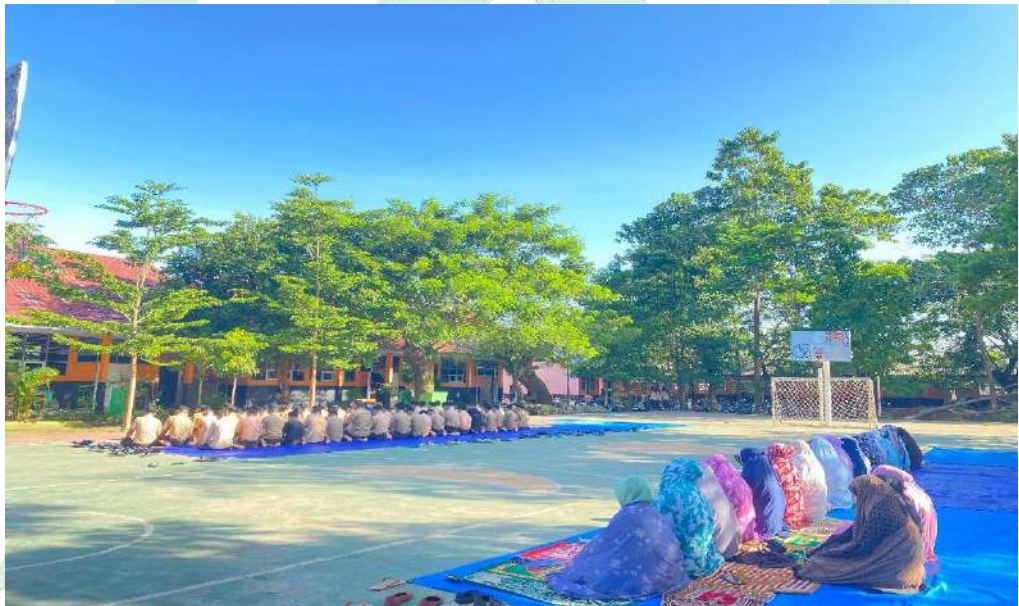
Kegiatan Jum'at Ibadah