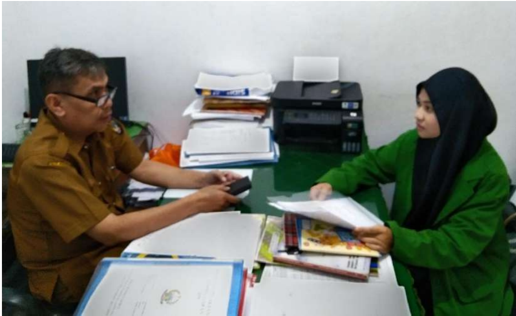
Wawancara dengan Wakil Kepala Sekolah Bidang Kurikulum