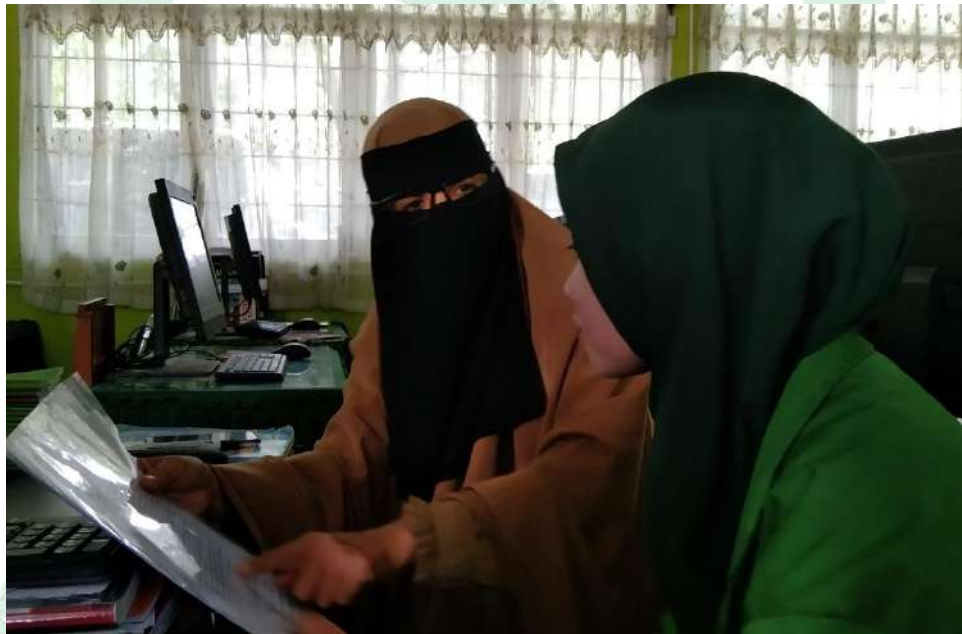
Wawancara dengan Guru Pendidikan Agama Islam dan Budi Pekerti