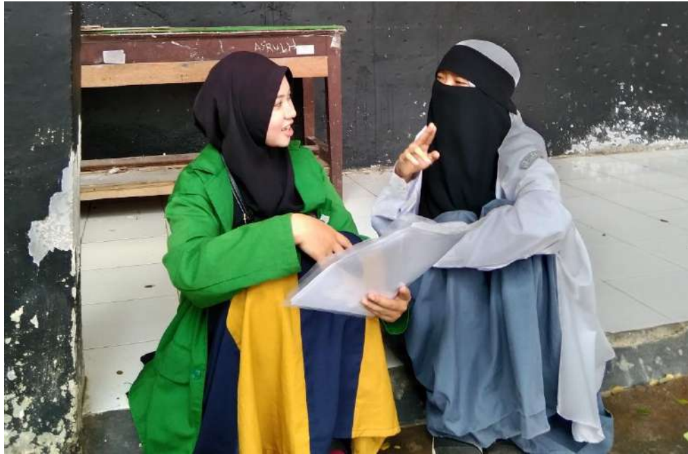
Wawancara dengan Peserta Didik Kelas XI