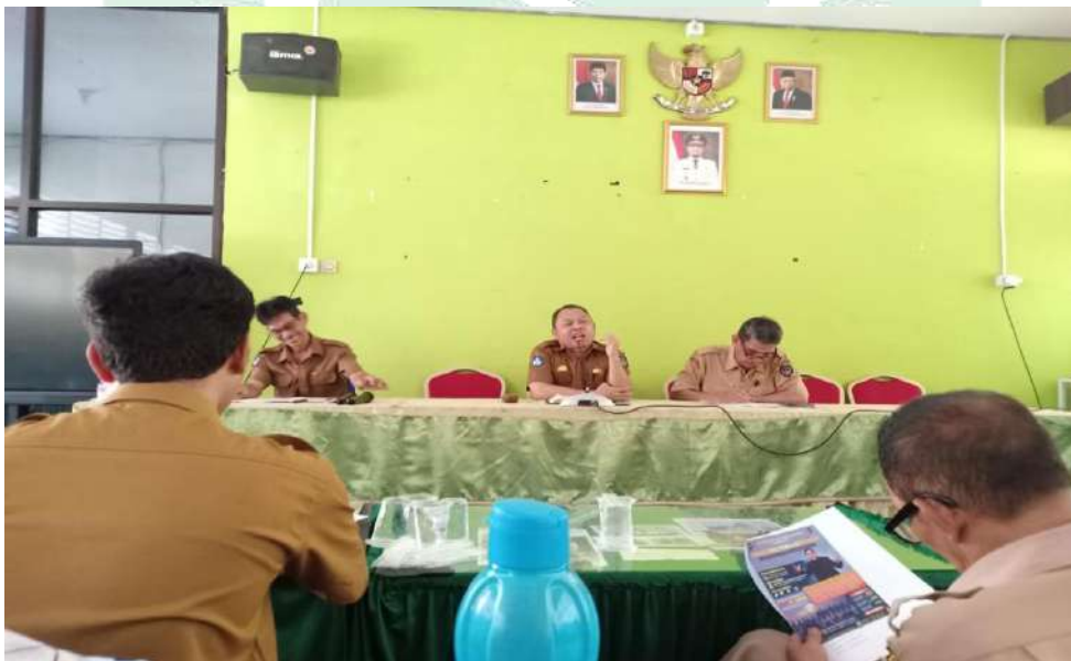
Kegiatan Rapat Guru dan Kepala Sekolah