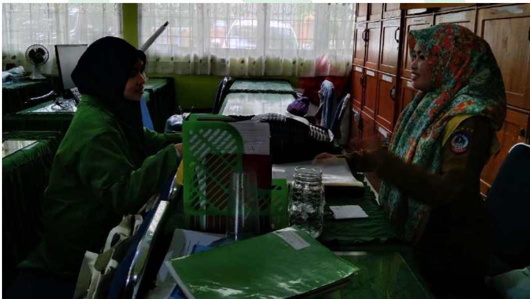
Wawancara dengan Guru Pendidikan Agama Islam dan Budi Pekerti