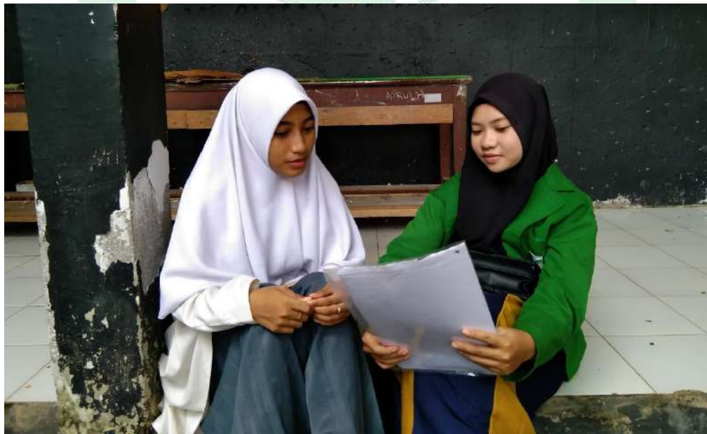
Wawancara dengan Peserta Didik Kelas XII