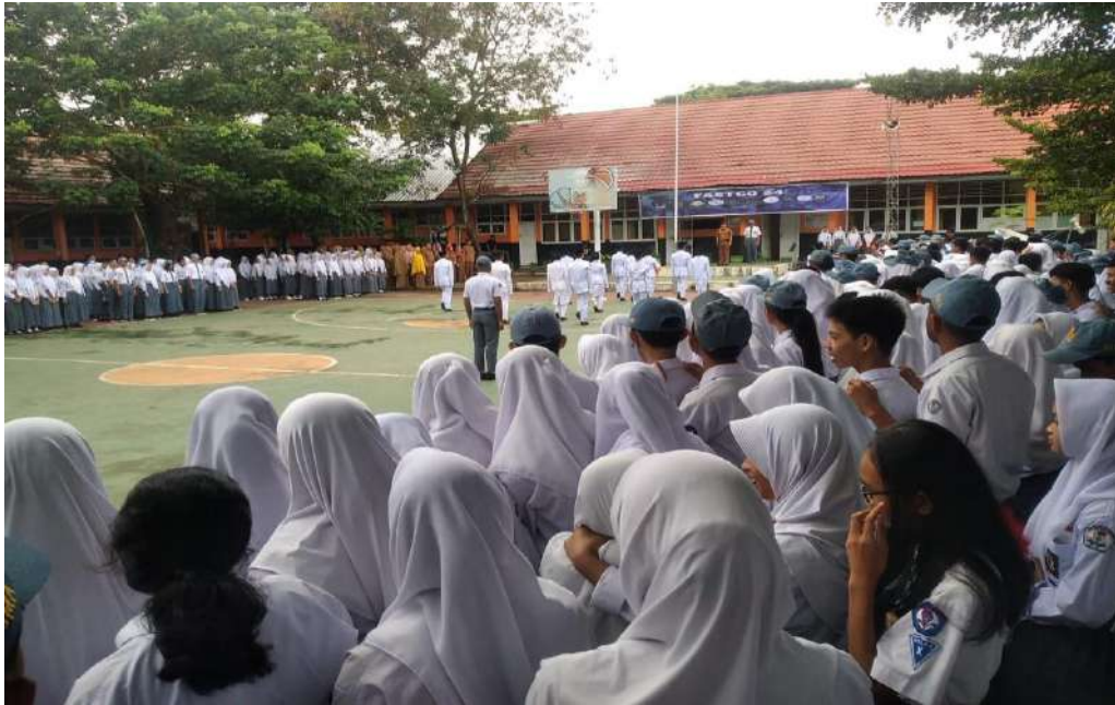
Kegiatan Upacara Penaikan Bendera yang dibina Oleh Kepala Sekolah