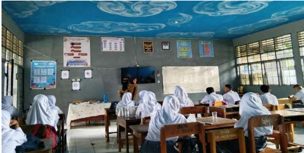
Kegiatan Proses Pembelajaran PAI