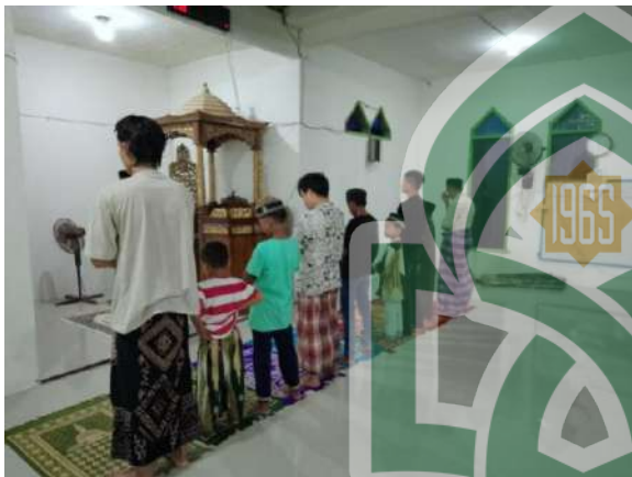
14. Salat Magrib di dusun tiga Bulu-Bulu Desa Rumpa