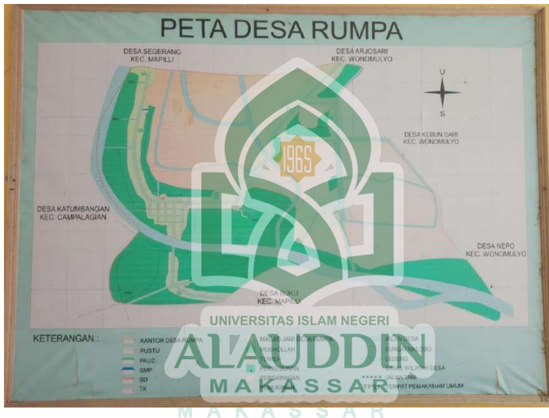
Gambar 1: Peta Desa Rumpa 2023

Kepala Desa berada di wilayah Dusun II sekaligus sebagai pusat Pemerintahan yang mempunyai wilayah \pm 812,57 Ha yang terdiri dari area persaw.ahan seluas \pm 301,77 Ha, area perkebunan seluas 419,60 Ha, area pemukiman 49,71 Ha. Dan tubuh air seluas 41,50 Ha.