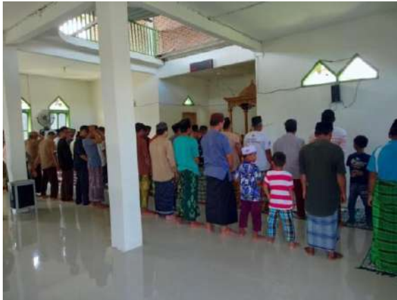
13. Salat Jumat di dusun tiga Bulu-Bulu Desa Rumpa