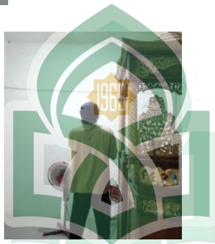
17. Remaja Masjid Azan Magrib di dusun tiga Bulu- Bulu Desa Rumpa