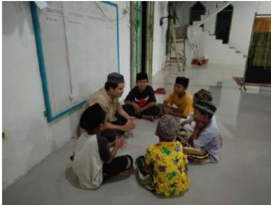
19. Pembinaan keagamaan anak sejak dini dalam hal pemahaman dasar keagamaan