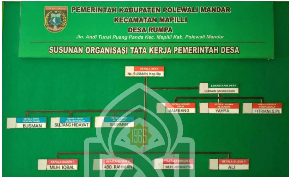
Gambar 2 : Struktur Pemerintahan Desa Rumpa2023