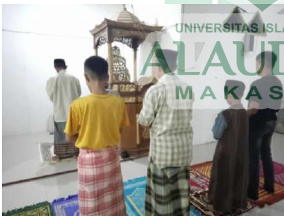
15. Salat Isya di dusun tiga Bulu-Bulu Desa Rumpa

UNIVERSITAS ISLAM NEGERI ALAUDDIN MAKASSAR