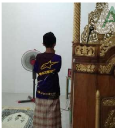
18. Remaja Masjid Azan Isya di dusun tiga Bulu-Bulu Desa Rumpa