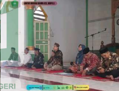
12. Kegiatan Majelis Taklim