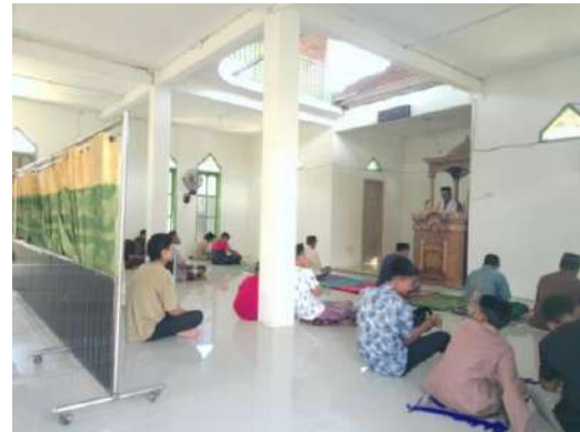
9. Pembacaan Khutbah salat jumat di Desa Rumpa