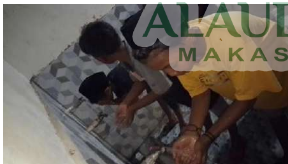
21. Pembinaan keagamaan anak sejak dini dalam hal cara berwudhu yang baik dan benar