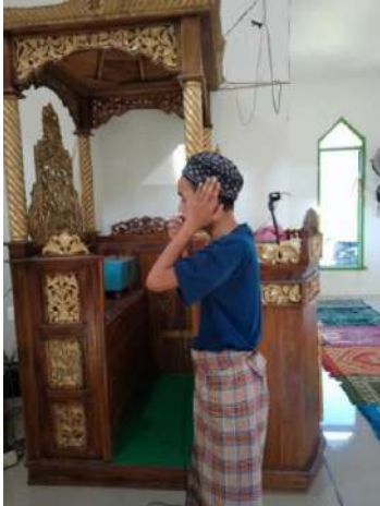
16. Remaja Masjid Azan Zuhur di dusun tiga Bulu-Bulu Desa Rumpa