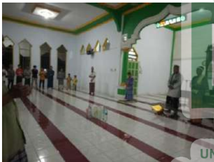
10. Kegiatan Majelis Ziqir di Masjid dusun 2