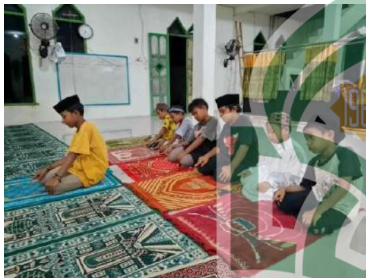
20. Pembinaan keagamaan anak sejak dini dalam hal tata cara salat