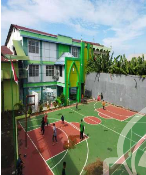
Pondok Pesantren Al Haris