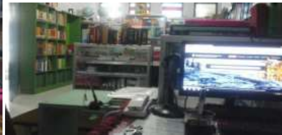
Koleksi Buku dan Layanan OPAC