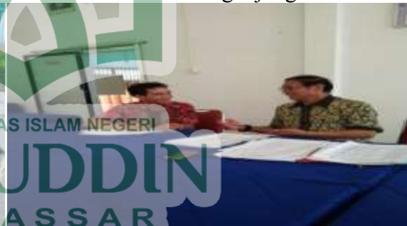
Wawancara Guru Bidang Studi Keperawatan