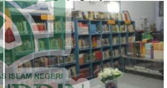
Koleksi Buku Perpustakaan