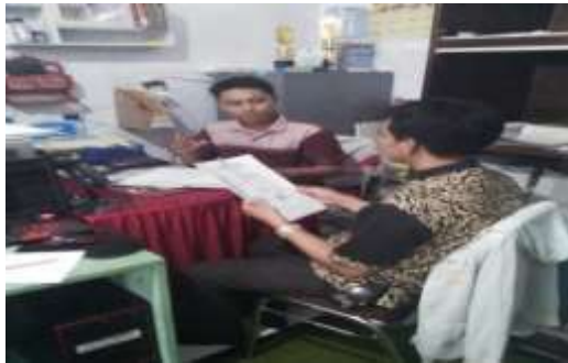
Wawancara Kepala Perpustakaan