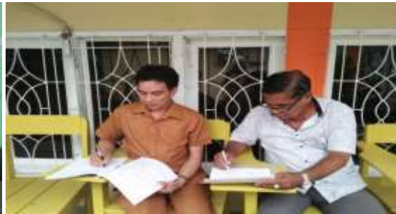
Wawancara Kepala Sekolah