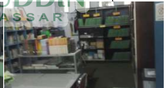
Koleksi Buku dan Karya Tulis Ilmiah