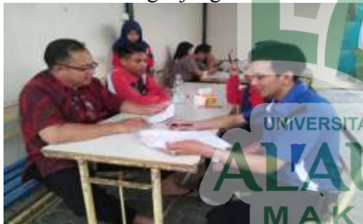
Wawancara Guru Bidang Studi Bahasa Indonesia