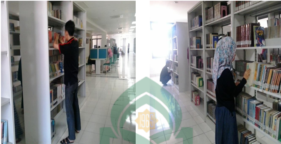
Suasana kerja di lantai 3 koleksi umum dan dilantai 2 koleksi Islam Kamis, 03 September 2015