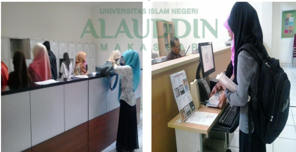
Suasana kerja di bagian penitipan barang dan bagian peminjaman mandiri Selasa, 01 September 2015