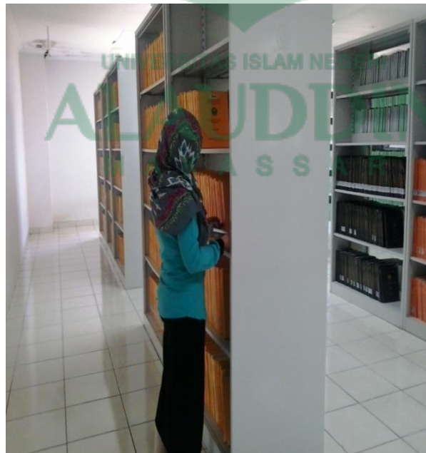
Suasana kerja di lantai empat koleksi karya ilmiah Kamis, 03 September 2015