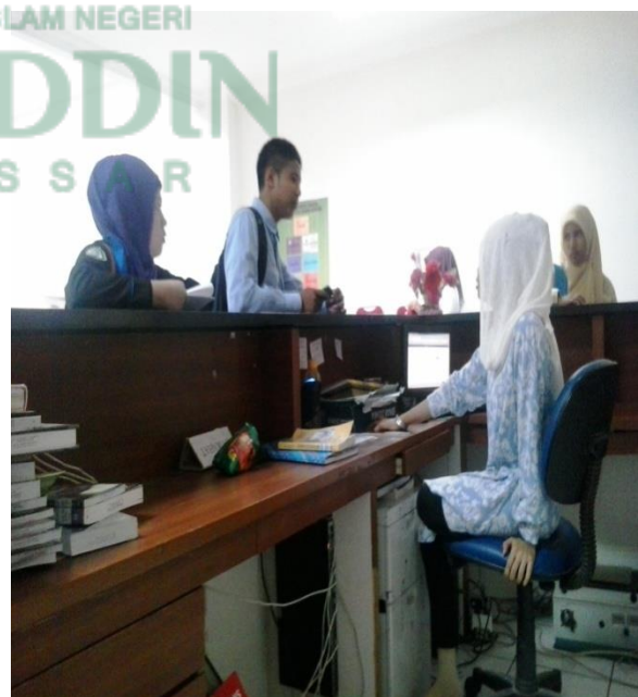
Suasana kerja di bagian pengolahan dan bagian sirkulasi Kamis, 03 september 2015