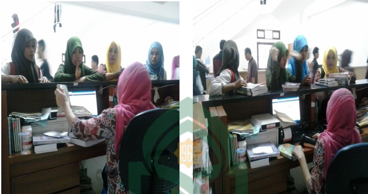
Suasana kerja di sirkulasi bagian peminjaman Selasa, 01 September 2015