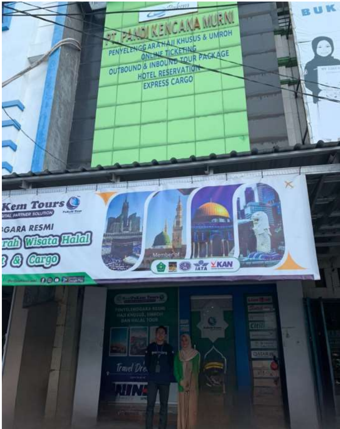
Gambar 1.5. Tampak depan PT. Pandi Kencana Murni