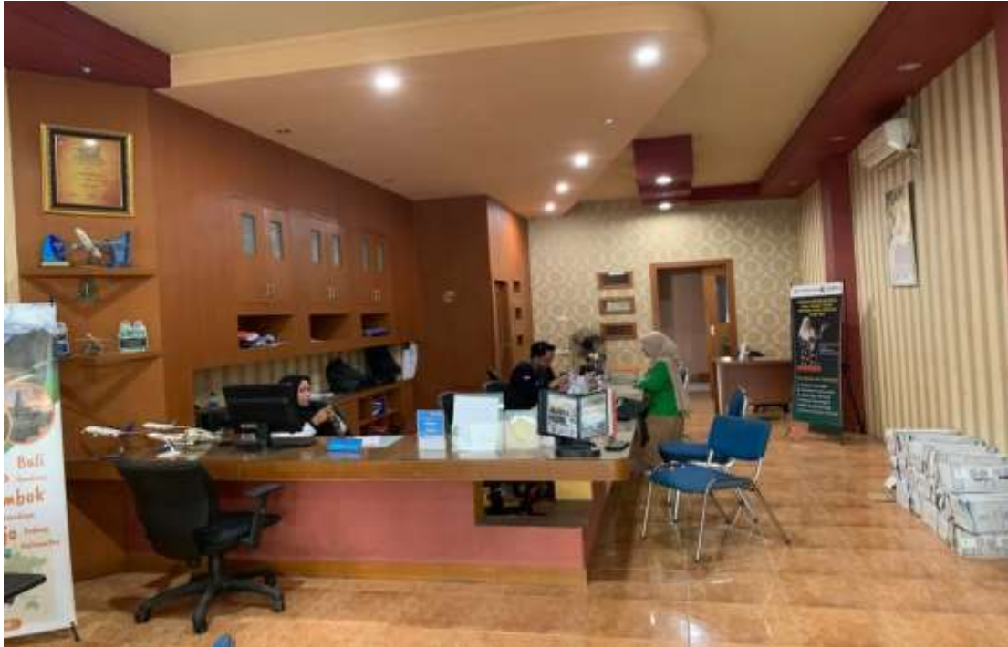
Gambar 1.6. Tampak bagian dalam PT. Pandi Kencana Murni