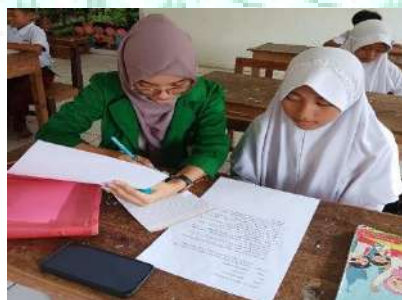
Wawancara dengan Peserta Didik