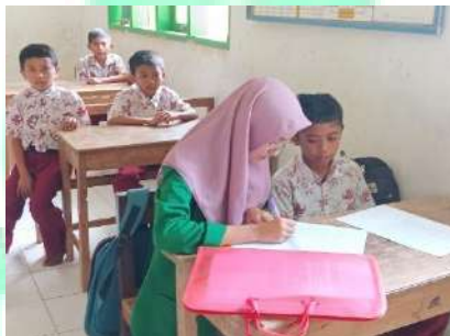
Wawancara dengan Peserta Didik