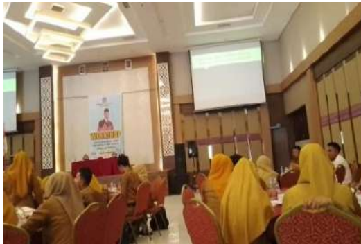
Gambar 14: Pelaksanaan Workshoop Implementasi Kurikulum Merdeka

Dari penjelasan di atas, peneliti dapat menyimpulkan bahwa SD Inpres 5/81 Bana senantiasa ikut berpartisipasi dengan mengikuti KKG seperti kegiatan workshop, untuk peningkatan kompetensi dan skill pendidik, baik saat berada di dalam kelas maupun berada di luar kelas