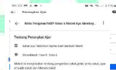
Gambar 7: Fitur Referensi Pemberian Asesmen dan Instrumen Refleksi

Seperti yang dipaparkan oleh para narasumber di awal, gambar di atas merupakan penggunaan aplikasi Merdeka Mengajar yang mempunyai begitu banyak fitur yang sangat membantu dan memudahkan pendidik dalam pekerjaannya. Dalam aplikasi tersebut pendidik disediakan perangkat ajar berupa modul yang berbentuk e-book , pdf, latihan soal serta beragam video pembelajaran yang dapat dibagikan dan ditampilkan dihadapan peserta didik