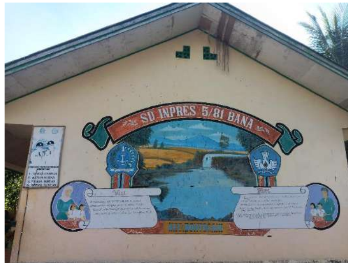
Visi dan Misi SD Inpres 5/81 Bana