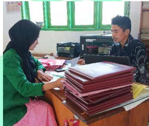
Wawancara dengan Wali Kelas 6 SD Inpres 5/81 Bana