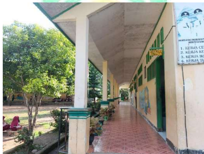
Jejeran Kelas SD Inpres 5/81 Bana

UNIVERSITAS SUMBA WEGATI ALAUDDIN MAKASSAR