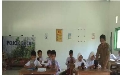
Gambar 2: Pengerjaan Kuis Lewat Quizizz

pembelajaran. Hal ini dapat dibuktikan melalui bukti dokumentasi seperti yang ada di bawah ini: