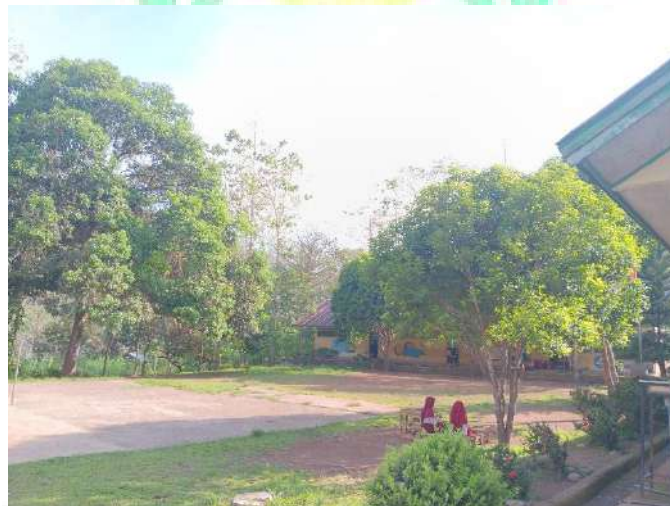
Lapangan SD Inpres 5/81 Bana