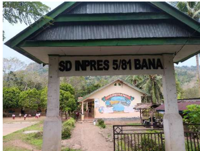
Halaman Depan SD Inpres 5/81 Bana