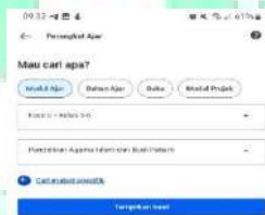
Gambar 4: Fitur Pencarian Perangkat Ajar