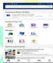
Gambar 3: Tampilan Halaman Beranda Aplikasi Merdeka Mengajar

Berikut merupakan bukti dokumentasi yang dapat menjadi pendukung dari pernyataan para narasumber: