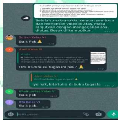
Gambar 9: Pemberian Materi dan Tugas Melalui Aplikasi WhatsApp

Berdasarkan uraian di atas, dapat ditarik sebuah kesimpulan bahwa sikap keterbukaan dalam melakukan perubahan dan percepatan dalam proses implementasi pembelajaran berbasis digital di bidang pendidikan