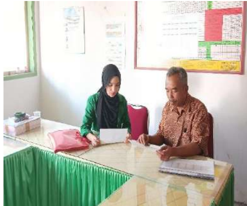
Wawancara dengan Kepala Sekolah SD Inpres 5/81 Bana