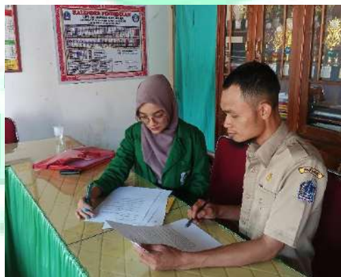
Wawancara dengan Guru PAI dan Budi Pekerti SD Inpres 5/81 Bana