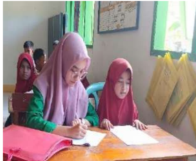
Wawancara dengan Peserta Didik