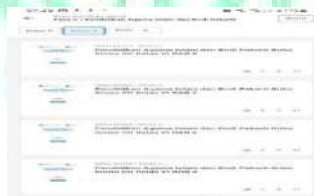
Gambar 5: Fitur Download Referensi Materi