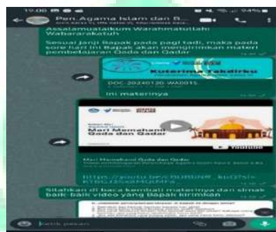
Gambar 8: Grup WhatsApp Untuk Mata Pelajaran Pendidikan Agama Islam dan

Untuk membuktikan kebenaran dari pernyataan di atas, berikut merupakan bukti dokumentasi tentang pemanfaatan aplikasi WhatsApp dalam menunjang proses pembelajaran e-learning di era digital di SD Inpres 5/81 Bana: