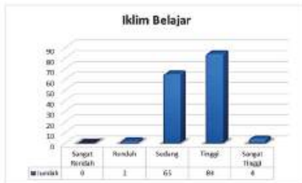
Gambar 4. Diagram batang iklim belajar

Berikutnya adalah variabel iklim belajar. Adapun hasil analisis terkait gambaran tingkat variabel iklim belajar siswa jenjang SMP/MTs di Sulawesi Selatan secara umum, disajikan pada Gambar 4.