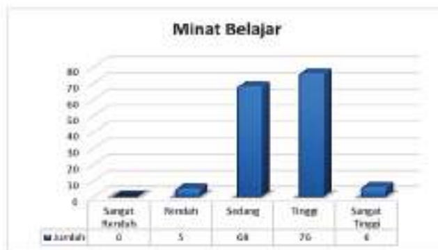
Gambar 5. Diagram batang minat belajar

Berikutnya adalah variabel minat belajar. Adapun hasil analisis terkait gambaran tingkat variabel minat belajar siswa jenjang SMP/MTs di Sulawesi Selatan secara umum, disajikan pada Gambar 5.