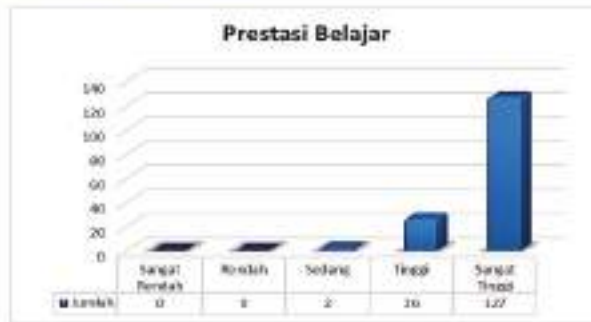
Gambar 6. Diagram Batang Prestasi Belajar

Berdasarkan Gambar 6, dapat diketahui bahwa sebagian besar siswa adalah prestasi belajar kategori sangat tinggi, dan hanya sebagian kecil siswa memiliki prestasi belajar kategori sedang.