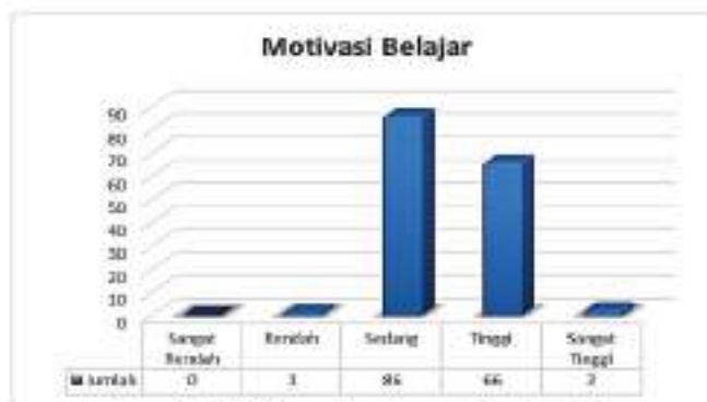
Gambar 2. Diagram batang motivasi belajar

Motivasi belajar menjadi daya penggerak bagi peserta untuk mencapai sesuatu. Adapun hasil analisis terkait gambaran tingkat variabel motivasi belajar siswa jenjang SMP/MTs di Sulawesi Selatan secara umum, disajikan pada Gambar 2.