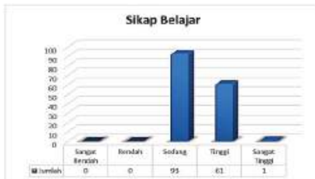
Gambar 3. Diagram batang sikap belajar

Variabel berikutnya yaitu sikap belajar. Adapun hasil analisis terkait gambaran tingkat variabel sikap belajar siswa jenjang SMP/MTs di Sulawesi Selatan secara umum, disajikan pada Gambar 3.