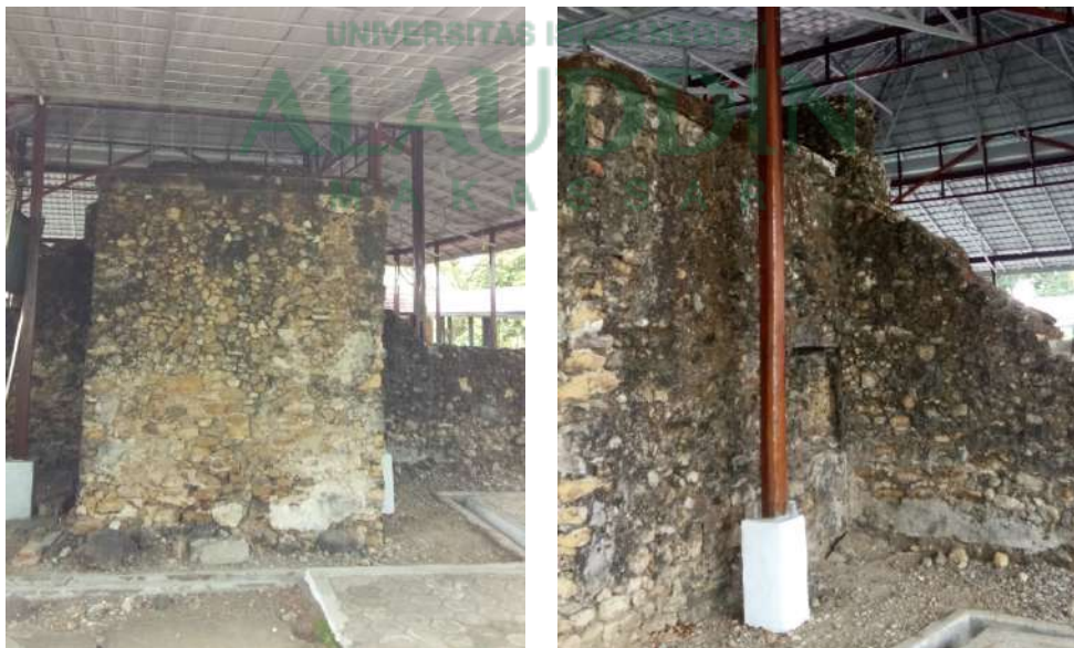
Gambar 4: Tampak Masjid dari Belakang