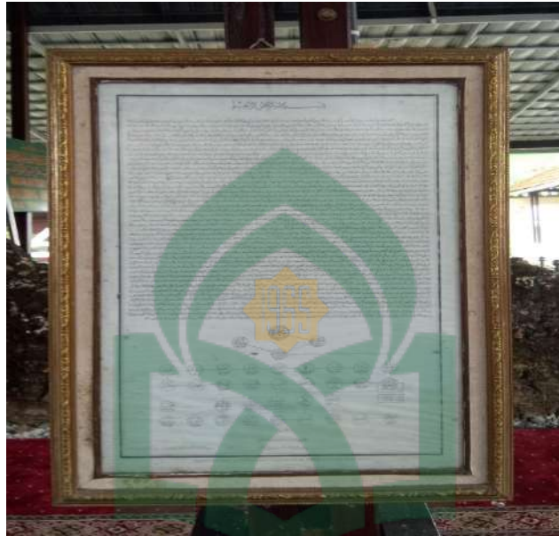
Gambar 7: Silsilah Keturunan Sayyid Jamaluddin Al-Akbar Al-Husain