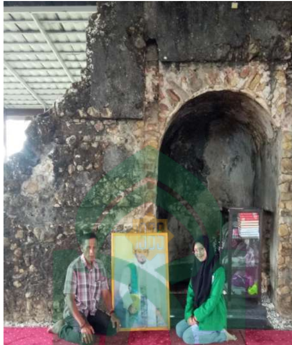
Gambar 9: Prosesi Wawancara dengan Puang Alang