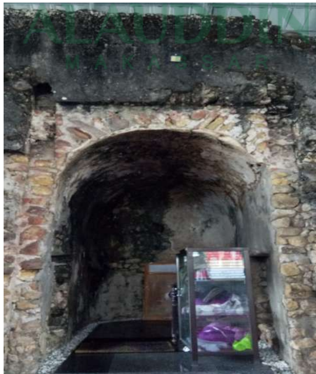
Gambar 6: Mihrab Masjid