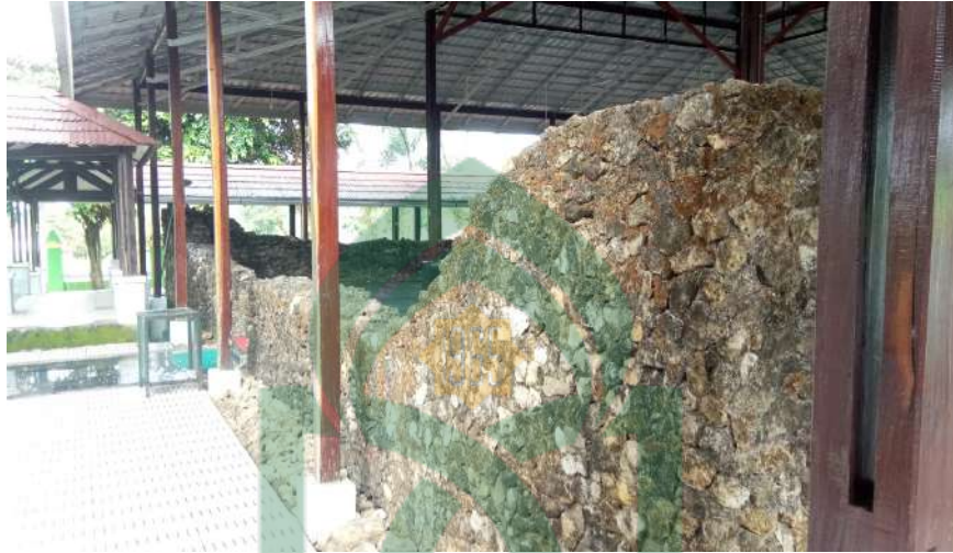
Gambar 3: tampak Masjid dari Samping