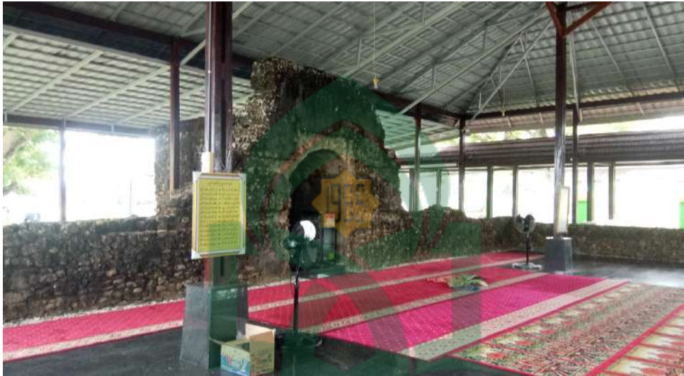
Gambar 5: Tampak Masjid dari Dalam