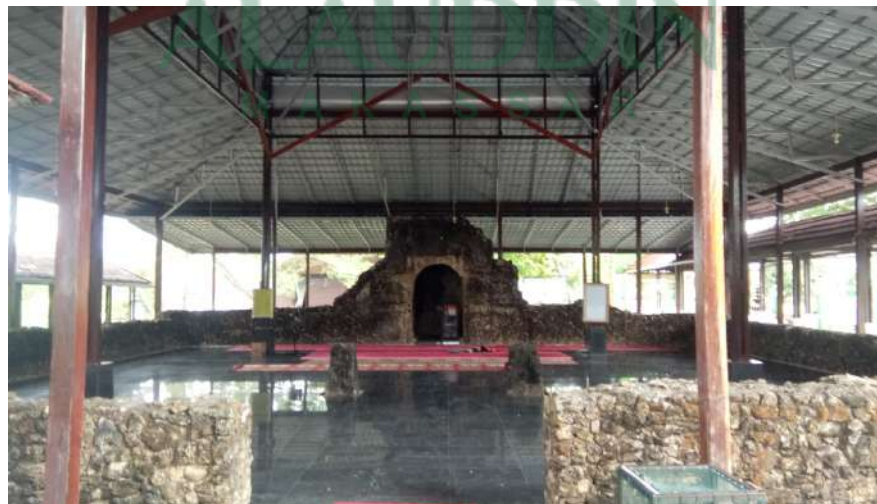
Gambar 2: Tampak Masjid Setelah Dilakukan Penambahan Bangunan