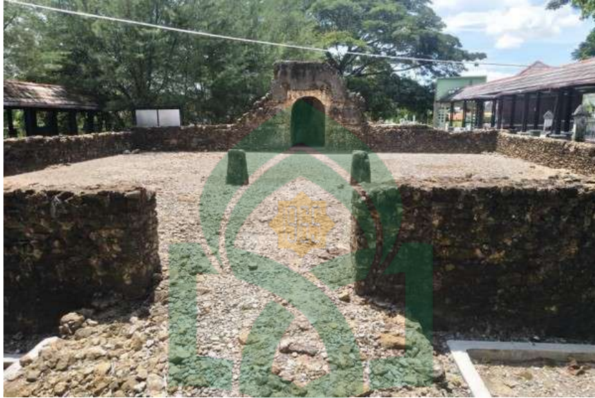
Gambar 1: Tampak Masjid Sebelum Dilakukan Penambahan Bangunan