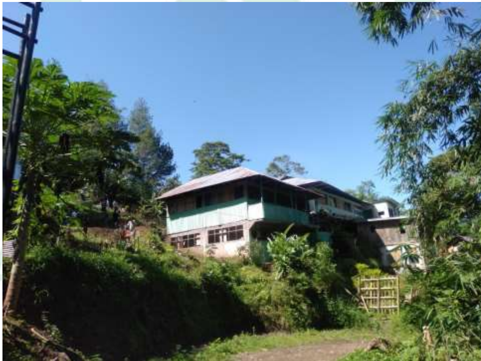
Madrasah Aliyah Ukhuwah Islamiyah Pattallassang