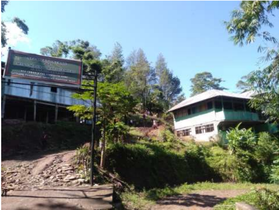
Gerbang Madrasah Aliyah Ukhuwah Islamiyah Pattassallasang