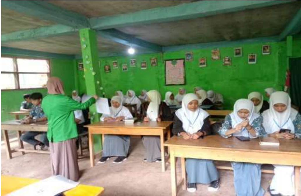
Peserta didik kelas XI A mengisi angket

Menjelaskan isi angket kepada peserta didik kelas XI A