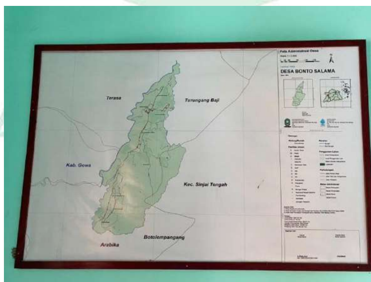
Gambar 1.1 Peta Desa Bonto Salama

Desa Bonto Salama terletak di bagian barat Kota Kabupaten Sinjai tepatnya di Kecamatan Sinjai Barat dengan ketinggian 450-700 Mdpa dan curah hujan: 2.000 mm/th. Jarak tempuh dari kota kecamatan yaitu \pm 18 Km, dari kota kabupaten Sinjai + 58 Km, dan dari kota Makassar (Provinsi) \pm 135 Km. Dilihat dari situ lah muncul gagasan-gagasan perlu dijaga agar tetap berkesinambungan dalam berfikir guna melindungi dan melestarikan kekayaan Alam tersebut agar tetap subur dan bermanfaat bagi generasi penerus Desa Bonto Salama.