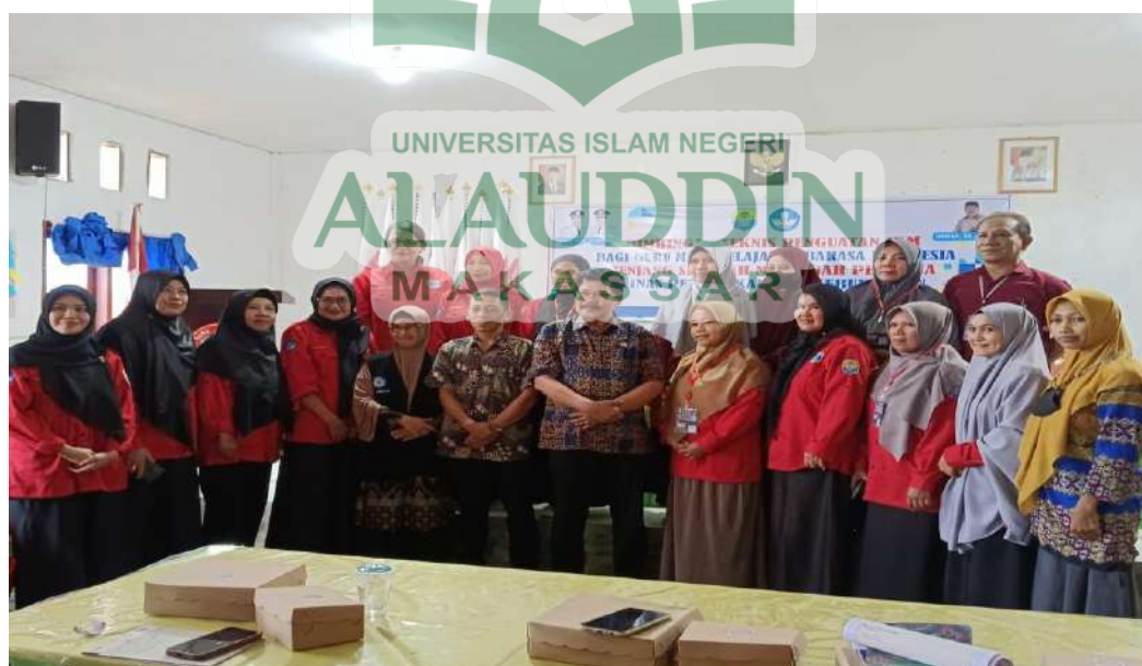
Gambar 4.7 Bimtek

Bimtek IKM (implementasi kurikulum merdeka) ialah bentuk pelatihan bimbingan teknis mengenai implementasi kurikulum merdeka berupa kegiatan bimbingan teknis yang diselenggarakan untuk memberikan pemahaman, keterampilan, dan panduan kepada para pendidik, kepala sekolah, atau pihak-pihak terkait dalam menerapkan atau mengimplementasikan konsep dan prinsip dari kurikulum Merdeka. Sebagaimana diselenggarakan oleh dinas pendidikan kabupaten Tolitoli, bimtek (bimbingan teknis) membantu tenaga pendidikan dalam meningkatkan kualitas tenaga pendidik.