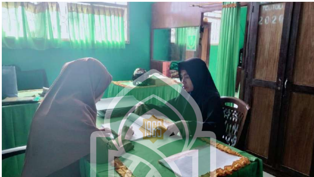
Gambar 4.6 Supervisi

supervisi tersebut dalam bentuk poin dan kemudian skor ini direkap dari penialain yang telah diperoleh tenaga pendidik. Inilah bentuk evaluasi diberikan kepada guru terkait profesionalitasnya sebagai tenaga pendidik.