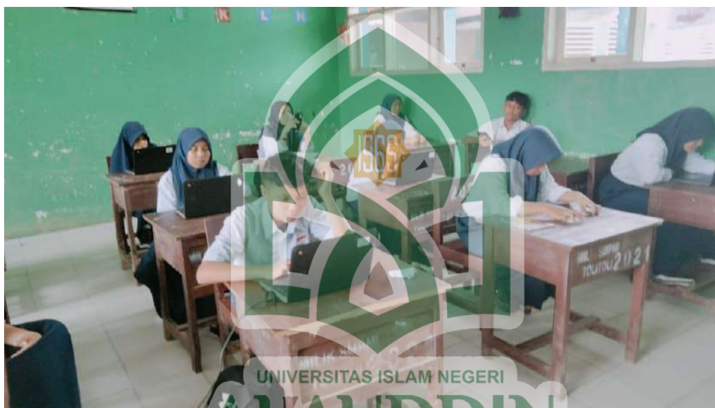
Gambar 4.10 Pemanfaatan media pembelajaran.

Pemanfaatan media pembelajaran merupakan pendekatan yang penting dalam pengajaran dan pembelajaran. Media pembelajaran melibatkan penggunaan berbagai alat, sumber daya, dan teknologi untuk membantu menyampaikan materi pembelajaran dengan cara yang lebih menarik, efektif, dan bervariasi. Berikut adalah beberapa manfaat dan cara pemanfaatan media pembelajaran.