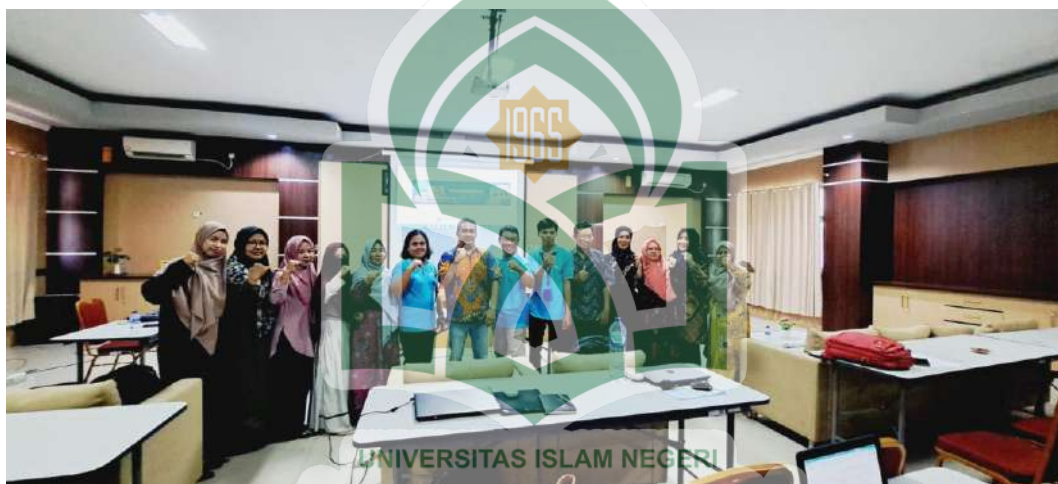
Gambar 4.5 Pemanfaatan Croome Book

perpustakaan, mengelola buku tamu, data kelulusan dan lain-lain, tenaga kependidikan terbagi atas 2 yakni staf tata usaha dan operator. Staf tata usaha memiliki tugas menyusun dan mengelola data-data siswa dan mencatat segala program dan membuat surat penyuratan keluar dan masuk. Sedangkan operator, memiliki tugas mengelola data-data siswa secara online mengisi, mengelola, dan menyimpan data yang terkait dengan kegiatan pendidikan di sekolah, seperti data siswa, guru, kelas, mata pelajaran, dan lain-lain.