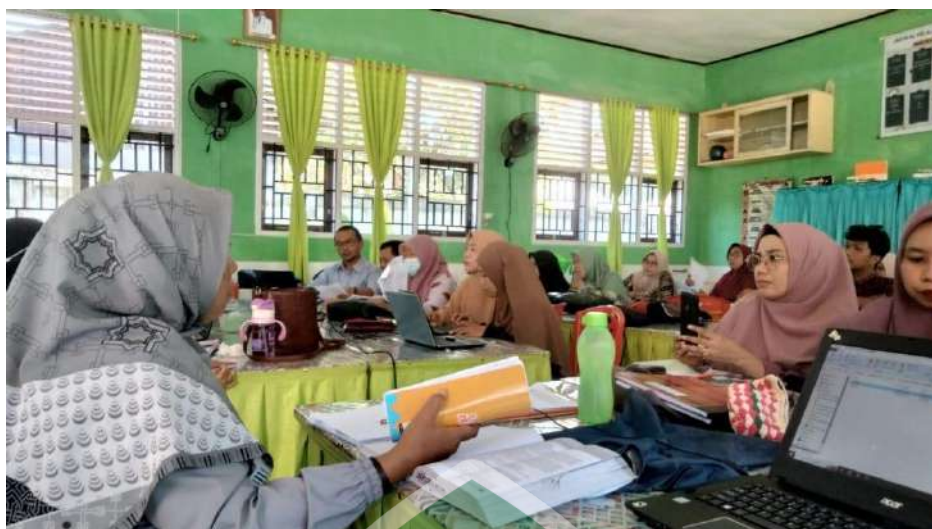
Gambar 4.8 MGMP

Gambar diatas menunjukkan kegiatan MGMP yang diselenggarakan oleh komunitas yang ketua oleh pimpinan MGMP dibawah naungan dinas pendidikan, kegiatan ini berlangsung yang dihadiri dari berbagai sekolah menengah pertama. Seperti gambar diatas mereka sedang menerima materi dan mendengarkan materi secara saksama.