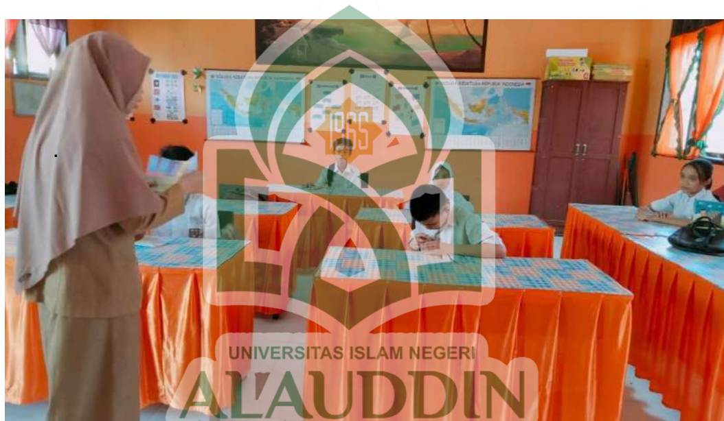
Gambar 4.1 Sosialisasi

Sosialisasi ini dibentuk oleh kepala sekolah sebagai bentuk pengenalan sekolah kepada pihak luar tentang proses penerimaan peserta didik baru. Selain itu juga sebagai bentuk keterbukaan informasi publik sekolah kepada masyarakat. Sosialisasi itu sendiri penting adanya karena bila tidak ada sosialisasi maka bisa dipastikan apapun tujuan yang dimaksudkan untuk diri sendiri ataupun untuk orang lain tidak akan tercapai.