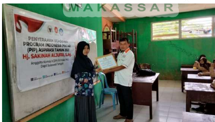
Gambar 4.4 Program Indonesia pintar

Program indonesia pintar (PIP) salah satu program yang sangat membantu para peserta didik di mana setiap peserta didik mendapatkan dana sebanyak Rp. 500.000, dana ini diberikan satu kali setiap semester. 11