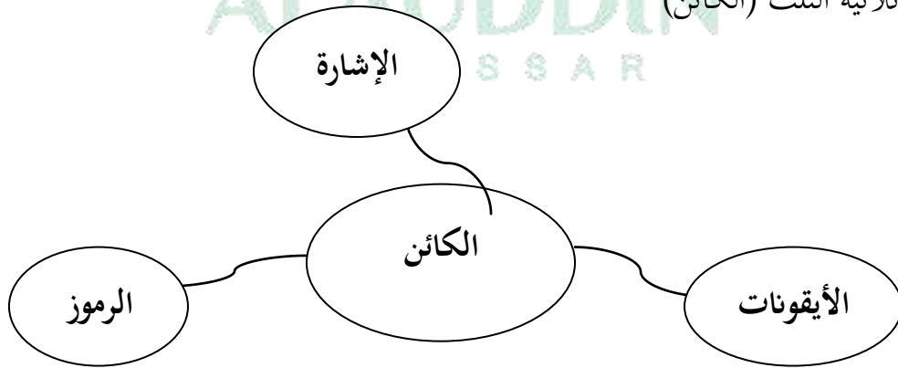
صورة ٤: تنقسم ثلاثي الثالث