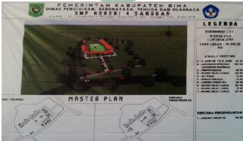
Peta SMP Negeri 4 Sanggar Bima NTB.