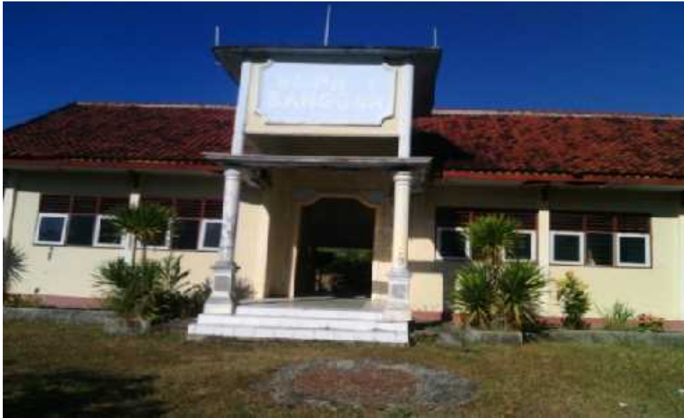
Halaman depan SMP Negeri 4 Sanggar Bima NTB.