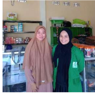
Wawancara Bersama Koordinator Koperasi Putra Pondok Pesantren Syekh Hasan Yamani