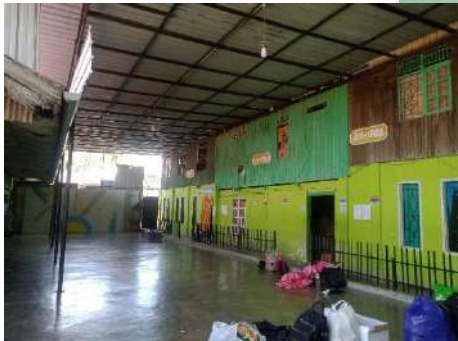
Asrama Putri Pondok Pesantren Syekh Hasan Yamani