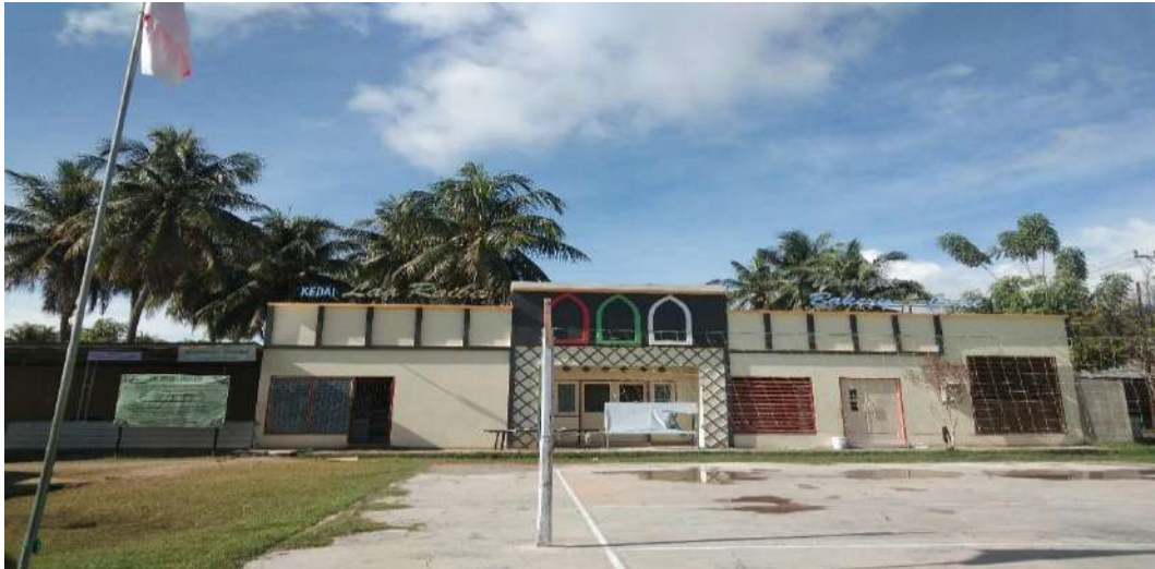
Toko Koperasi Putra dan Toko Bakery Pondok Pesantren Syekh Hasan Yamani