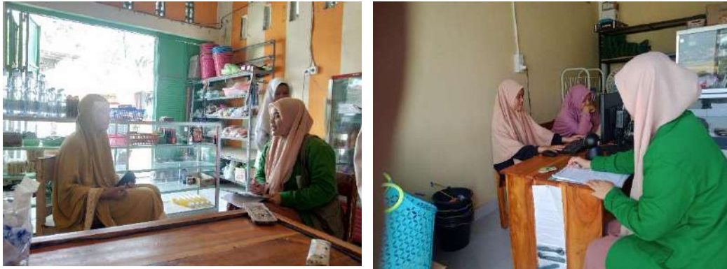
Wawancara Bersama Santri Pengabdian Toko Koperasi Putra & Putri Pondok Pesantren Syekh Hasan Yamani