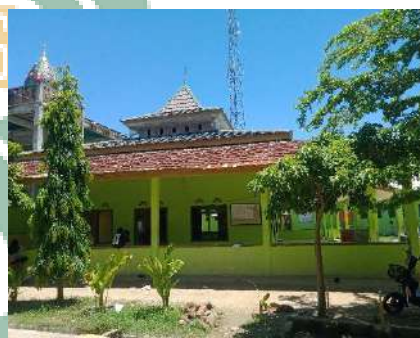
Mesjid Lama Pondok Pesantren Syekh Hasan Yamani