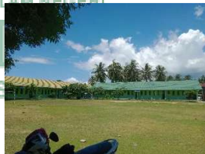
Lapangan Santri Putra Pondok Pesantren Syekh Hasan Yamani