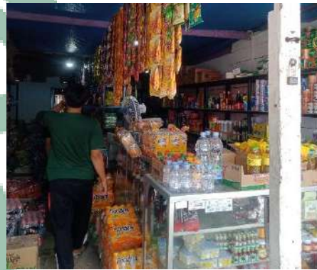
Kondisi Toko Campuran (Lara-Raiba 1) Pondok Pesantren Syekh Hasan Yamani