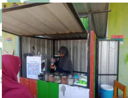
Stand Minuman Masa Kini (Minuman Boba) Pondok Pesantren Syekh Hasan Yamani