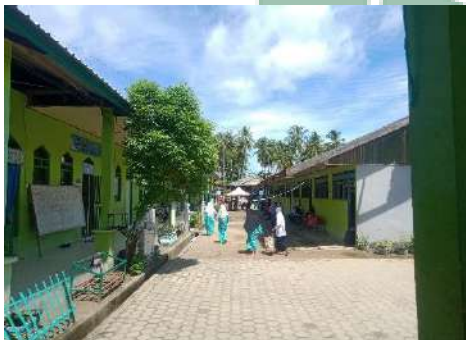
Halaman Depan Santri Putri Pondok Pesantren Syekh Hasan Yamani