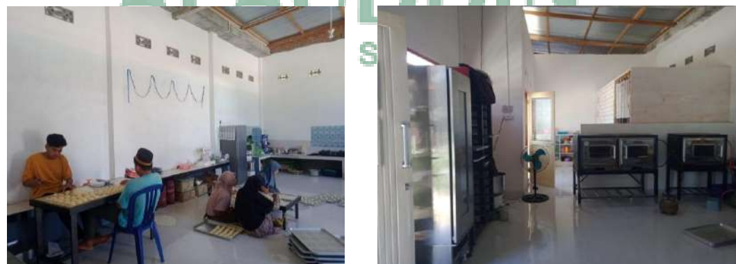
Kondisi Yamani Bakery dan Proses Pembuatan Roti