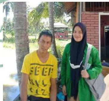
Wawancara Bersama Koordinator Budidaya Ikan Nila Pondok Pesantren Syekh Hasan Yamani