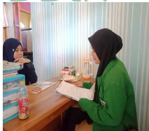
Wawancara Bersama Bendahara Pondok sekaligus Koordinator Usaha Bakery Pondok Pesantren Syekh Hasan Yamani