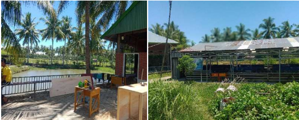
Tempat Budidaya Ikan Nila dan Ikan Lele