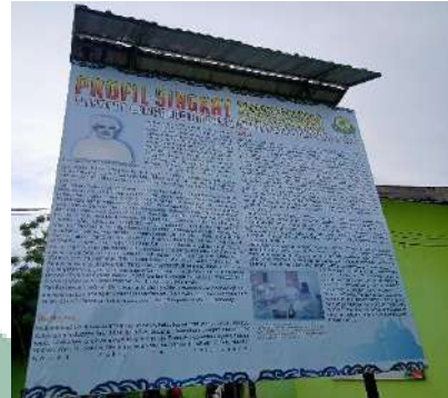
Profil Singkat Pondok Pesantren Syekh Hasan Yamani