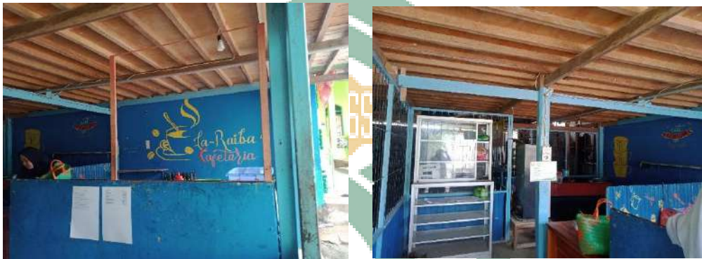
Kondisi Cafetaria Putri Pondok Pesantren Syekh Hasan Yamani

UNIVERSITAS ISLAM NEGERI ALAUDDIN M A K A S S A R