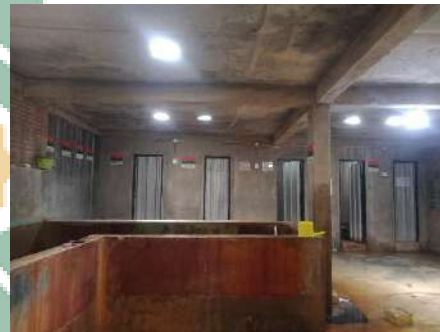
Kamar Mandi Putri Pondok Pesantren Syekh Hasan Yamani