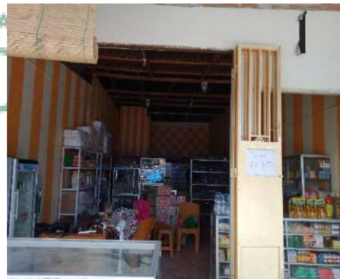
Kondisi Toko Plastik & Bahan Kue (Lara-Raiba 2) Pondok Pesantren Syekh Hasan Yamani