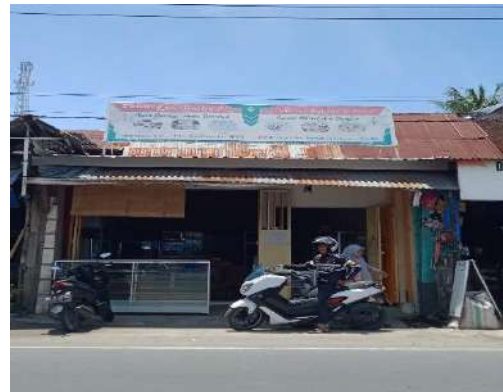
Toko Campuran & Toko Plastik, Bahan Kue Pondok Pesantren Syekh Hasan Yamani