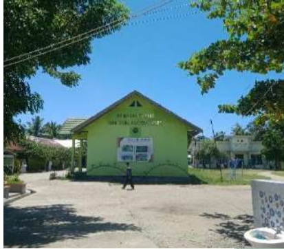
Halaman Depan Pondok Pesantren Syekh Hasan Yamani