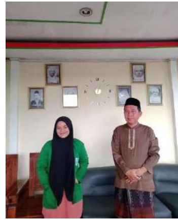
Wawancara Bersama dengan Pimpinan Pondok Pesantren Syekh Hasan Yamani