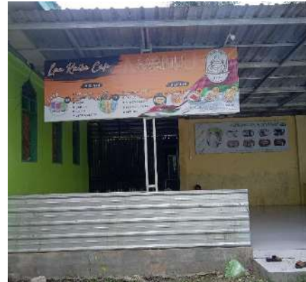
Cafetaria Putra & Putri Pondok Pesantren Syekh Hasan Yamani