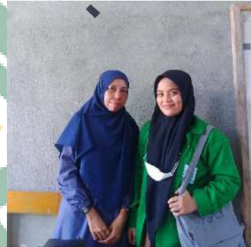
Wawancara Bersama Koordinator Koperasi Putri Pondok Pesantren Syekh Hasan Yamani