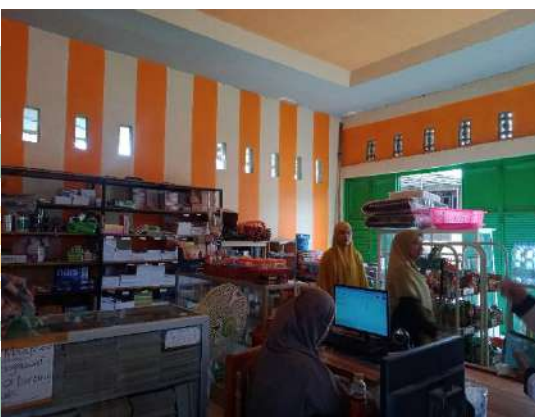
Kondisi Toko Koperasi Putri Pondok Pesantren Syekh Hasan Yamani