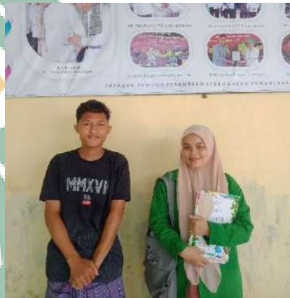
Wawancara Bersama Koordinator Cafeteria Putra Pondok Pesantren Syekh Hasan Yamani