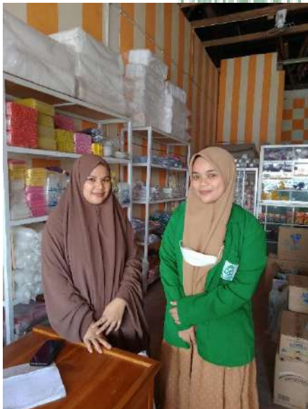
Wawancara Bersama Koordinator Toko Plastik Pondok Pesantren Syekh Hasan Yamani