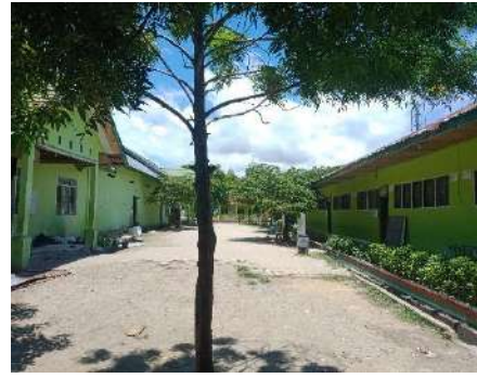
Asrama Putra Pondok Pesantren Syekh Hasan Yamani