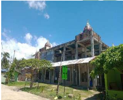
Mesjid Baru Pondok Pesantren Syekh Hasan Yamani