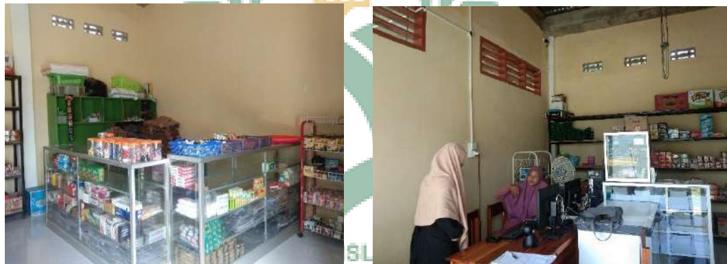
Kondisi Toko Koperasi Putra Pesantren Syekh Hasan Yamani