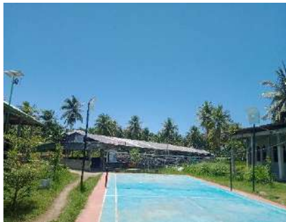
Lapangan Takraw Pondok Pesantren Syekh Hasan Yamani