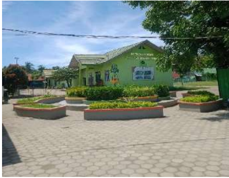
Taman Pondok Pesantren Syekh Hasan Yamani