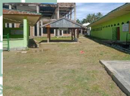
Parkiran Pondok Pesantren Syekh Hasan Yamani