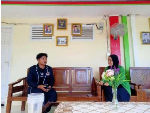
Wawancara Bersama Koordinator Budidaya Ikan Lele Pondok Pesantren Syekh Hasan Yamani