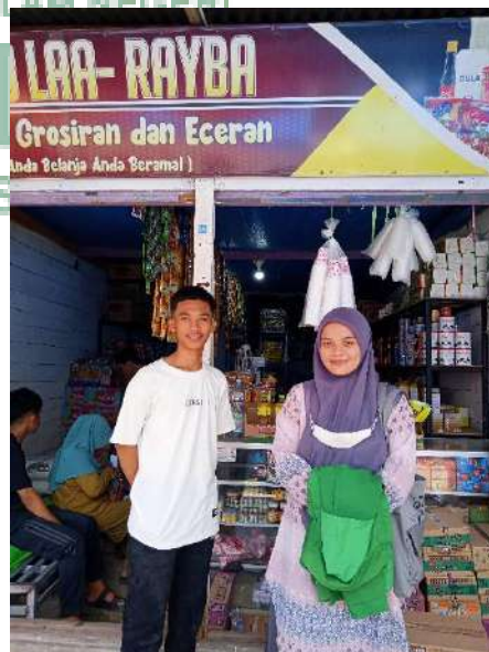
Wawancara & Foto Bersama Santri Pengabdian Toko Campuran Pondok Pesantren Syekh Hasan Yamani