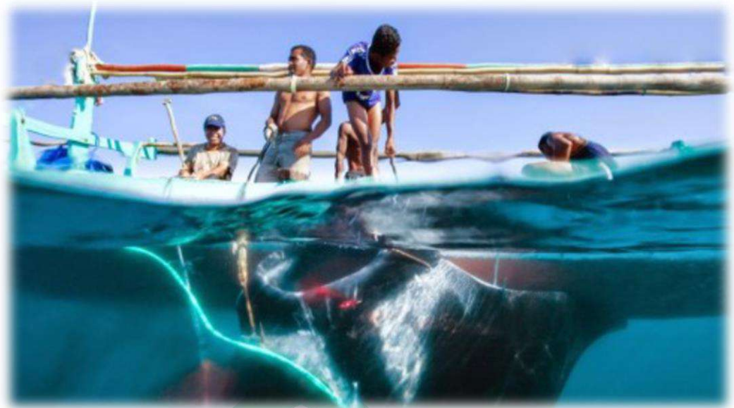
Gambar 1.1 Proses penangkapan Ikan Pari Manta