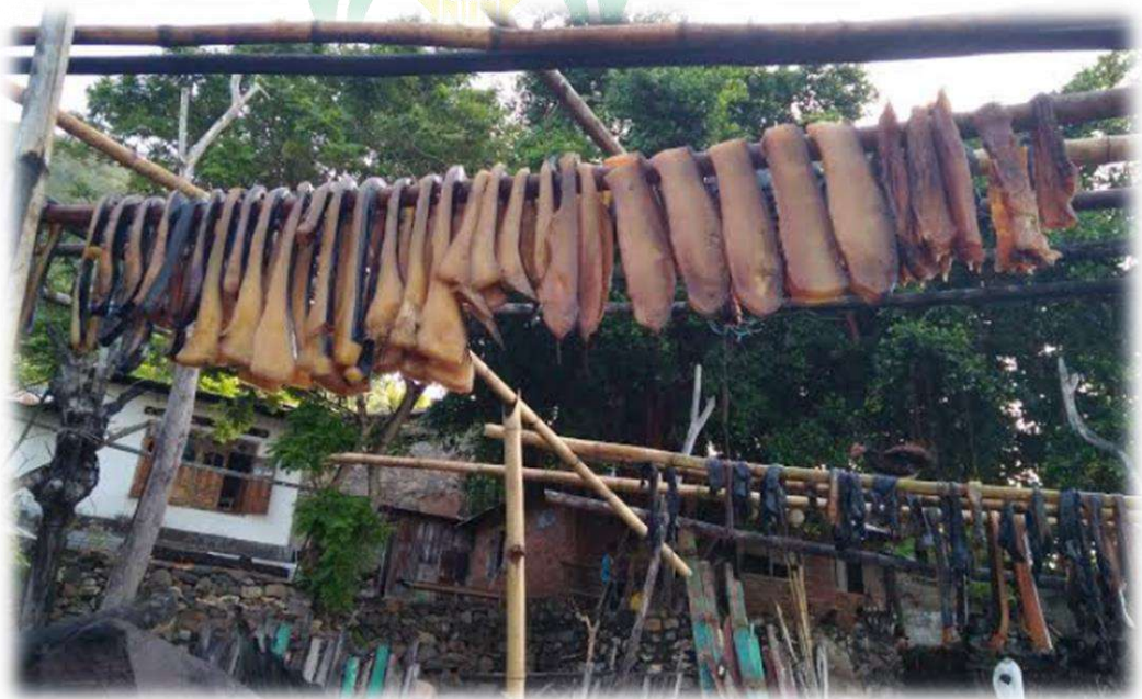
Gambar 1.2 Ikan Pari yang sudah di potong dan dikeringkan