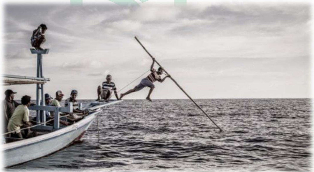
Gambar 1.4 Bentuk perahu yang digunakan nelayan