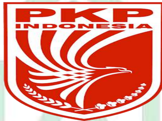
Gambar 1.1 Lambang PKP Indonesia