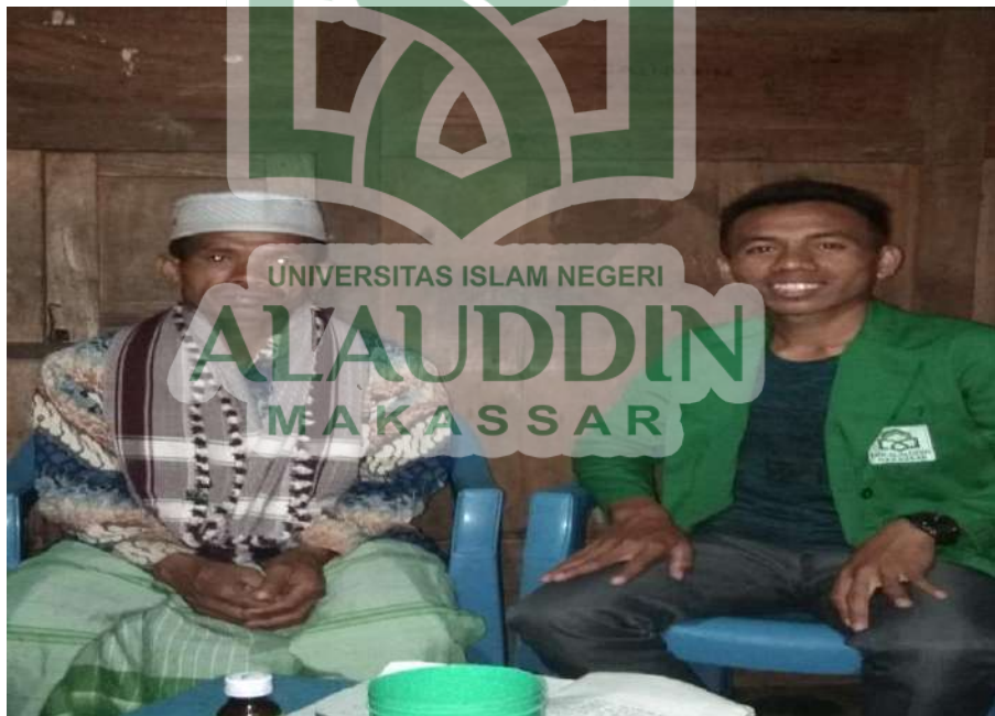
Dokumentasi bersama masyarakat