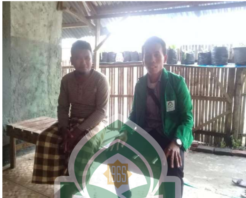
Dokumentasi bersama masyarakat

UNIVERSITAS ISLAM NEGERI ALAUDDIN MAKASSAR