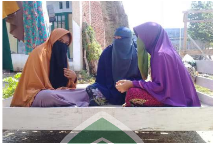
Dokumentasi Para Ukhty