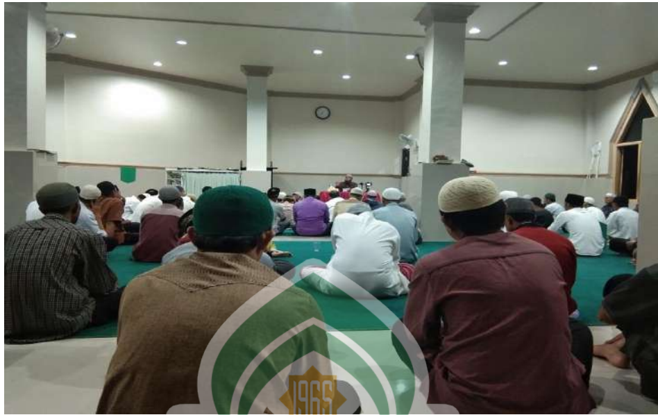
Dokumentasi Lagi Kajian di Masjid Al-Furqon