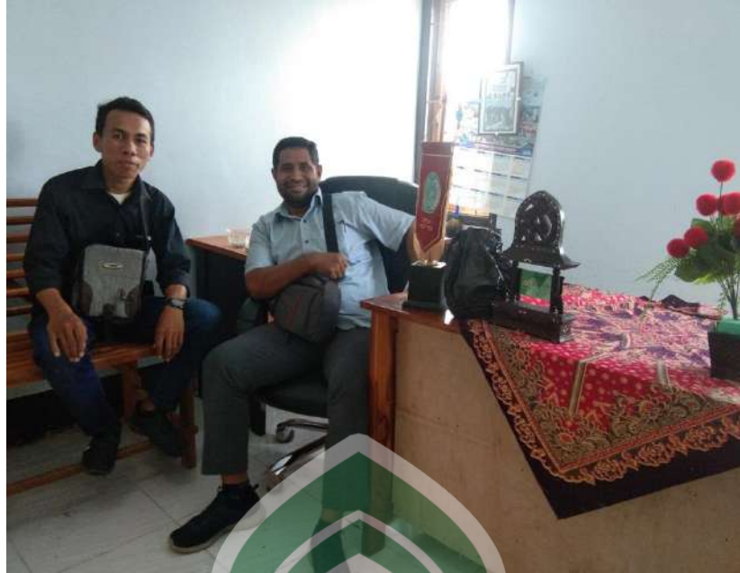
Dokumentasi Bersama Kepala Desa O.o