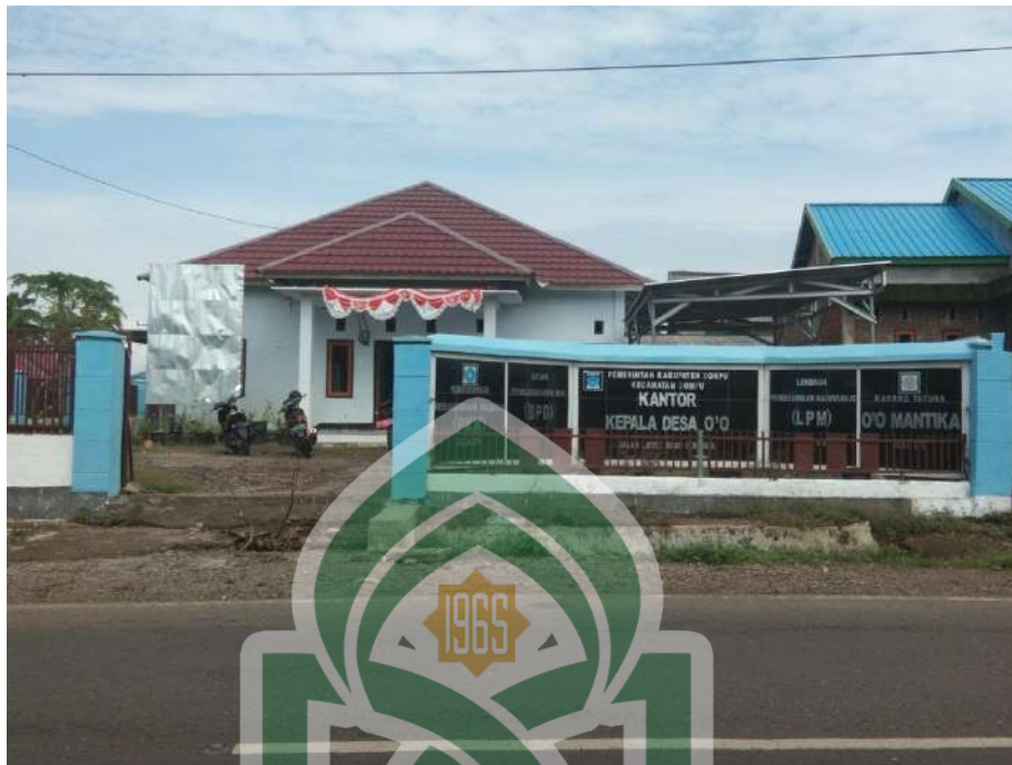
Kantor Desa O,o