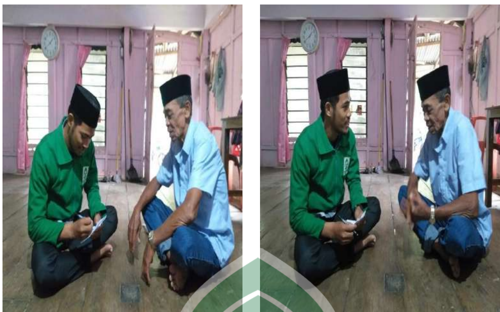
Fota wawancara di rumah Nompo ( Punggawa ) Pulau Karanrang Desa Mattiro Bulu