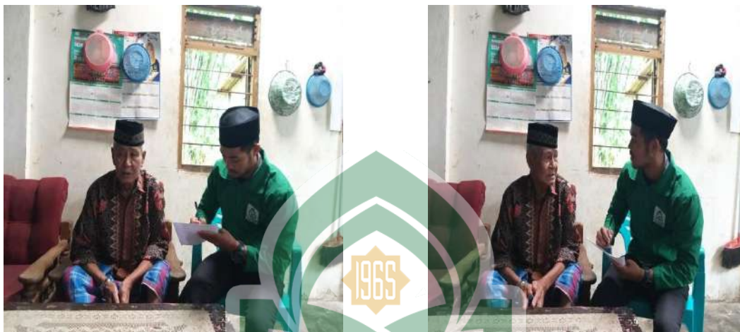
Fota wawancara di rumah Raupung ( Guru Pa' baca ) Pulau Karanrang Desa Mattiro Bulu