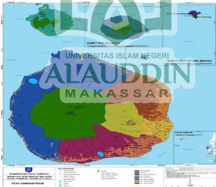
Gambar 4.1 : Peta Administrasi Kota Ternate