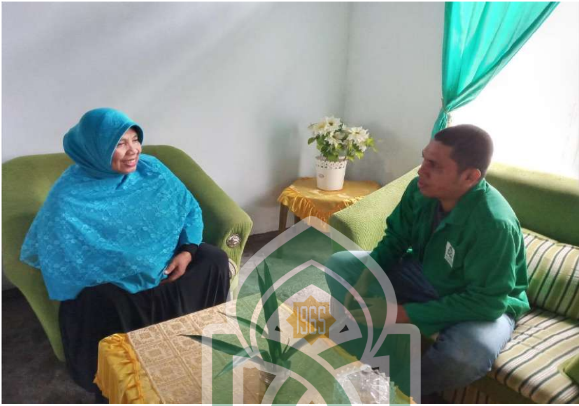
Foto 1 dan 2 diambil saat melakukan wawancara dengan Tokoh masyarakat Dufa-Dufa