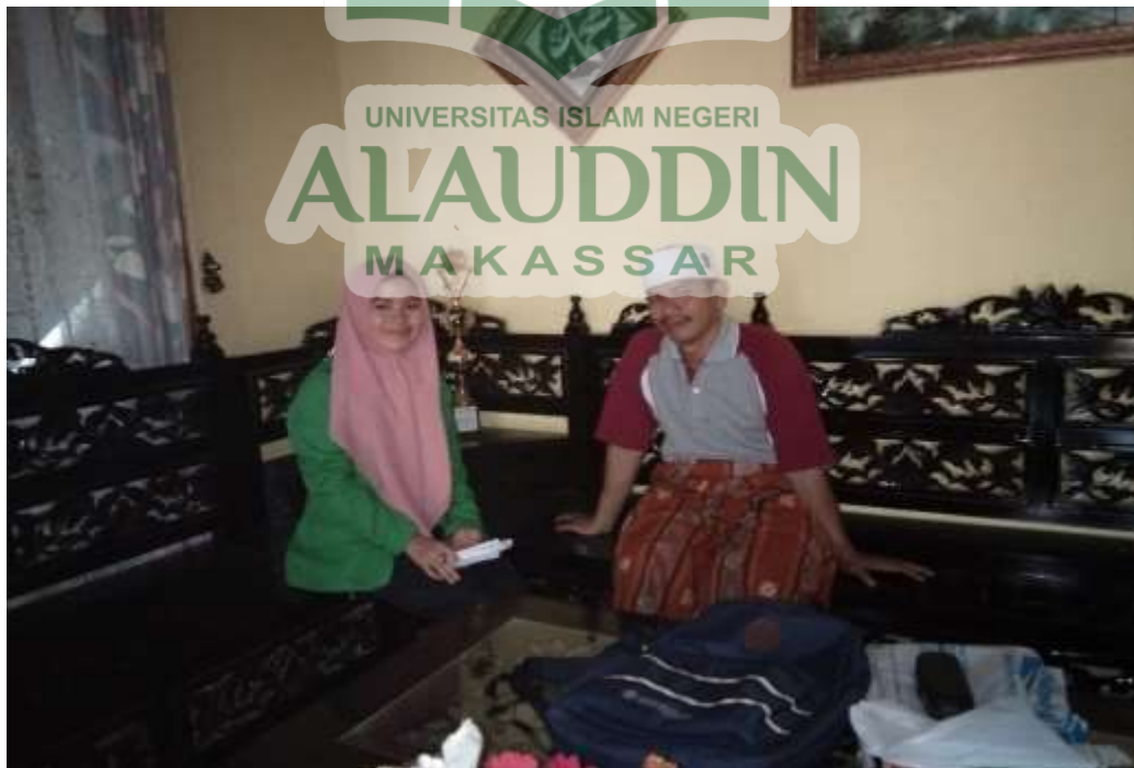
Wawancara dengan toko agama