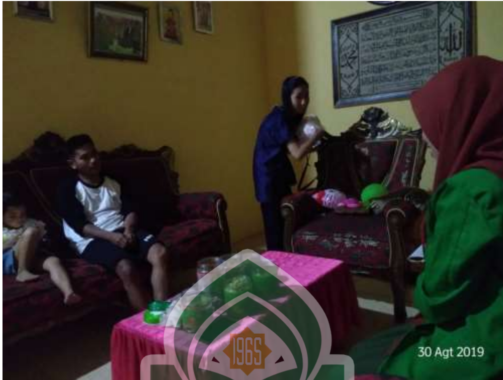
Wawancara dengan toko pemuda