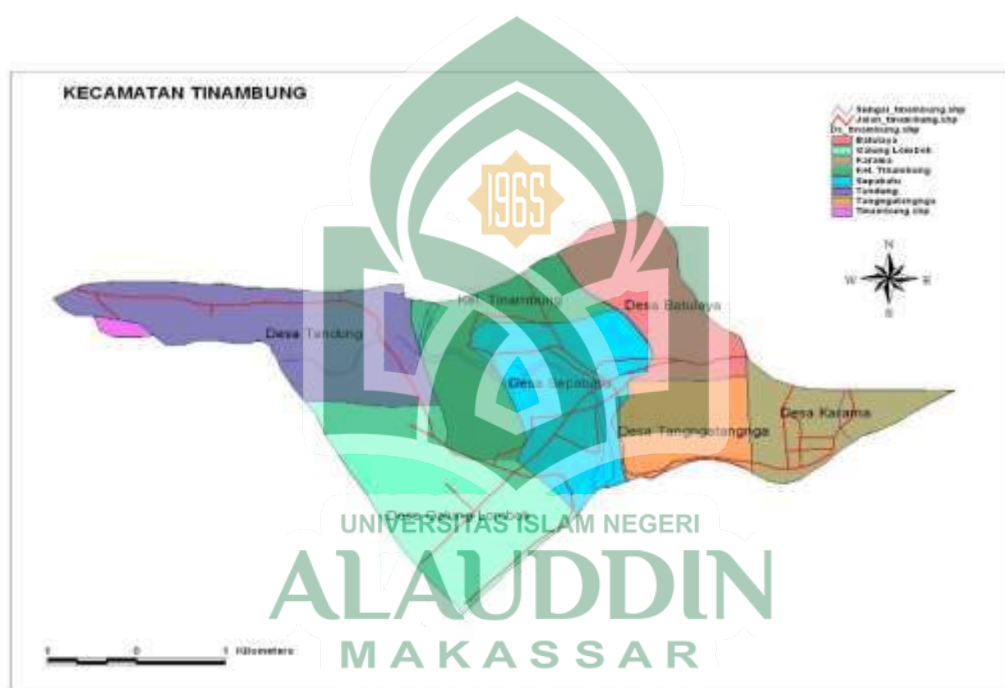
Gambar 4.1 Peta Lokasi Penelitian

dibutuhkan untuk pembangunan pertanian. Perkebunan dan perikanan daratan dari laut. Sebagian besar wilayah (>78% dari luar kabupaten). Memiliki topografi bergunung, dengan kelas lereng dominan 41-60% dan 60% sisanya di ubah oleh topografi datar dengan dengan kelas lereng 2. Kabupaten ini memiliki tidak krang dari 43 gunung dan 35 sungai di menyetujui 5 aliran golongan besar yang mengalir wilayah kabupaten ini. Dua sungai terpanjang adlah sungai Maloso dan suangai Mandar, masing-masing 95 km dan 90 km. 52