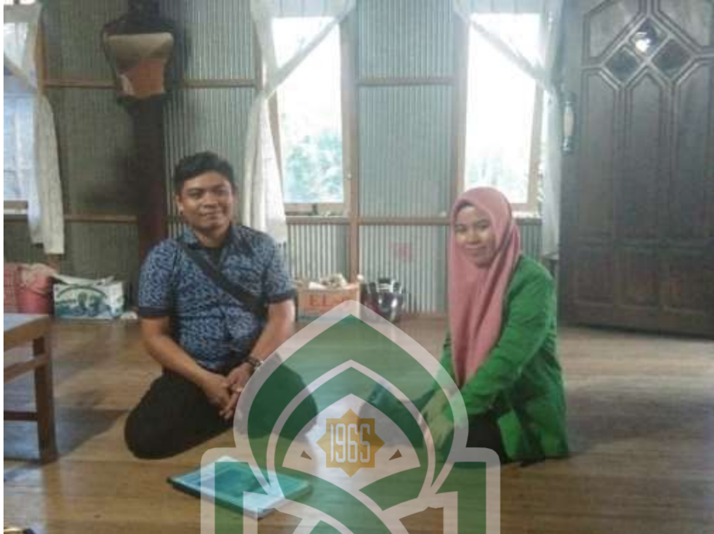
Wawancara dengan sekretaris desa