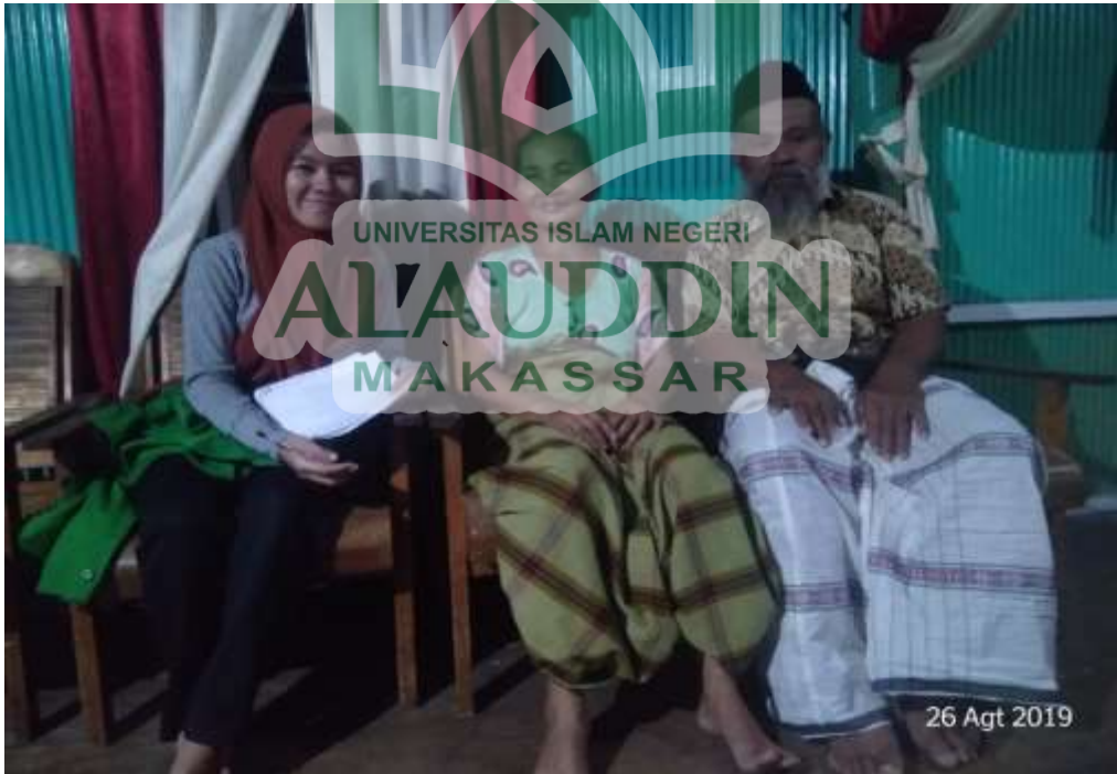
Wawancara dengan keluarga nelayan