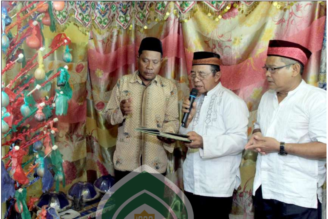
Ket: Proses pembacaan do'a khataman yang dipimpin oleh Guru mengaji dan Imam Desa.