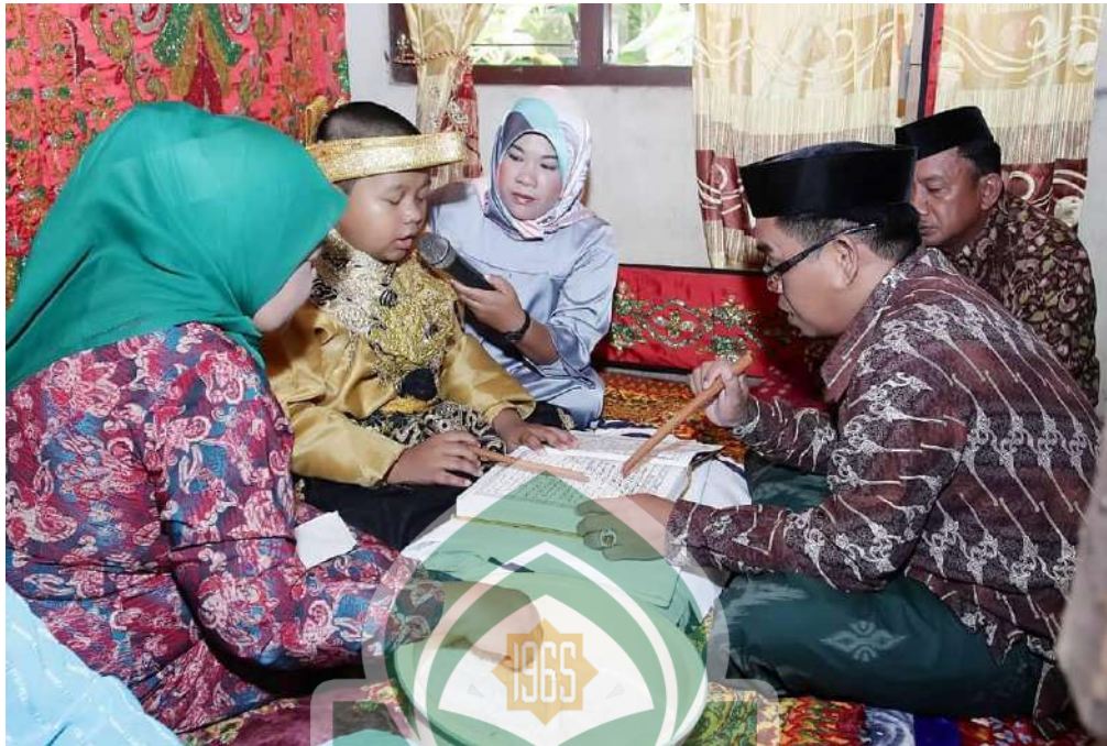
Ket: Saat proses khataman al-Qur'an yang dipimpin oleh Guru mengaji