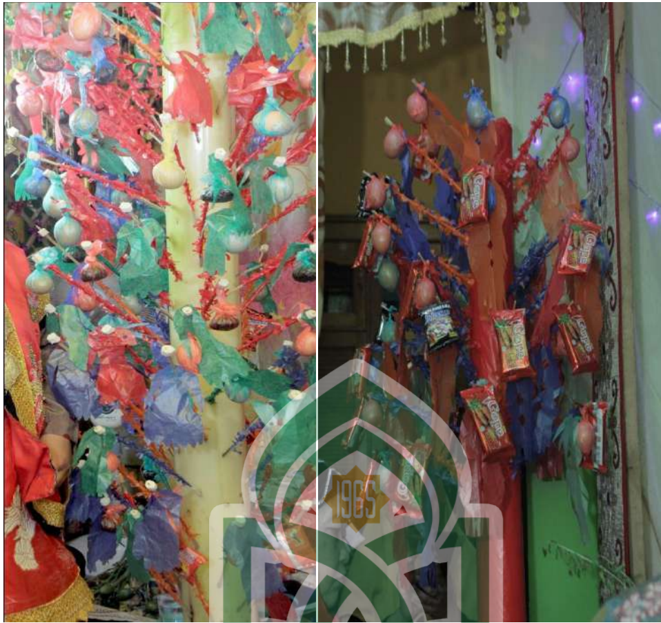
Ket: Bunga Male