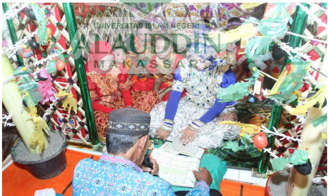
Ket: proses khataman al-Qur'an yang dilakukan sehari sebelum resepsi pernikahan