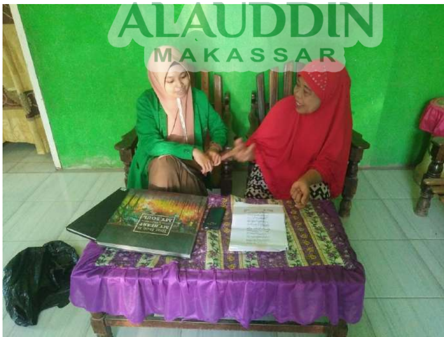
Ket: Guru mengaji sekaligus pelaksana tradisi Mappanre Temme'