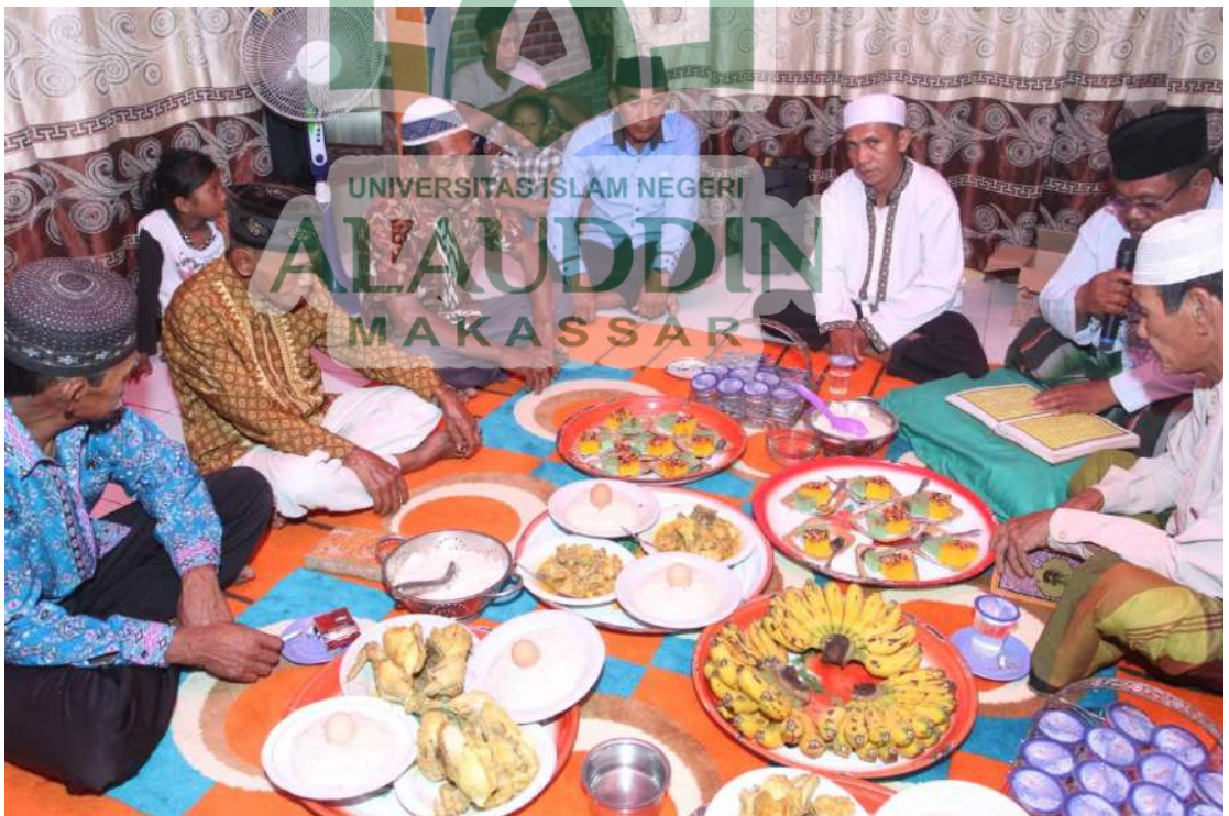
Ket: Proses Mappanre atau memberi makan kepada para tamu.