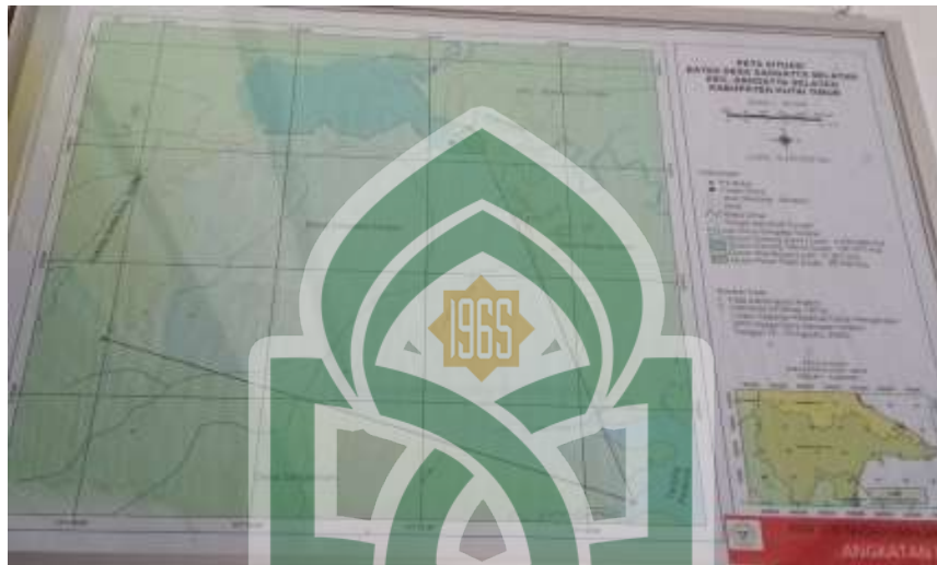
Peta lokasi Desa Sangata Selatan

Gambaran umum lokasi penelitian meliputi gambaran umum Kabupaten Kutai Timur dan gambaran umum Desa Sangata Selatan. Penulis memberi gambaran umum tersebut karena penulis menganggap hal tersebut sangat urgen serta memberikan andil dalam melakukan penelitian, pada saat pengambilan data yang digunakan terhadap suatu masalah yang diteliti.. 1