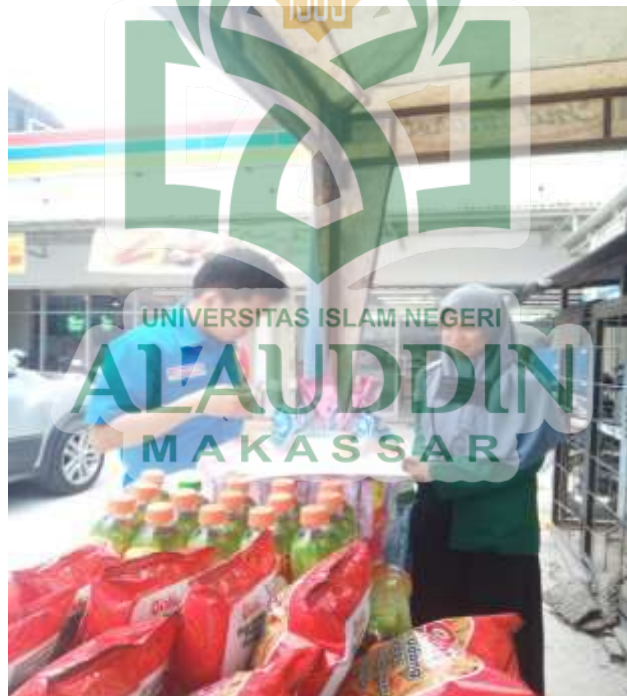
Gambar 8 : foto dengan Onjeng diambil saat wawancara