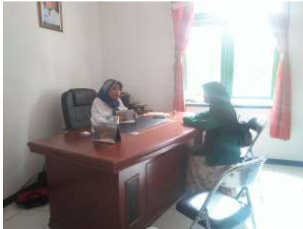
Gambar 1 : Foto dengan Camat Kecamatan Sangata Selatan