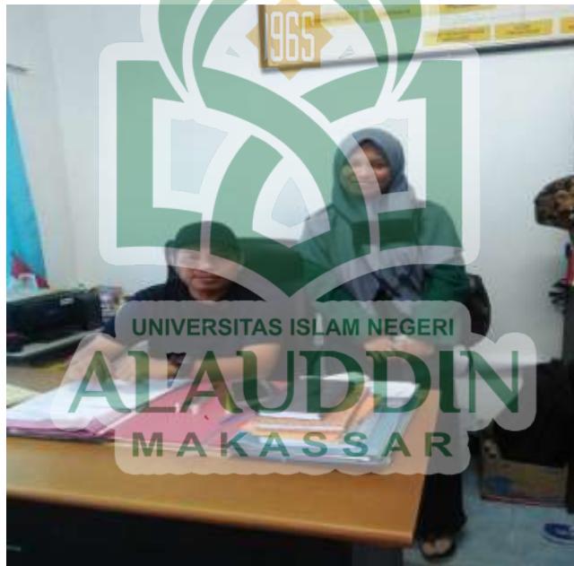
Gambar 2 : Foto dengan Kepala Desa Sangata Selatan