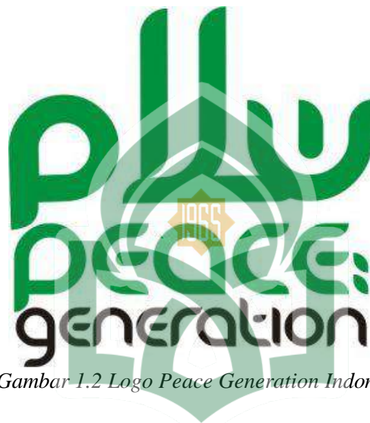
Gambar 1.2 Logo Peace Generation Indonesia

Peace Generation Indonesia adalah organisasi yang bergerak di bidang pendidikan perdamaian. Berfokus pada pengembangan pelatihan perdamaian, media pembelajaran perdamaian dan kegiatan kampanye serta aktivasi konten perdamaian. Berkomitmen untuk menyebarkan perdamaian dengan cara-cara yang ceria melalui media kreatif.