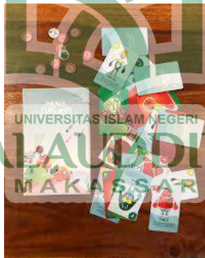
Gambar 1.3 Board game Galaxi Obscurio

Galaxi Obscurio bercerita tentang lima makhluk luar angkasa yang hidup di enam planet: Moyo, Rinca, Selio, Battoa, Weda dan Rimunja. Dalam sebuah galaxy yang indah 6 planet berputar dengan damai dan bahagia, 5 spesies alien terbesar hidup di dalamnya. Mereka tersebar di semua planet, membangun peradaban dan