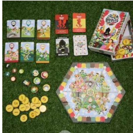
Gambar 1.4 Board game The Rampung

The Rampung bercerita tentang Desa Rampung yang memiliki 6 dusun bersahaja, Warga hidup berdampingan sambil merampungkan cita-cita masing-masing; petani bekerja dan memperluas sawah dan ladangnya, peternak memperluas kandangnya, Mantri sibuk mengembangkan puskesmas di setiap dusun, ibu-ibu memperbesar bisnis warungnya, para pemuda mengembangkan warnet di semua dusun agar warga desa mengenal teknologi, dan tukang ojek sibuk mencari penumpang. Semua orang sangat giat berusaha dan saling mendukung. Namun sebuah organisasi preman jahat bernama Bogem Kegelapan, diam-diam masuk ke Desa Rampung untuk memperluas kekuasaannya. Mereka mengiming-imingi warga dengan janji, bila warga mau bergabung dengan organisasi jahat itu, semua cita-cita warga akan lebih mudah dan cepat tercapai. Namun tidak ada yang gratis, mereka yang bergabung dengan organisasi ini harus membayar semua itu dengan kesetiaan pada ideologi organisasinya “Taklukkan semua, raih cita-cita”. Warga yang telah bergabung menjadi agresif dan menghalalkan segala cara untuk mencapai cita-citanya termasuk dengan kekerasan.