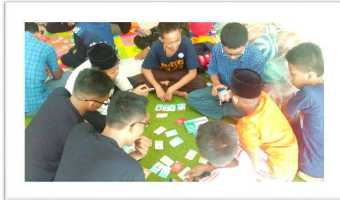
Kegiatan Peace Santren