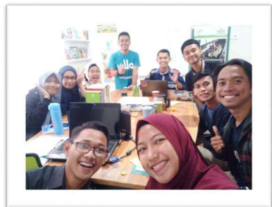
Kantor Peace Generation