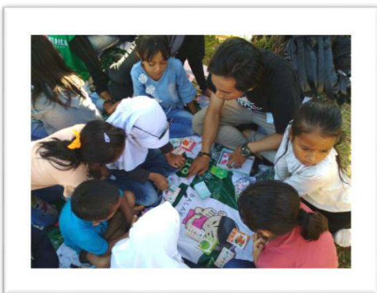
Kegiatan Kolaborasi Komunitas