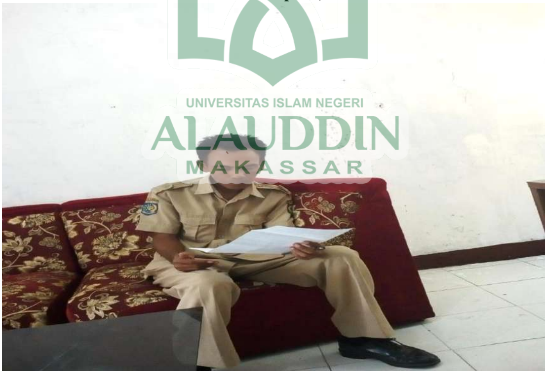
(Foto salah satu Staf Desa Simpasai saat membaca Surat Tembusan Penelitian di Kantor Desa Simpasai)