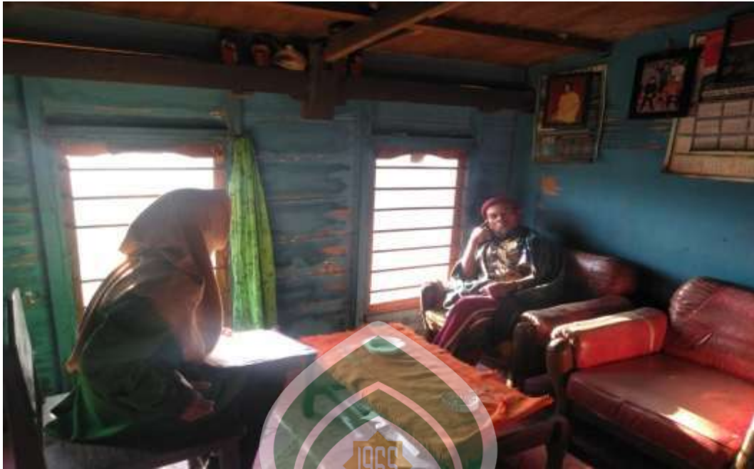
Gambar 7. Wawancara Bapak Panik. K (Tokoh Adat)