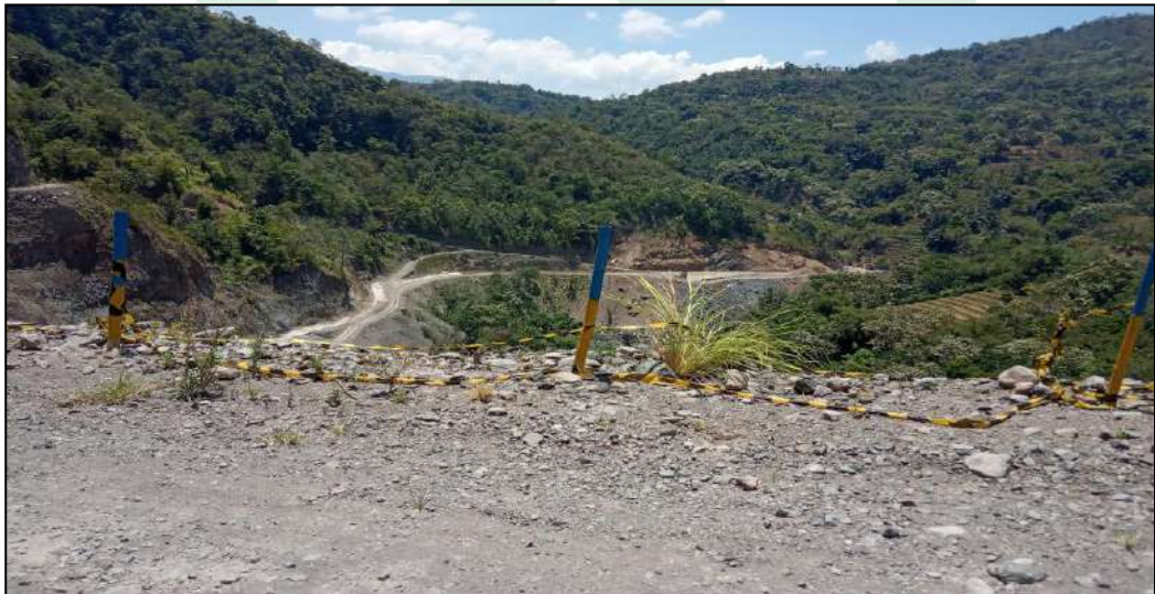
Foto lokasi observasi lapangan