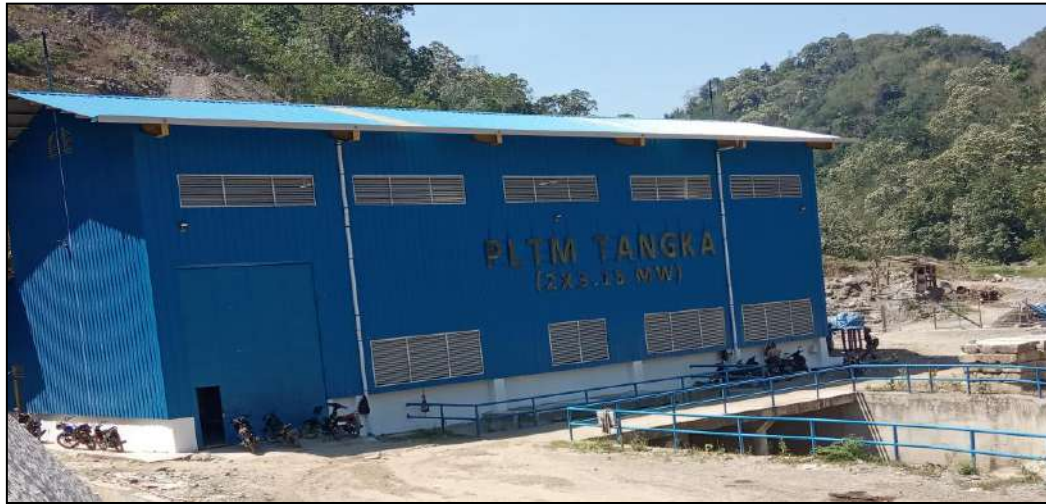
Foto Lokasi PLTM