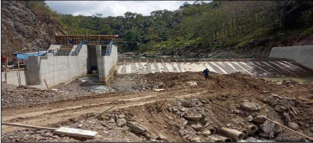
Foto observasi lapangan lokasi bendungan

UNIVERSITAS ISLAM NEGERI ALAUDDIN M A K A S S A R