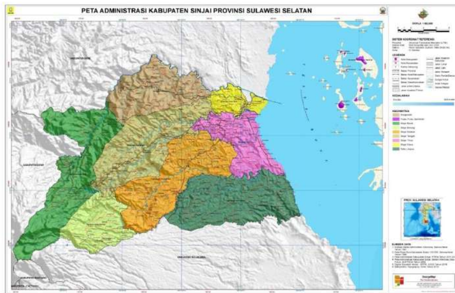
Gambar I Peta Wilayah Kabupaten Sinjai

Sumber Data: Badan Pusat Statistik Kabupaten Sinjai 2019