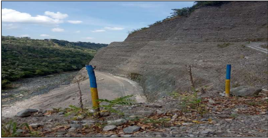
Foto lokasi observasi lapangan