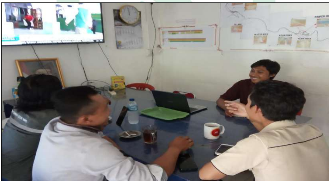
M A K A S S A R Foto wawancara bersama dengan pihak perusahaan