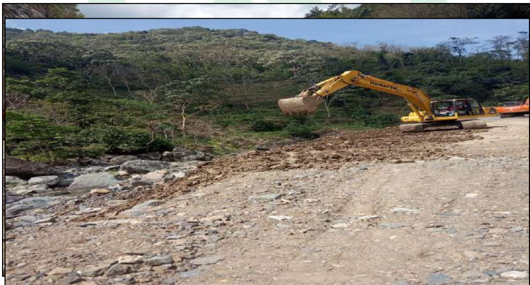
Foto Lokasi observasi lapangan