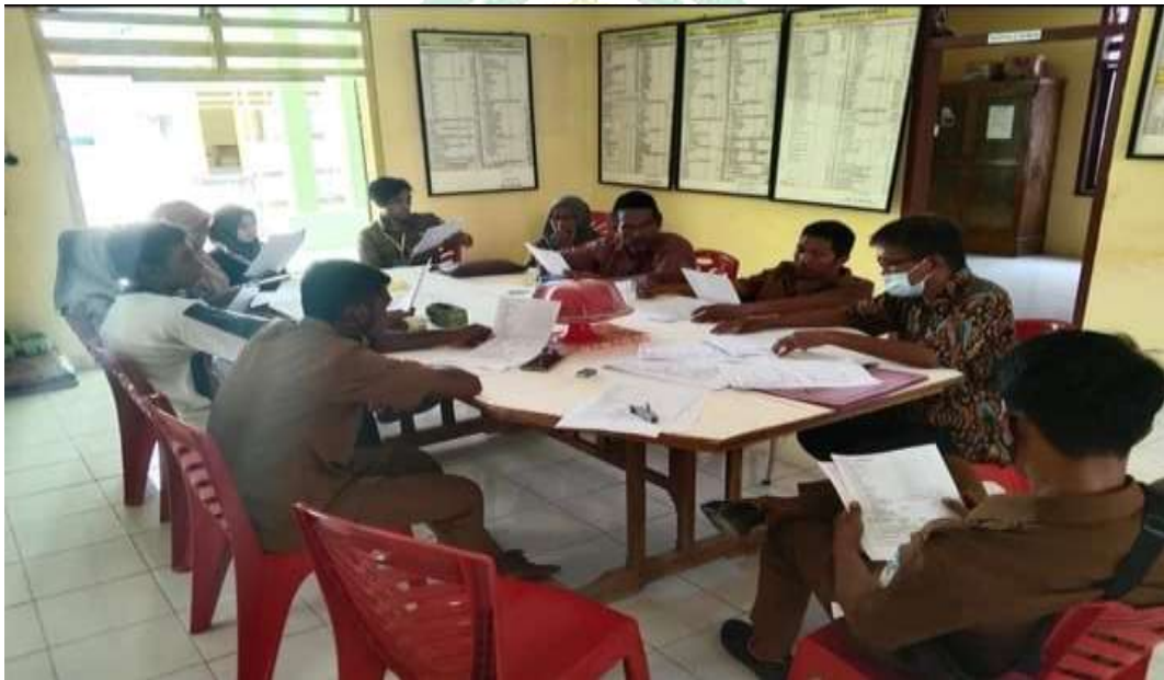
Kantor Desa Pulau Rajuni