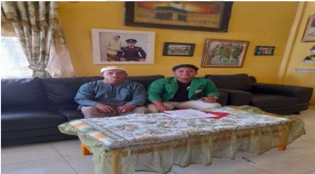
Wawancara bersama Pengusaha Desa Rajuni