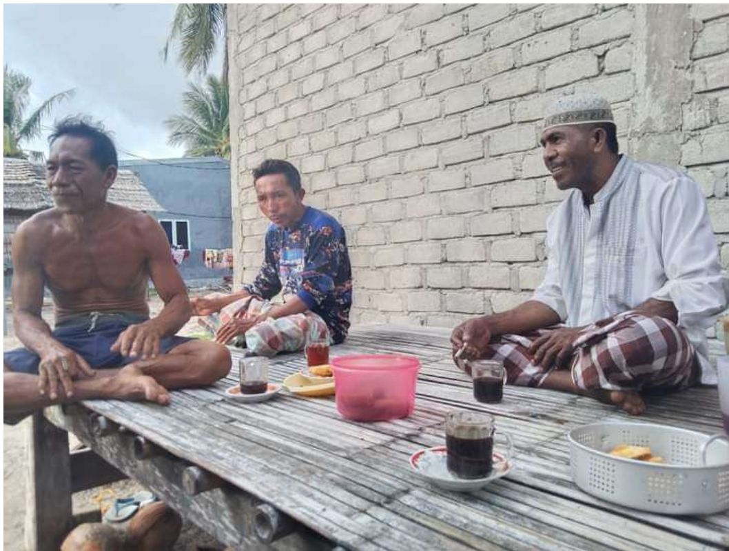
Pengusaha Dan ABK Kapal Di Desa Rajuni