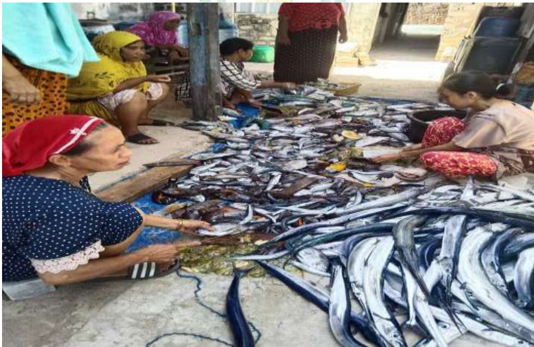
Warga Pulau Desa Rajuni