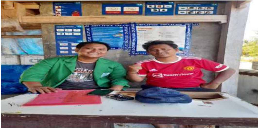
Wawancara Bersama Toko Pemudah dan Pengusaha di Desa Rajuni