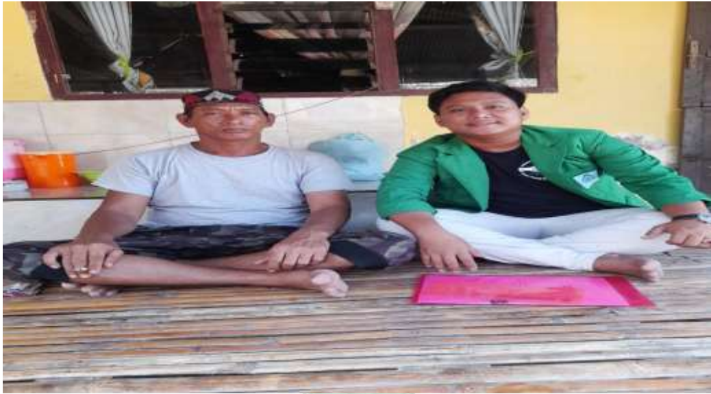
Wawancara Bersama Pengusaha Desa Rajuni