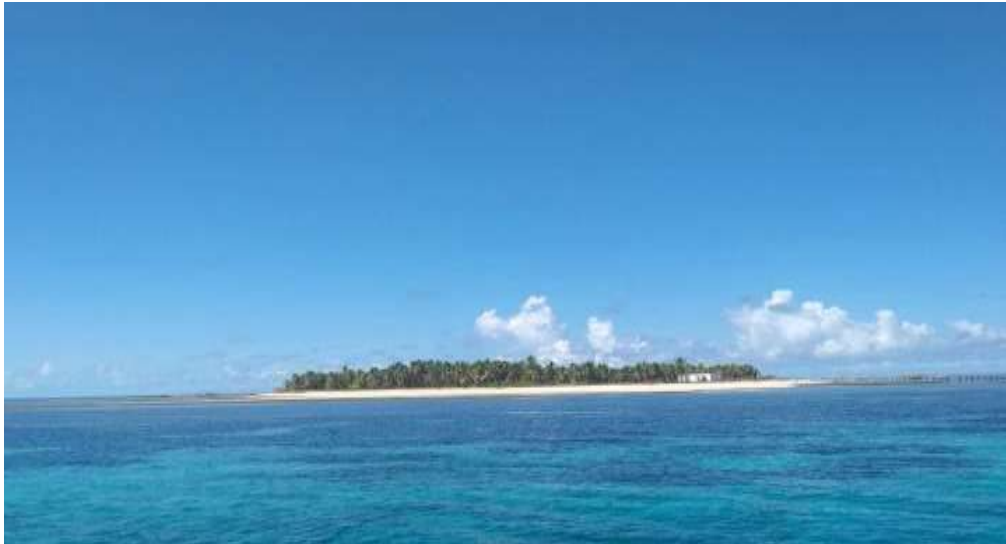
Pulau Desa Rajuni