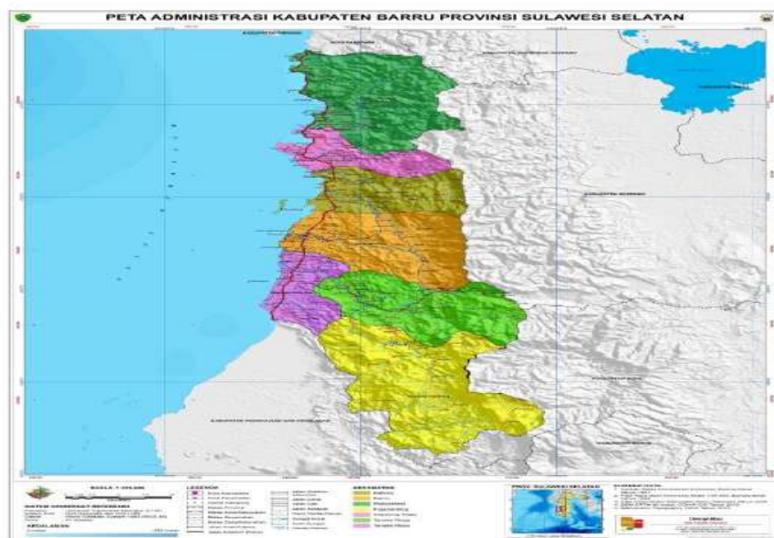
Gambar 4.1. Peta Kabupaten Barru