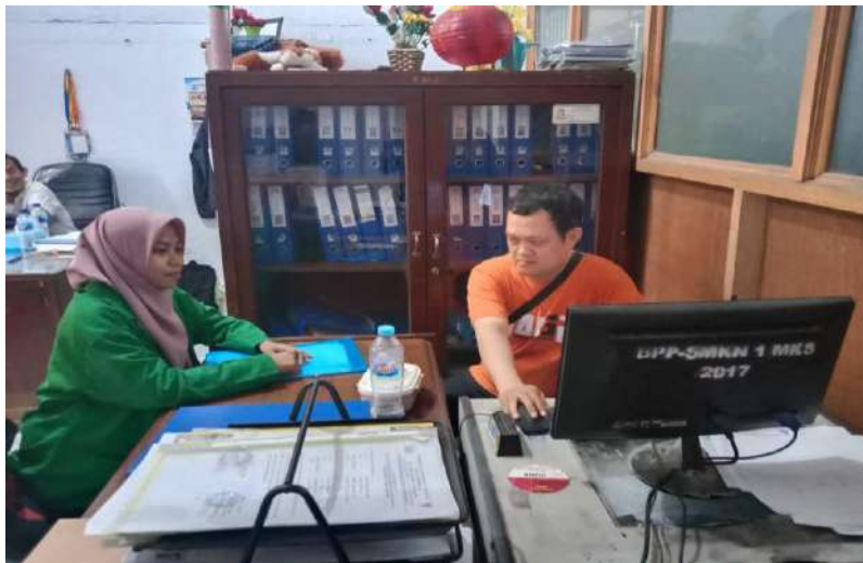
Meminta Data Sekolah Ke Bagian Tata Usaha SMK Negeri 1 Makassar