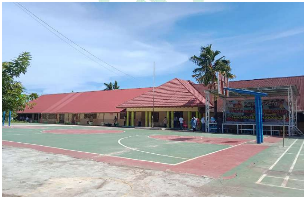
Tampak Depan SMK Negeri 1 Makassar