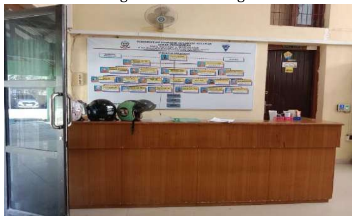
Kondisi Tempat Piket Guru di SMK Negeri 1 Makassar