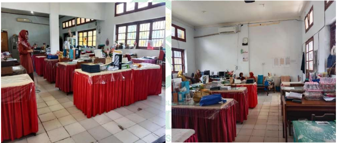
Kondisi Ruang Guru di SMK Negeri 1 Makassar