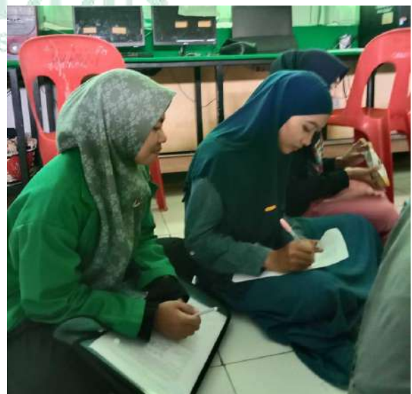
Penyebaran Kuesioner Kepada Guru di SMK Negeri 1 Makassar